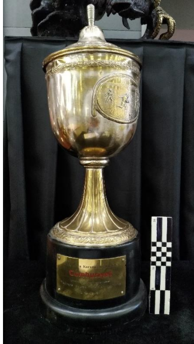
(Beşiktaş JK Müzesi Envanter No: 27)

Ek-10: Cumhuriyet gazetesi tarafından İstanbul Tayyare Kupası Turnuvası birincisi Beşiktaş Kulübü'ne verilen kupa.