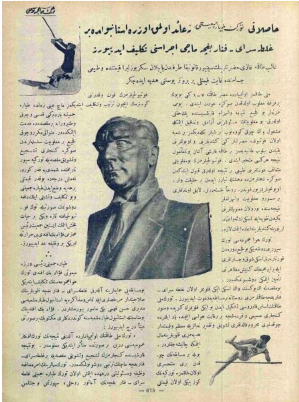
(Türk Hava Mecmuası, Sayı: 50, 15 Haziran 1928, s.675)