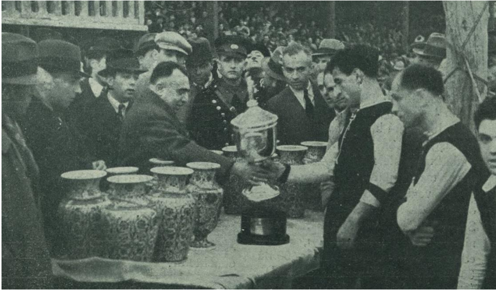
(Havacılık ve Spor, Sayı: 209- 15 Şubat 1938, Arka Kapak)

Ek-8: İstanbul Tayyare Kupası Turnuvası'nı kazanan Beşiktaş Kulübü sporcuları Cumhuriyet gazetesi tarafından verilen kupayı alırken.