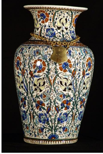
(Beşiktaş JK Müzesi Envanter No: 26)

Ek-10: Cumhuriyet gazetesi tarafından İstanbul Tayyare Kupası Turnuvası birincisi Beşiktaş Kulübü'ne verilen kupa.