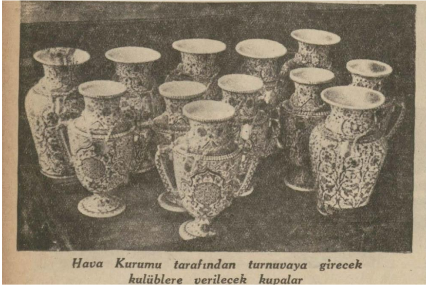
Hava Kurumu tarafından turnuvaya girecek kulüblere verilecek kupalar

(Cumhuriyet, Sayı: 4049, 23 Ağustos 1935, s.8)