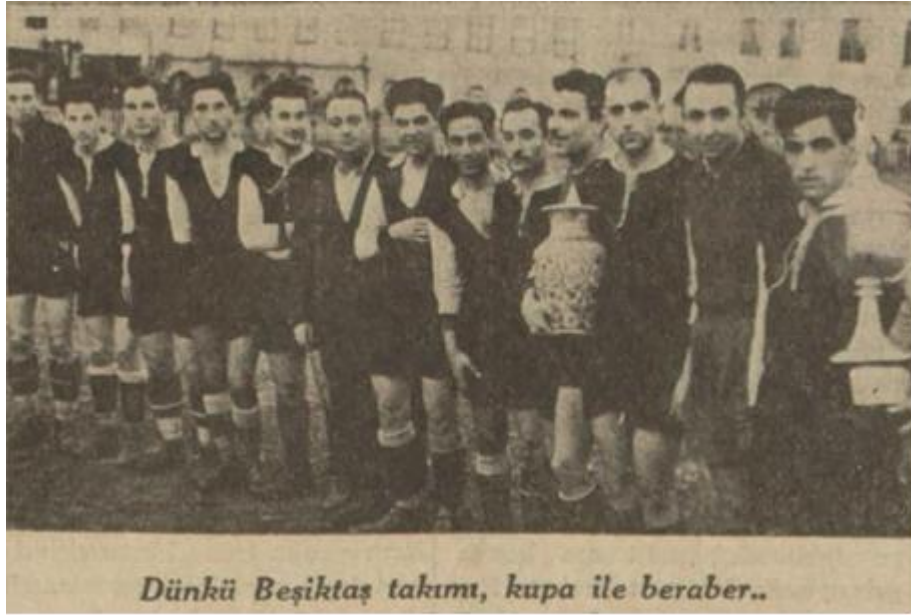
(Tan, Sayı: 0991, 31 Ocak 1938, s.1)

Ek-8: İstanbul Tayyare Kupası Turnuvası'nı kazanan Beşiktaş Kulübü sporcuları Cumhuriyet gazetesi tarafından verilen kupayı alırken.