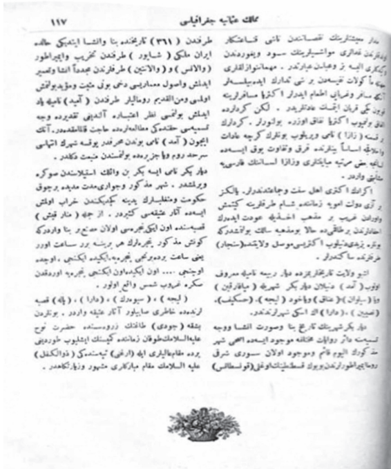
Behram Münir, Vatan-ı Mukaddes Yahud Memalik-i Osmaniye Coğrafyası , s. 117.

1900'lü yılların başında telif edilen coğrafya kitaplarında da Zazalar ve Zaza coğrafyası hakkında muhtasar da olsa çeşitli bilgiler bulunmaktadır. Bu bağlamda, Abdurrahman Efendi'nin tarihsiz Memalik-i Osmaniye Coğrafyası isimli eserinde bir Zaza vilayeti olan Dersim için "Dersim sancağı Kürt aşiretleri ile meskündür" denilmektedir. Yine, Abdurrahman Şeref'in 1905 tarihli Coğrafyay-ı Umumi isimli eserinin birinci cildinde "Dersim, dağlık bir bölge olup Kürt kabileler meskündür" ifadesi yer almaktadır (Biçer, 2019a: s. 83). Son olarak, Münir Bey tarafından hazırlanan Vatan-ı Mukaddes Yahud Memalik-i Osmaniye Coğrafyası isimli kitapta Kürdistan coğrafyası, ahali ve lisanları hakkında çok teferruatlı bilgiler yer almaktadır. Kitapta Diyarbakir Vilayeti hakkında bilgi verilirken Zazalardan da bahsedilmekte ve şöyle denilmektedir: "Kürtlerin bir kısmına Zaza adı verilip aralarında adet ve temel ahlakça esasen fark yok ise de dilleri bazı farklılıklar taşımaktadır. Konuştukları Zaza lisanının Farsçaya benzerliği vardır" (Behram Münir, 1328, s. 114-117).