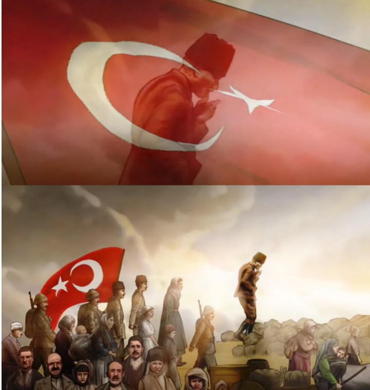
Resim 16. 30 Ağustos Zafer Bayramı Animasyonundan Bir Görüntü (Tiryaki Agro Gıda 2022)

Dahası, Türk Bayrağı'nın şeffaflaşmasının ardından Mustafa Kemal Atatürk ve destansı bir mücadelenin diğer kahramanları, vatanlarını en karanlık saatlerinde savunmanın zorluğuna göğüs gererek ortaya çıkmaktadır (Resim 16). Mustafa Kemal Atatürk'ün yöneldiği tarafta kara bulutların dağıldığını gösteren parıltılı bir ışık oluşmaktadır. Bu sahne, izleyicilere “karanlık günlerin artık geride kaldığını” dokunaklı bir şekilde hatırlatırken, aynı zamanda “aydınlık yarınlar” fikrine de vurgu yapmaktadır. Sahne, 30 Ağustos Zaferi'nin azmin, istikrarın bir sonucu ve inancın doruk noktası olduğu fikrini daha da pekiştirmektedir. Animatörün, senaryo kapsamının gerektirdiği karakterlerin ve mekanların görsel unsurlarını saptadığı anlaşılmaktadır. Karar verilen karakter tipleri ve mekanlar, film oluşumunun sonuna kadar tutarlılık göstermektedir (Arıkan 2001).