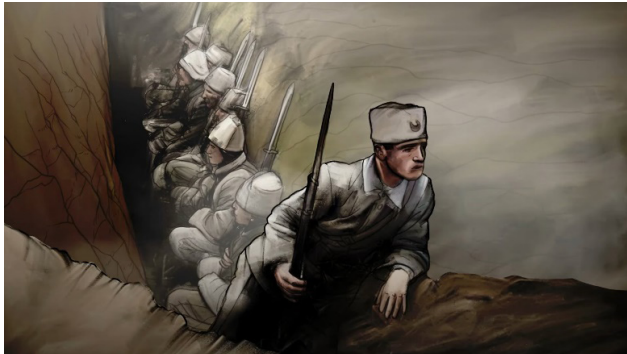
Resim 11. 30 Ağustos Zafer Bayramı Animasyonundan Bir Görüntü (Tiryaki Agro Gıda 2022)

Akabinde, Türk ordusunun cephelerde eşi benzeri görülmemiş kahramanlıklarındaki cesaretini ve özverisini vurgulayan Resim 11'deki sahneye geçilerek Milli Mücadele'nin metaneti vurgulanmaktadır. Sahneye şiirin güçlü sesi “Bitmeyen azim, mücadele, tutku yetişir, vatan aşkı yetişir” eşlik etmekte ve fedakârlık temasını daha da pekiştirmektedir. Sahnede canlandırılan karakterler orantılıdır ve Milli Mücadele ruhunu yansıtacak şekilde tasarlanmıştır. Sahne, duygusal geçiş sürecini adeta izleyiciye tamamlamaktadır. Bir sonraki sahne yerini almadan önce, görüntüler bir müddet sahnede kalmakta ve kamera yavaşça içeri doğru yaklaşmaktadır. Bu süre boyunca, heyecan verici şiir, kemiklerimize işlemeye devam etmekte ve derin bir vatanseverlik duygusu uyandırmaktadır.