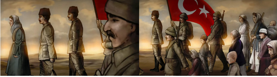
Resim 13. 30 Ağustos Zafer Bayramı Animasyonundan Bir Görüntü (Tiryaki Agro Gıda 2022)

Seyirciyi, 30 Ağustos zaferiyle Anadolu'nun ve Türk Milletinin kurtuluşuna öncülük eden Ulu Önder Mustafa Kemal Atatürk'ün Afyon Kocatepe'de Etem Hamdi Tem tarafından çekilen fotoğrafından referans alınarak çizilen bir sahne karşılamaktadır (Resim 14). Şenler (2005: 108), canlandırma sinemasının esas güçlüğüne, cansız bir nesneye veya görüntüye dinamizm ve canlılık aşılama çabası olduğunun altını çizmektedir. Ayrıca Atatürk'ün yer aldığı bu sahne, ulusal gururun ve Türk halkının zorluklara karşı kazandığı zaferin bir temsili olarak hizmet etmekte; akabinde, "Gün gelir, tam zamanında bir lider çıkar milletin imdadına yetişir" sesiyle büyük zafere ayna tutmaktadır. Bu yüzdendir ki, bu sesin hemen ardından, bir önceki sahneden (Resim 13) bu sahneye (Resim 14) geçiş yapılmaktadır.