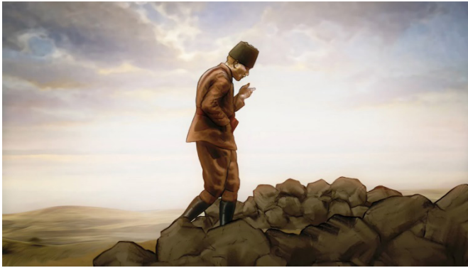
Resim 14. 30 Ağustos Zafer Bayramı Animasyonundan Bir Görüntü (Tiryaki Agro Gıda 2022)

Seyirciyi, 30 Ağustos zaferiyle Anadolu'nun ve Türk Milletinin kurtuluşuna öncülük eden Ulu Önder Mustafa Kemal Atatürk'ün Afyon Kocatepe'de Etem Hamdi Tem tarafından çekilen fotoğrafından referans alınarak çizilen bir sahne karşılamaktadır (Resim 14). Şenler (2005: 108), canlandırma sinemasının esas güçlüğüne, cansız bir nesneye veya görüntüye dinamizm ve canlılık aşılama çabası olduğunun altını çizmektedir. Ayrıca Atatürk'ün yer aldığı bu sahne, ulusal gururun ve Türk halkının zorluklara karşı kazandığı zaferin bir temsili olarak hizmet etmekte; akabinde, "Gün gelir, tam zamanında bir lider çıkar milletin imdadına yetişir" sesiyle büyük zafere ayna tutmaktadır. Bu yüzdendir ki, bu sesin hemen ardından, bir önceki sahneden (Resim 13) bu sahneye (Resim 14) geçiş yapılmaktadır.