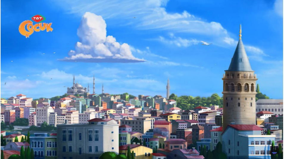
Resim 7. “Rafadan Tayfa” Adlı Çizgi Filminden Bir Görüntü (Rafadan Tayfa 2000)

TRT Çocuk ‘un sevilen dizisi Rafadan Tayfa, yalnızca bunlarla da sınırlı kalmamaktadır. Sevgi, sabır, özgüven, dürüstlük, yardımseverlik, adalet, güven çalışkanlık, vefa, dayanışma, paylaşma, doğa sevgisi ve vatanseverlik gibi bir dizi saygın değerleri de konu almakta olup ülkemizin önemli tarihi yapılarına konu geçişleri esnasında ev sahipliği yaparak kültürel ve tarihi dinamiklere, bu kadim topraklarda geçmişten bugüne süregelen daha birçok oluşuma ayna tutmakta ve bu oluşumların önemine bir olay örgüsü ile vurgu yapmaktadır (Resim 7).