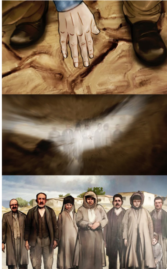
Resim 9. 30 Ağustos Zafer Bayramı Animasyonundan Bir Görüntü (Tiryaki Agro Gıda 2022)

Toprak, gerek insanların beslenmesi, yaşamlarını sürdürebilmesi gerekse toplumlara huzur ve istikrar kaynağı sağlaması bakımından büyük bir öneme sahiptir. İlhan'ın (1989: 722) da belirttiği gibi: “Tarihi olaylarda ve geleceğe yönelik değerlendirmelerde, jeopolitiğin unsurları olan coğrafya ve kültür değerleri esas sebepleri ve temel değerleri oluştururlar. Bu önemleri sebebiyle tehdidin ilk ve son hedefi kültür ve topraktır.” Bu ifade, toprağın bir ulusun siyasi ve kültürel kimliğinde oynadığı kritik rolü ve onu tehditlere karşı koruma ihtiyacını açıkça vurgulamaktadır. Öte yandan, “Toprak ve vatan, birbiriyle özdeşleşen ve yüklenilen anlama göre değer kazanan varoluş mekânlarıdır. Toprağın vatana dönüşmesini sağlayan en önemli unsur, millî bilinç ve ruhtur” (Deveci ve Kılınç 2020: 142). Bu hususi ifadelerden yola çıkıldığında, bu sahne, toprağın derinliklerindeki mevcut olan aktif gücü işaret ederek vatanın ve milletin bölünmez bütünlüğünü esas almakta, toprağın vatan olabilmesinde millî şuur ve ruhun önemini ortaya koymaktadır (Resim 9). Bir toprağın sevdalısı olmanın önemi, o toprak uğruna her alanda emek verip ter dökmenin delaleti ve bunun bir millî görev olduğu idraki içinde bulunmanın gerekliliği karakterin toprağı aralaması ile yansıtılmaktadır. Kamera hareketi, ulus ile toprak arasındaki derin bağı öne çıkarmaya, karakterlerin diğer görsel unsurlarla koordinasyon sağlamasına ve ses tasarımı ile etkileşime girmesine yardımcı olmaktadır.