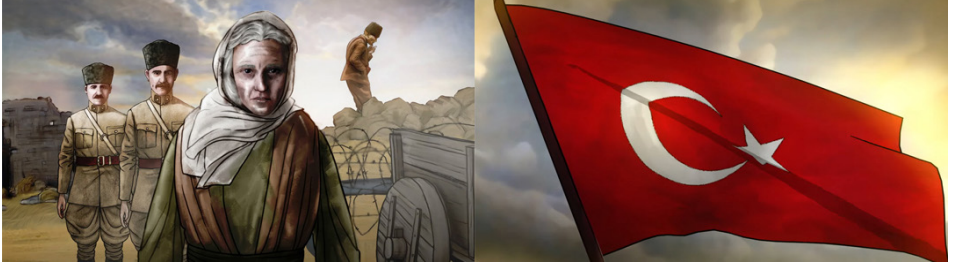
Resim 15. 30 Ağustos Zafer Bayramı Animasyonundan Bir Görüntü (Tiryaki Agro Gıda 2022)

Dahası, Türk Bayrağı'nın şeffaflaşmasının ardından Mustafa Kemal Atatürk ve destansı bir mücadelenin diğer kahramanları, vatanlarını en karanlık saatlerinde savunmanın zorluğuna göğüs gererek ortaya çıkmaktadır (Resim 16). Mustafa Kemal Atatürk'ün yöneldiği tarafta kara bulutların dağıldığını gösteren parıltılı bir ışık oluşmaktadır. Bu sahne, izleyicilere “karanlık günlerin artık geride kaldığını” dokunaklı bir şekilde hatırlatırken, aynı zamanda “aydınlık yarınlar” fikrine de vurgu yapmaktadır. Sahne, 30 Ağustos Zaferi'nin azmin, istikrarın bir sonucu ve inancın doruk noktası olduğu fikrini daha da pekiştirmektedir. Animatörün, senaryo kapsamının gerektirdiği karakterlerin ve mekanların görsel unsurlarını saptadığı anlaşılmaktadır. Karar verilen karakter tipleri ve mekanlar, film oluşumunun sonuna kadar tutarlılık göstermektedir (Arıkan 2001).