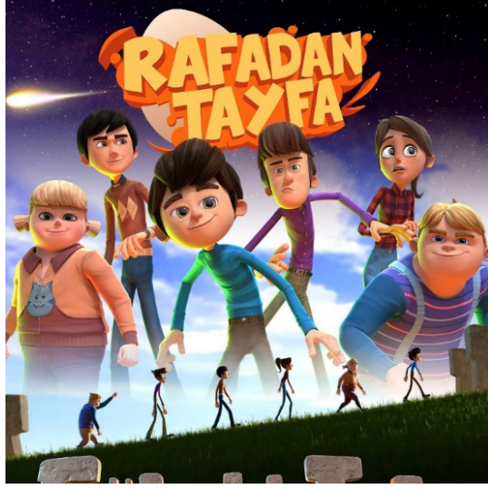
Resim 6. “Rafadan Tayfa” Adlı Çizgi Filme Ait Bir Kapak Görseli (TRT Çocuk 2022)

TRT Çocuk ‘un sevilen dizisi Rafadan Tayfa, yalnızca bunlarla da sınırlı kalmamaktadır. Sevgi, sabır, özgüven, dürüstlük, yardımseverlik, adalet, güven çalışkanlık, vefa, dayanışma, paylaşma, doğa sevgisi ve vatanseverlik gibi bir dizi saygın değerleri de konu almakta olup ülkemizin önemli tarihi yapılarına konu geçişleri esnasında ev sahipliği yaparak kültürel ve tarihi dinamiklere, bu kadim topraklarda geçmişten bugüne süregelen daha birçok oluşuma ayna tutmakta ve bu oluşumların önemine bir olay örgüsü ile vurgu yapmaktadır (Resim 7).