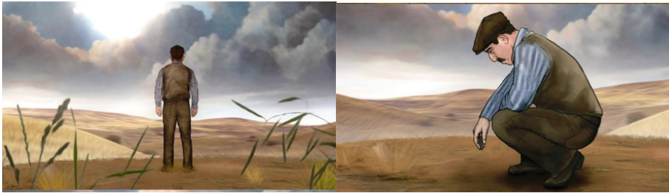
Resim 8. 30 Ağustos Zafer Bayramı Animasyonundan Bir Görüntü (Tiryaki Agro Gıda 2022)

Açılış sahnesi, usta oyuncu Çetin Tekindor'un izleyicinin içine işleyen “Dur ve soluklan” sesiyle başlamaktadır. Akabinde, “şöyle bir çevrene bak!” sözünün seyriyle çiftçi olduğu düşünülen karakterin toprağa yöneldiği görülmektedir (Resim 8). Bu sahnede, kadim toprakların korunmasında mücadele vermiş Anadolu halkının timsaline geçiş yapmakta, üzerinde yaşadığımız bu kadim toprak parçasının sıradan bir toprak parçası olmadığı, her karış toprağının şehit kanlarıyla bezendiğinin, gerekirse her bir bireyin bu topraklar için canını feda etmeye hiç kuşkusuz gönüllü olacağını vurgusu yapılmaktadır. Adeta, Türk yazar ve şair olan Mithat Cemal Kuntay'ın şiirindeki “Toprak, eğer uğruna ölen varsa vatandır” dizesinin perde arkasını seyirciye yaşatmaktadır (Karagözoğlu 2018).