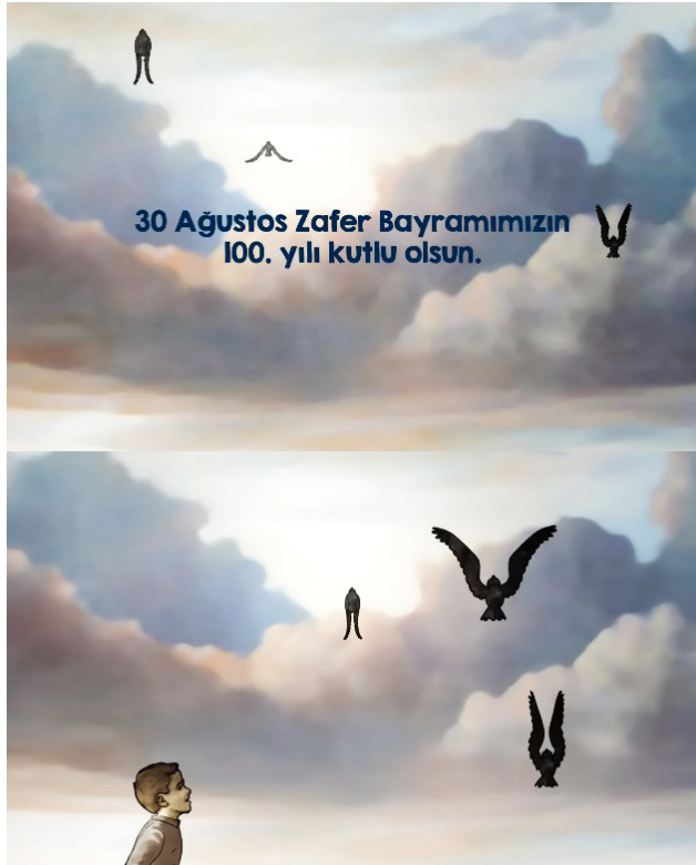
Resim 19. 30 Ağustos Zafer Bayramı Animasyonundan Bir Görüntü (Tiryaki Agro Gıda 2022)

İstiklal ve İstikbal duygusuyla süzülen kuşların, izleyiciye Gazi Mustafa Kemal Atatürk'ün “İstikbal göklerde” sözünü çağrıştıracak görkemli bir şekilde göklerin ihtişamına yöneldiği görülmektedir (Resim 19). Kuşlar, zirvelere yükselmeye kararlı bir ulusun sınırsız potansiyelinin bir temsiline hizmet etmektedir. Buna takiben, Türk tarihindeki bu büyük zaferin önemini ve büyüklüğünü vurgulayan “30 Ağustos Zafer Bayramımızın 100. Yılı Kutlu Olsun.” dilsel mesajı ortaya çıkmakta ve tarihi zaferin anlam ve öneminin bir kez daha pekiştirilmesi amaçlanmaktadır.