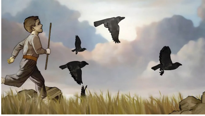
Resim 18. 30 Ağustos Zafer Bayramı Animasyonundan Bir Görüntü (Tiryaki Agro Gıda 2022)

İstiklal ve İstikbal duygusuyla süzülen kuşların, izleyiciye Gazi Mustafa Kemal Atatürk'ün “İstikbal göklerde” sözünü çağrıştıracak görkemli bir şekilde göklerin ihtişamına yöneldiği görülmektedir (Resim 19). Kuşlar, zirvelere yükselmeye kararlı bir ulusun sınırsız potansiyelinin bir temsiline hizmet etmektedir. Buna takiben, Türk tarihindeki bu büyük zaferin önemini ve büyüklüğünü vurgulayan “30 Ağustos Zafer Bayramımızın 100. Yılı Kutlu Olsun.” dilsel mesajı ortaya çıkmakta ve tarihi zaferin anlam ve öneminin bir kez daha pekiştirilmesi amaçlanmaktadır.