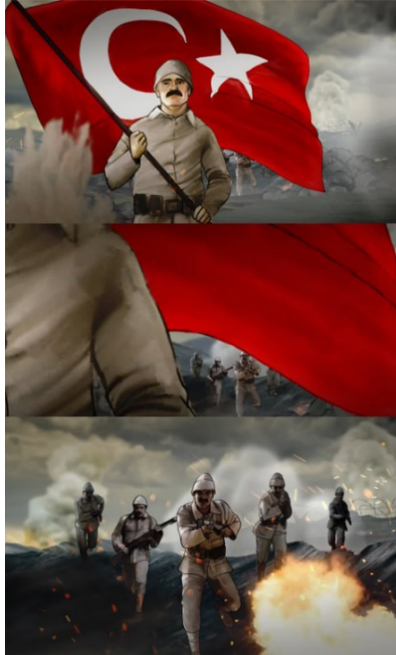
Resim 12. 30 Ağustos Zafer Bayramı Animasyonundan Bir Görüntü (Tiryaki Agro Gıda 2022)

Deveci ve Kılınç (2020: 153); bayrak, toprak ve vatan üzerinde yaşayan ve onu savunanlar için en kutsal değere sahip olduğunu ve bu kutsallığı bünyesinde barındıran eserler yaratma eyleminin gelecek için bir hafıza niteliği taşıdığını ileri sürmektedir. Resim 12’de, şanlı Türk bayrağı, Türkiye’yi ve Türk insanını temsil eden bir asker tarafından gurur ve onurla sınıksız tutulmaktadır. Kamera hızla yaklaşır bayrak gururla dalgalanırken vatani ve milleti için savaşan daha çok Türk askeri belirilmekte ve Millî Mücadele’nin perde arkasındaki koşulsuz fedakârlık vurgulanmaktadır. Topyekûn ateş altında kalmalarına rağmen yiğit Türk askerleri, Millî Mücadele ruhuyla sarsılmaz kararlılığını ve istikrarını korumaktadır. Ateş etkileri ve patlama sesleri, izleyicilerin sürükleyici bir savaş atmosferine ilişkin deneyimlerini daha da derinleştirerek askerlerin muazzam mücadelesini ve cesaretini gözler önüne sermektedir. Sahnede gri tonlar hâkim olurken, şehitlerin dökülen kanlarını simgeleyen şanlı Türk bayrağının kırmızı rengi, sahnede bir kontrastlık (karşıtlık) oluşturmakta, adeta bir Ulusun kurttarıcısı olduğu duygusunu öne çıkarmakta ve kutsallaştırmaktadır. Bu bağlamda sahnedeki renkler, seyircinin senaryonun tüm görsel unsurlarını saptamasına yardımcı olan, bir dizi vatani duyguyu çağrıştıran bir ifade paleti görevi görmektedir.