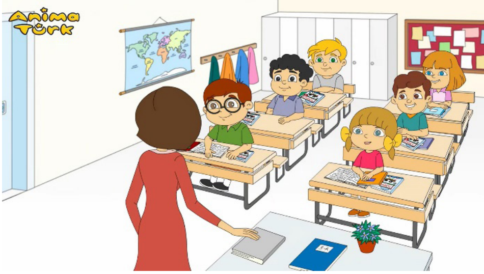
Resim 2. “Okul Kuralları” Adlı Animasyondan Bir Görüntü (AnimaTurk Tv 2019a)

Okul, öğrenciler için önemli bir alandır. Bu alanda kendisine saygı duyan bir öğrenci, sınıf arkadaşlarına ve çevresine de saygı gösterme eğiliminde olacaktır. Okulda uygun davranışlar sergileme konusundaki farkındalığın artırılması ve öğrencilerin okul kurallarını daha iyi anlamalarına, bunları uygulamalarına yardımcı olmak için ÇBİ (Çayeli Bakır İşletmeleri) tarafından desteklenen eğitici, öğretici ve bilgilendirici bir animasyon hazırlanmıştır (Resim 2). Bu animasyon, öğrencilerin okul kurallarının detaylarına hâkim olmalarını sağlamakta ve öğrencileri doğrudan ilgilendiren okul normlarını daha iyi anlamalarına yardımcı olmaktadır.