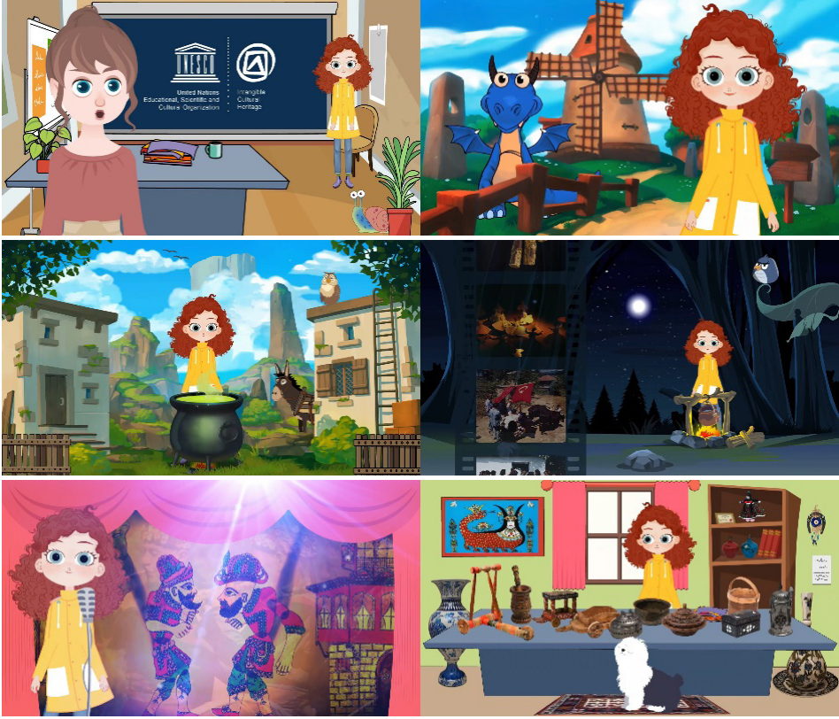
Resim 4. "UNESCO Somut Olmayan Kültürel Miras", 6 Adet Kısa Animasyon Film (KAV 2021)

Bu doğrultuda yerli yapım çizgi filmlerin de bu zengin kültürel değerlerden beslen- diği açıkça gözlemlenmektedir. Çizgi filmler özellikle de çocukların hayatlarının mer- kezinde önemli bir yere sahiptir. Kurgu ve gerçekliğiyle, çocuklarını içine çekmekte, davranışlarını da büyük ölçüde yön vermektedir. Çizgi filmler, biçimsel olarak kültür ve değer aktarımının yapılmasına yönelik tasarlanmamış olsa da çocuklar örtük bir şekilde içeriğin akışında yer alan değerlere dolaylı yollarla maruz kalmaktadırlar (Kay- mak ve Öğretim Özçelik 2020). Çizgi filmlerde yer alan karakterler aracılığıyla çocuk- lar, bencillik ve açgözlülük gibi olumsuz davranışların etkisinin yanı sıra nezaket ve dürüstlük gibi olumlu davranışların faydalarını da gözlemleyebilmektedir. Hâl böyle olunca çocukların olumsuz mesajlardan kaçınan, olumlu değer yapılarını içerisinde barındıran yapıtlarla buluşturulması gerekmektedir. Bu unsurları içeren çizgi filmler, çocuklara olumlu yönde rol model olarak onları gündelik hayatla özdeşleştirebileceği karakterlerle ve olaylarla karşı karşıya kalmalarını sağlamakta, böylece çocukların ah- laki bir pusula geliştirmelerine, bilinçli kararlar vermelerine yardımcı olmakta ve do- layısıyla, analiz etme ve problem çözme becerisini de çocuklara doğrudan ya da dolaylı yoldan kazandırmaktadır. Bu duruma ilişkin bir örnek, aşağıda verilmiştir (Resim 5).