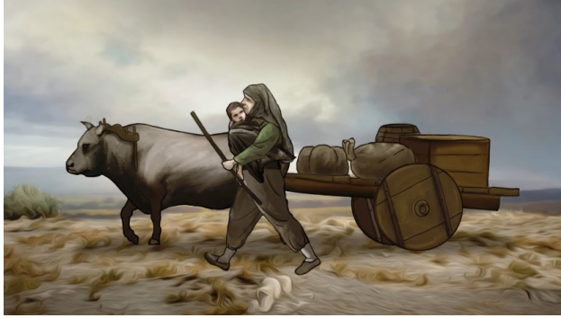
Resim 10. 30 Ağustos Zafer Bayramı Animasyonundan Bir Görüntü (Tiryaki Agro Gıda 2022)

“Kahraman denilince sadece erkekler akla gelmemelidir. Türk tarihi birçok başarıya imza atmış kadın kahramanlarla doludur” (Karakuş ve Çoksever 2019: 48). Anadolu'nun kurtuluşunda cephelerde yiğitçe yer alan korkusuz kadınlar, gece gündüz ekmek pişirip askerlere yemek götüreren gelin kızlar, ordunun erzak ihtiyacını karşılamakla kalmayıp, canını dişine takarak vatanları için de savaşmışlardır. Bu husus, eskiden insanların yük taşımak için kullandıkları, genel olarak öküzler tarafından çekilmesiyle kullanılan bir kağrı arabası ve kucağında bebekle vatani için her zaman dik duran cesur bir kadın sureti ile gösterilmektedir (Resim 10). Bu suret, memleketin bekası ve ihyası için mücadele eden