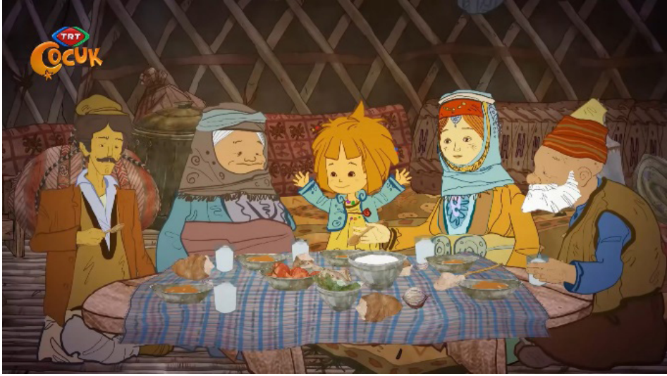
Resim 5. "Maysa ve Bulut" Adlı Çizgi Filminden Bir Görüntü (Maysa ve Bulut 2019)

Yemeğin kültürle güçlü bir bağlantısı vardır. Bununla birlikte, yemeğin hazırlanma, sunulma ve tüketilme biçimi de bir kültürün önemli bileşenlerini temsil etmektedir. Ayrıca, yemeğin aileyle, akrabayla ve arkadaşlarla paylaşıldığı ve tadının çıkarıldığı yer, günlük yaşamın, kültürün ve evin hayati bir parçası olmaktadır. Bu bağlamda TRT Çocuk'ta 2013-2014 yılları arasında yayınlanan "Maysa ve Bulut" adlı çizgi filmindeki yer sofrası sahnesi, toplumun temel yapı taşlarından biri olan aile kavramını destekleyen geleneksel bir sosyalleşme yöntemine dikkat çekmektedir. Bu sebeple; bu sahne, bir toplum için basit bir yemek tüketiminden çok daha fazlasını ifade etmekte ve aynı zamanda sosyo-kültürel kimliklenme açısından da oldukça önem arz etmektedir.