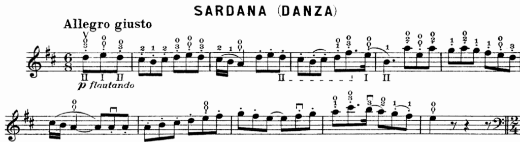
Şekil 7. Gaspar Cassadó Viyolonsel Suit 2. Bölüm 1. - 11. ölçüler arası

B Konturpuan (ölçü 44-52) + (mm. 53-72) + (mm. 73-102)