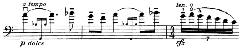
Şekil 3. Gaspar Cassadó Viyolonsel Suit 1. Bölüm 11. ve 12. ölçüler

İlk iki ölçüye cevap niteliği taşıyan 3., 4 ve 5. ölçülerde (Şekil 2) tiz melodi tempo içinde düşünülerek ifade edilmelidir. Dolayısı ile 3'lü ve 4'lü akorlar tempodaki melodi zamanından önce çalınmalıdır.