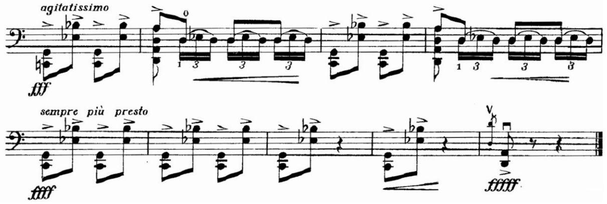
Şekil 20. Gaspar Cassadó Viyolonsel Suit 3. Bölüm 192. – 199. ölçüler arası

192. ölçüden itibaren (Şekil 20) arşede olan çift sesli aksanlar arşe ile tel arasındaki bağlantı hazırlanıp çalınmalıdır. 193. ölçüde ilk zamandaki akor sesi kısa düşünülüp ikinci zamanda olan notaya daha küçük bir arşe kullanımıyla başlayıp nüansı büyötmeye dayalı bir çalış gerçekleştirilmelidir. 196. ölçüden itibaren tempoyu hızlandırarak arşe aksanlarının net bir şekilde yapılması gerekmektedir.