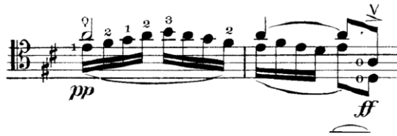
Şekil 10. Gaspar Cassadó Viyolonsel Suit 2. Bölüm 30. ve 31. ölçü

20. ölçüde (Şekil 9) pus pozisyonunda sol elin yatay pozisyonda net bir entonasyonla çalınmasına dikkat edilmeli ve arşedeki aksanlar net bir şekilde yapılmalıdır. Bunun için çalışma esnasında yavaş bir tempo ile nota geçişlerinde arşe durdurularak çalışılmalıdır.