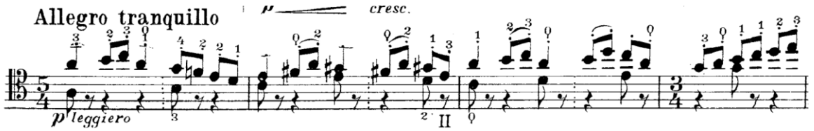
Şekil 18. Gaspar Cassadó Viyolonsel Suit 3. Bölüm 86. - 89. ölçüler arası

34. Ölçüden itibaren gelen akorlarda (Şekil 17) entonasyon için sol el pozisyonunun doğru bir şekilde kalıplandırılması gerekmektedir. Bunun için akorlara bastıktan sonra sesler tek tek çalınıp kontrol edilmelidir. Akor kalıplarından emin olunduktan sonra yazılan arşe aksanları çalışılmalıdır.