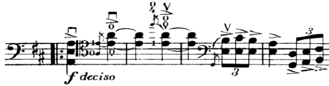
Şekil 11. Gaspar Cassadó Viyolonsel Suit 2. Bölüm 47. - 50. ölçüler arası

30. ölçüde (Şekil 10) sol elde gelen pus pozisyonunda “la” sesi sabit kalırken “re” telindeki melodi pozisyon değiştirdiğinden dolayı baş parmağın (pus) tuşa baskı uygulamaması gerekmektedir. Ayrıca “re” telindeki melodinin artikülasyon yaparak ve sol eldeki pozisyonu esneterek çalınmasına dikkat edilmelidir.