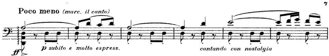
Şekil 12. Gaspar Cassadó Viyolonsel Suit 2. Bölüm 56. - 61. ölçüler arası

47. ölçüde (Şekil 11) akorlar arasında pozisyon farklılıkları olduğu için sol el, pozisyon geçiş yaptıktan sonra çalınmasına özen gösterilmelidir. Arşede de aksanların net bir şekilde yapılmasına dikkat edilmelidir.