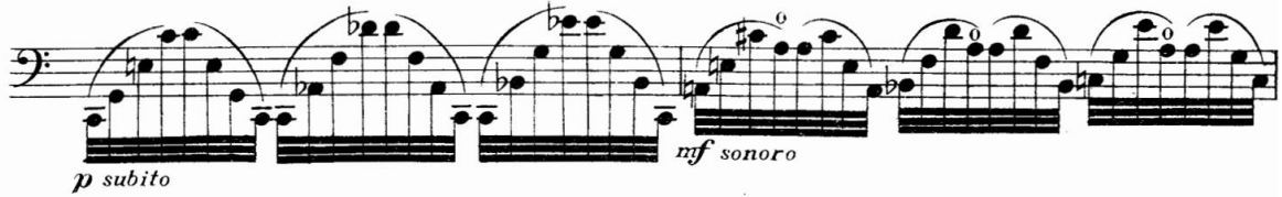
Şekil 6. Gaspar Cassadó Viyolonsel Suit 1. Bölüm 59. ve 60. ölçüler

52. ölçüden itibaren gelen doğuşkan notaların (Şekil 5) sol el pozisyonu hazırlandıktan sonra çalınmasına özen göstermek gerekmektedir. Aksi durumda seslerdeki titreşim duyulmayabilir. Bağlı olan arşelerde arşe ve sol el artikülasyonu seslerin net bir şekilde çıkabilmesi için önemli rol oynamaktadır.