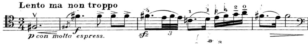
Şekil 14. Gaspar Cassadó Viyolonsel Suit 3. Bölüm 1. ve 4. ölçüler arası

A': a'' (ölçü 136-161) + b' ölçü ( 162-166) + a (ölçü 167-199)