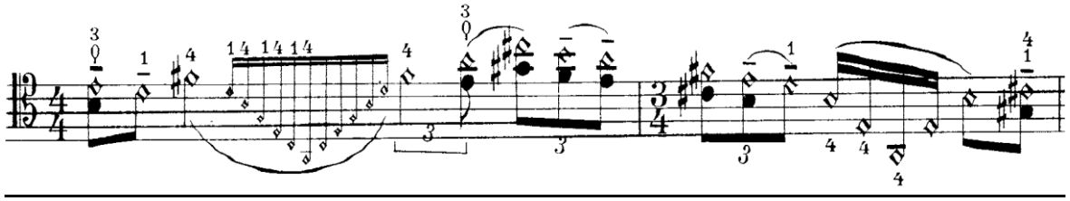
Şekil 5. Gaspar Cassadó Viyolonsel Suit 1. Bölüm 52. ve 53. ölçüler

52. ölçüden itibaren gelen doğuşkan notaların (Şekil 5) sol el pozisyonu hazırlandıktan sonra çalınmasına özen göstermek gerekmektedir. Aksi durumda seslerdeki titreşim duyulmayabilir. Bağlı olan arşelerde arşe ve sol el artikülasyonu seslerin net bir şekilde çıkabilmesi için önemli rol oynamaktadır.