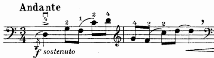
Şekil 1. Gaspar Cassadó Viyolonsel Suit 1. Bölüm 1. ve 2. ölçüler

A Tema 3 (ölçü 64-72) + Tema 2-1(ölçü 73-83)