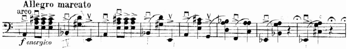
Şekil 17. Gaspar Cassadó Viyolonsel Suit 3. Bölüm 34. -41. ölçüler arası

19-20. ölçülerde (Şekil 16) sol elde net bir artikülasyon ile arşede bağı bir çalış tekniğine ihtiyaç vardır. Bunu sağlayabilmek için arşenin telden ayrılmaması gerekmektedir.