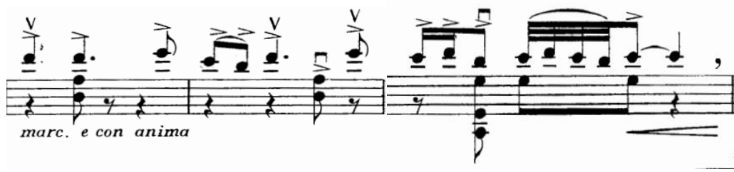
Şekil 2. Gaspar Cassadó Viyolonsel Suit 1. Bölüm 3. - 5. ölçüler arası

güçlendirmek amacı ile akorlardan yararlanılmıştır. İcracının tempo içinde çalarken melodideki zaman akışını bozmaması gerekmektedir.