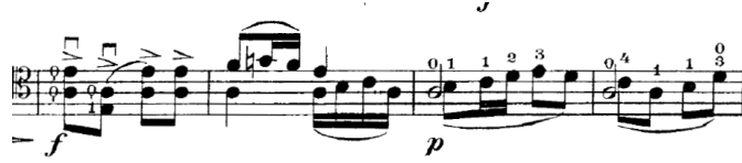
Şekil 9. Gaspar Cassadó Viyolonsel Suit 2. Bölüm 20.- 23. ölçüler arası

12. ölçüden itibaren ikili akorlar güçlü, aksanlı ve net çalınmalıdır (Şekil 8). Bu yüzden arşenin tel ile olan bağlantısı yapıldıktan sonra çalınmasına dikkat edilmelidir. 14 ve 15. ölçülerde “re” telinde gelen melodi 12. ve 13. ölçünün aksine daha az güçlü, bağlı ve sol el artikülasyonu ile çalınmalıdır.