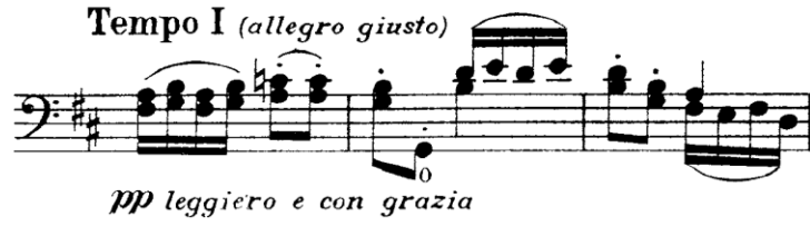
Şekil 13. Gaspar Cassadó Viyolonsel Suit 2. Bölüm 76. – 78. ölçüler arası

76. ölçüde (Şekil 13) “la” ve “re” telinde olan melodik yapının net bir şekilde duyulabilmesi için 16’lık notaların artikülasyon yapılarak ritimli çalışılması gerekmektedir. Pozisyon değişikliklerinde sol el pozisyona hazırlandıktan sonra çalışma başlanmalıdır. Çift sesli çalışılarda melodinin ön planda olmasına dikkat edilmelidir.