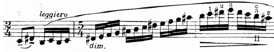
Şekil 16. Gaspar Cassadó Viyolonsel Suit 3. Bölüm 19. ve 20. ölçüler arası

19-20. ölçülerde (Şekil 16) sol elde net bir artikülasyon ile arşede bağı bir çalış tekniğine ihtiyaç vardır. Bunu sağlayabilmek için arşenin telden ayrılmaması gerekmektedir.