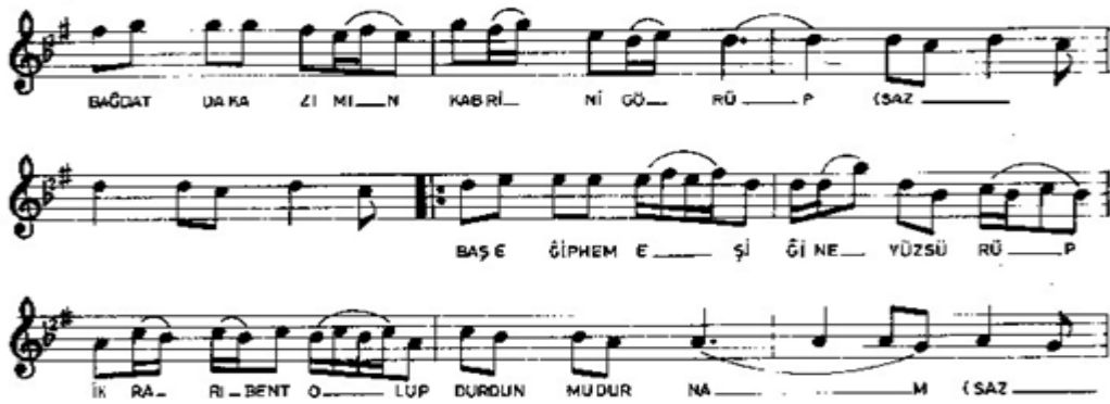
Şekil 3. Zeynel Abidin Türbesi'nde Dönülen "Turnalar Semahı Notası"

Zeynel Abidin Türbesi'nde zakirlik yapan Mürteza AKSÜT, türbede dönülen semahları; "önce nota yoktu otantik olarak semahlarda uygulanan ezgiler kulaktan öğretiyordu. Bu semahlarda uygulanan deyişlerin şu anda notası ve makamı var, fakat elimizde yoktur. Söylerken makamlı söylemeye çalışırız. Örneğin "devredip gezersin darı fenayı Bağdat diyarına vardın mı turnam" diye semahı aslına uygun kulaktan öğrendiğimiz şekli ile makamıyla okuruz. "Turnalar Semahı"nı okuruz. Bu semah, Hüseyin isminde bir aşığımızın yazdığı bir semah, Kırat semahını söyleriz Malatya'da... O, çok eski bir semahtır. "Turnalar Semahı", "Kırat Semahı" konu olarak Kerbela olayından doğmuştur" (Mürteza Aksüt, Malatya/2016) 14 sözleri ile iki semah üzerinden örneklendirerek açıklamıştır.