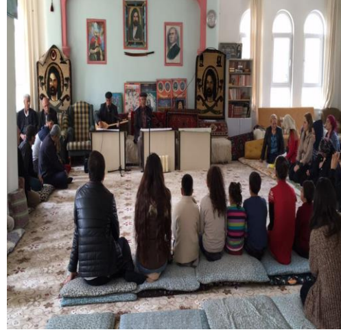
Şekil 1. Malatya Zeynel Abidin Türbesi Cem Ayini Görüntüsü