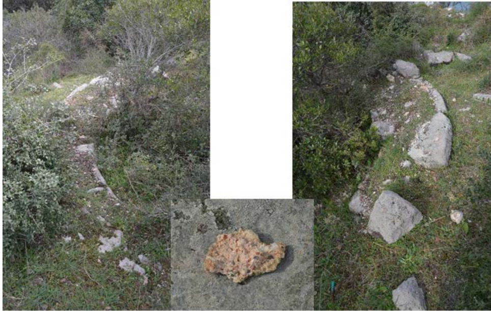
Kale içerisinde yuvarlak planlı yapı ve horasan harç örneği

Orta Çağ'daki Ceneviz hakimiyeti sırasında da bu sur ve kule yapılarının yenilendiği görülür 8 . Güzelcehisar kulesinin duvar tekniği ve işçiliği Amastris'in Ceneviz Dönemi yapıları, İstanbul Anadolu Kavağı'ndaki Yoros Kalesi, Kırım'daki Sudak ve Kaffa, Romanya ve Bulgaristan kıyılarındaki kale yapılarına benzerlik gösterdiğinden, Ceneviz Dönemi'nde inşa edilmiş olduğu anlaşılmaktadır.