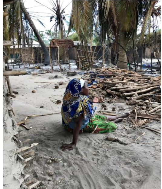
Şekil 2: Cabo Delgado, Macomia'daki Naunde Sakinleri, 5 Haziran 2018'deki Silahlı Saldırının Ardından Köylerini Terk Etmişlerdir (Human Rights Watch, 2018).