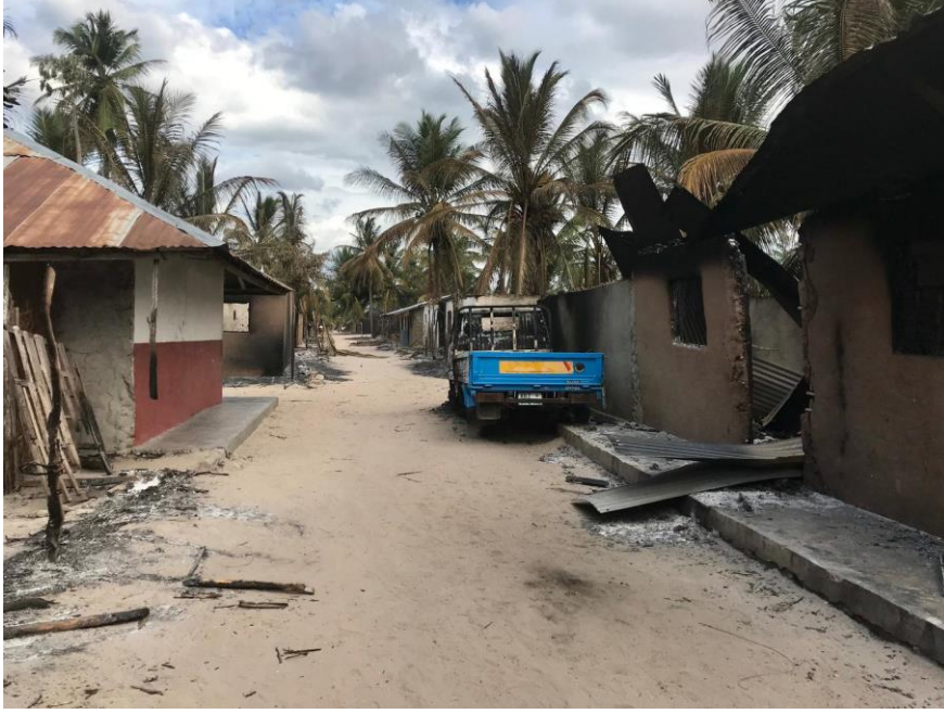
Şekil 1: 5 Haziran 2018'de Mozambik'in Naunde Köyü'nde Evlerden Bazıları Yakılmıştır (Human Rights Watch, 2018).

edilmesine, yaralanmalı olaylar yaşamaya ve ölümlerle sonuçlanan olaylara git gide daha fazla maruz kalmaya başlamıştır (Şekil 1).