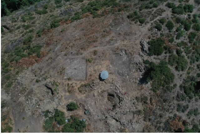
G. 2: Kazı alanının çalışmalar sırasındaki durumu