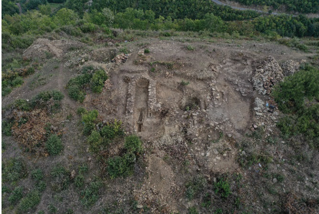
G. 3: Kazı alanının çalışmalar sonrasındaki durumu (Çobankale Kazı Arşivi, 2020)