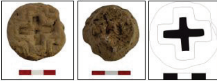
G .5: Pişmiş Toprak ekmek mührü önden, arkadan görünümü ve baskı yüzünün çizimi (ÇBK'20-109)

Tanım: Dairesel formlu olan ve merkezinde Yunan haçı bulunan ekmek mührü pişmiş toprak malzemeye sahiptir. Yunan haçının çevresi bordürlerle çevrelenmiştir. Kenar kısımlarında yer yer kırıklar olan mührün merkez haç noktasında bir delik mevcuttur. Arka kısımda bulunan tutamak kısmı tamamen kırık durumdadır.