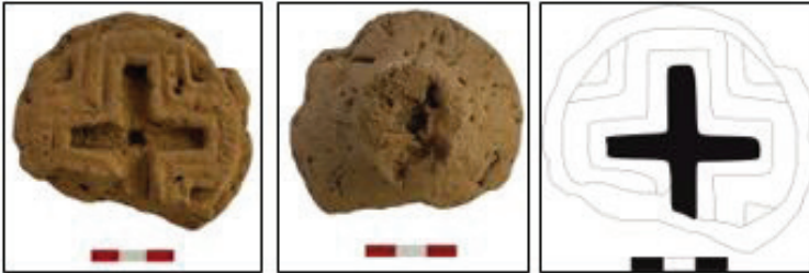
G. 4: Pişmiş Toprak ekmek mührü önden, arkadan görünümü ve baskı yüzünün çizimi (ÇBK'20-108) (Çobankale Kazı Arşivi, 2020)