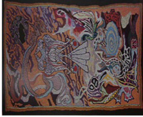
Resim 8. Selçuklu Kartalı, 1984, 241x117 cm (Çoban, 2015: 65)

Sözelimi, Fransız ressam ve duvar halı tasarımcısı Jean Lurçat, tapestry (duvar halısı-kilimi) dokumalarını konu aldığı dersler vermiş, ilerleyen yıllarda dokuma resim uygulamaları için desenler hazırlamış ve bu alanda eserler vermiştir. Bu eserleri arasında Dunhang mağaralarındaki fresklerin kopyalarından etkilenerek tasarladığı 'Dunhang Halısı' ve 1984 yılında yaptığı 241x117 cm ebatlarındaki 'Selçuklu Kartalı' adlı yün işleme halı kompozisyon çalışması bulunmaktadır (Çoban, 2015: 65).