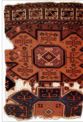
Resim 7. Kuş-Kartal Motifli Halı, ( www.turkelhalilari.gov.tr )

Türk halılarındaki motifler, Batılı sanatçıları da cezbetmiş ve eserlerinde bu motifleri kullanmışlardır. Bazen tabloların bir kısmında arka fonda detay olarak Türk halıları kullanılmış; bazen de sadece halı tabloları üretilmiştir.