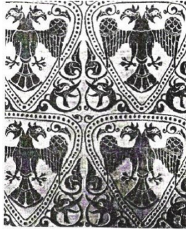
Resim 10. Anadolu Selçuklu Kumaşında Çift Başlı Kartal Figürü, 13.yy. (Göksu, 2016: 139)

Salman 'dan (1998) edinilen bilgiye göre Selçuklulara ait olduğu belirtilen bir diğer kumaş parçası da İngiltere'de yayınlanan Halı Dergisi'nde keşfedilmiştir. Yalnızca fotoğrafı basılarak, altında 12-13. yy.'a ait olduğunu ve 0.84x 1.27 m ebatlarında, ipek ve klaptanla dokunduğunu ifade eden