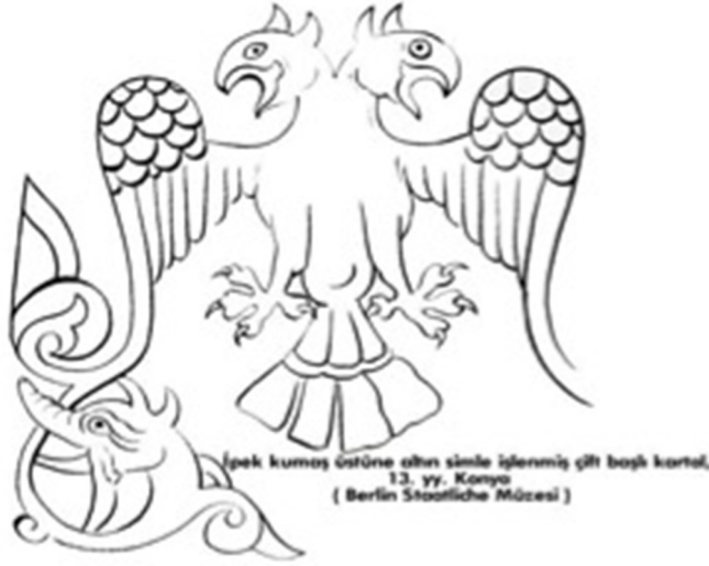
Resim 9. Kumaşa İşlenmiş Çift Başlık Kartal Figürü 4

Kumaşın çözüğü krem renkli ipek, atkısı kırmızı ipektir. Desenleri altın klaptanla 5 dokunmuştur (Salman, 1998: 144). Kartal figürü neredeyse tüm eski kültürlerde görüldüğü gibi özellikle Selçuklu dönemi kumaşlarında daha sık karşımıza çıkmaktadır.