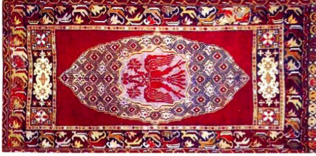
Resim 4. Çift Başlı Kartallı Halı, (Balcı, 2012: 41)

Bu halıya benzer bir başka halı ise halı tüccarı Hakan Tazecan'ın koleksiyonunda yer almaktadır (Görgünay Kırzioğlu, 2001: 294) (Resim 5). Halının zemini sarı renkte olup, çift başlı kartal figürü beyaz bir madalyon içinde mavi zeminin üzerinde yer almaktadır. Etrafında diğer halı örneklerinde olduğu gibi yıldız ve dörtgen gibi geometrik formlar bulunmaktadır.