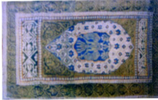
Resim 5. Çift Başlı Kartallı Halı, (Balcı, 2012: 42)

Bu halıya benzer bir başka halı ise halı tüccarı Hakan Tazecan'ın koleksiyonunda yer almaktadır (Görgünay Kırzioğlu, 2001: 294) (Resim 5). Halının zemini sarı renkte olup, çift başlı kartal figürü beyaz bir madalyon içinde mavi zeminin üzerinde yer almaktadır. Etrafında diğer halı örneklerinde olduğu gibi yıldız ve dörtgen gibi geometrik formlar bulunmaktadır.