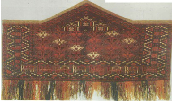
Resim 3: Ersarı Türkmenlerinde 24 Oğuz Boyunu Temsil Eden 24 Çift Başlı Kartal, (Neriman Görgünay Kırcıoğlu arşivinden)

Günümüzde kullanılan dokumalarda çift başlı kartal figürleri, Türkmenistan'ın Ersarı ve Yomut Boyları'nda halılarda işlenmekte olup, eski milli geleneğin Hazar Denizi doğusunda yaşatıldığının delilidir (Görgünay Kırcıoğlu, 1995: 161). (Resim 3). Halı günümüzde St. Petersburg Etnografya müzesinde sergilenmektedir 3 . Art arda sıralanan çift başlı kartal motifi bütün zemini kaplamaktadır.