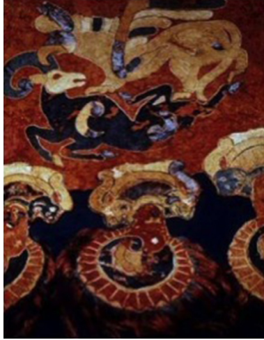
Resim 2. Hun Keçe Süsü, M.Ö. 6-3 yy. (İlden, 2012: 45)

Ögel'e (1998) göre Altaylarda Teleüt 2 Türkleri efsanelerinde merküt soyundan gelen bir boy vardı. Bunlara göre merküt efsanevi ve kutsal bir 'Gök kuşu' idi. Bu kuş o kadar büyüktü ki sol kanadı ayı, sağ kanadı güneşi kaplıyordu. Kuşların hükümdarı sayılan kartal dünya ağacının tepesinde tünemiş olarak tasavvur ediliyordu. Türkler, kendilerine arkadaşlık eden, evinin yiyeceğini veren ve heyecanlı av sahneleri yaşatan av kartallarına büyük bir önem vermişler ve bu sahneleri, çok eski sanat eserleri üzerinde de canlandırmışlardı. Bu, Hun büyüklerinin gömüldükleri Pazırık kurganlarında ele geçmiş olan bir keçe süsünde de görülebilir. Türkün kartalı artık burada tanrılaştırmış ve kutsal bir şekle bürünmüştür. Kartal, diğer bir Hun keçesi süsünde ise, kaplana benzer korkunç bir mahlûk haline gelmiştir (Resim 2).