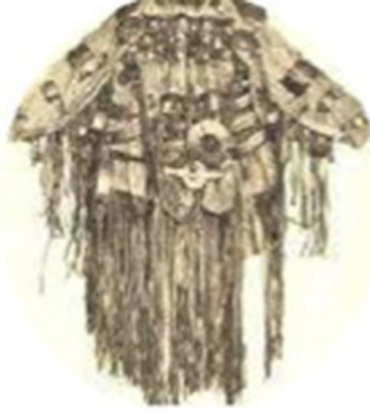
Resim 1. Yakut Şaman Elbisesi, (İlden, 2012: 46)

Kartal motifi günümüzde Anadolu'nun pek çok yerinde anlatılan masallarda yer alır. Bazı yörelerde ise kartal, 'karakuş' olarak adlandırılır. Örneğin, Muğla yöresindeki bir masalda yer altı dünyasında çam ağacının başına yuva yapmış ve yavrulamış şekilde geçer. Yapılan bir iyiliğe iyilikle karşılık verdiğinden, iyiliğin simgesi durumundadır (Balıcı, 2012: 42). Gücü, kuvveti, kudreti, hâkimiyeti, otoriteyi, asaleti, koruyucu ruhu temsil eden kartal, kültürel bir değer veya bir simge olarak yorumlanabilir.