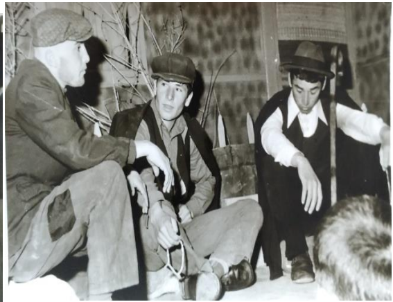
Foto 8. Çanakkale Geçilmez adlı piyesten bir sahne