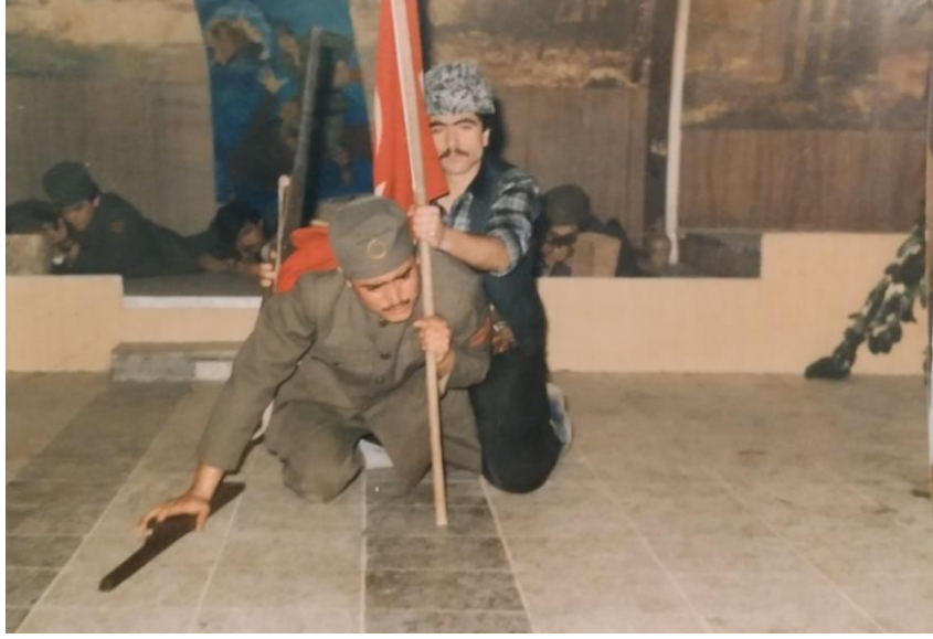
Foto 10. Gelenler Var piyesinden bir sahne, Ankara-1985