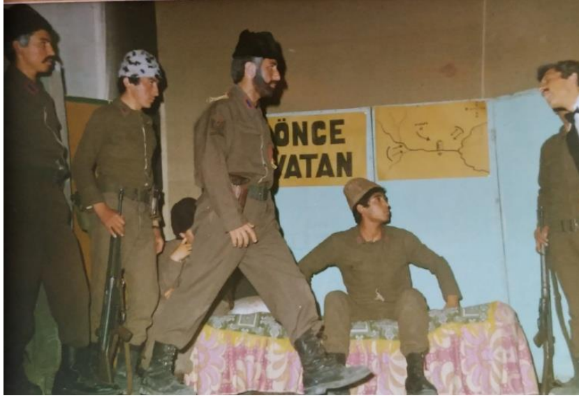
Foto 9. Vatan Yahut Silistre Tiyatro sahnesinden bir kare. Osmancık (1981)

Bütün bunlardan daha ziyadesi Zeki GÜREL, 1983’de Osmancık Lisesi Edebiyat Öğretmeni iken kendi yazdığı Çanakkale Geçilmez adlı bir piyesi öğrencileriyle birlikte sahneye koymuştur. Bu piyes daha sonra Osmancık’taki diğer okullarda o okulların öğretmen ve öğrencileri tarafından da sahnelenmiştir.