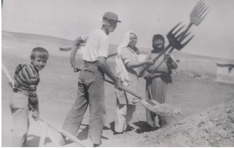
Foto 1. Büyük Potuklu köyü (Anneanesi, annesi, kendisi ve kardeşi) 1970.

Çorum'un Osmancık ilçesinde edebiyat öğretmeni iken 1983'te Hacettepe Üniversitesine öğretim elemanı olarak atandı. 1995-1998 yıllarında Gazi Üniversitesi Kastamonu Eğitim Fakültesinde Dekan Yardımcılığı, Dekan Vekilliği ve Bölüm Başkanlığı görevlerinde bulundu. 1999-2000 yıllarında Kazakistan Ahmet Yesevi Uluslararası Türk-Kazak Üniversitesinde görev yaptı. 2000 yılı kasım ayı sonlarında Abant İzzet Baysal Üniversitesi Türkçe Öğretmenliği Bölümüne öğretim üyesi olarak atandı. 2002-2005 yılları arasında, Kuzey Makedonya'nın Üsküp şehrinde Kiril Metodiy Üniversitesi Türkoloji Bölümünde ve aynı zamanda Kosova'da Priştine Üniversitesi Türkoloji Bölümünde öğretim üyesi olarak vazife yaptı. Abant İzzet Baysal Üniversitesindeki görevine döndükten kısa bir süre sonra 2006 yılında, T.C. Bakanlıklar Arası Ortak Kültür Komisyonu tarafından misafir öğretim üyesi olarak Suriye'ye Halep Türkoloji Bölümüne görevlendirildi.