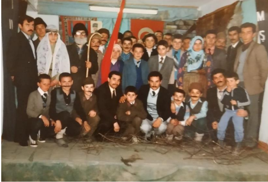
Foto 11. Gelenler Var piyesini sahneye koyan Osmancık Kamil Ortaokulu öğretmen ve öğrencileri ile birlikte, 1986.