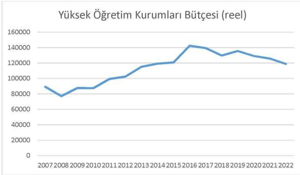
Şekil 2: Senelere Göre Üniversitelere Ayrılan Reel Bütçe Giderleri

Not: IMF (2023) deflatorü kullanılmıştır.