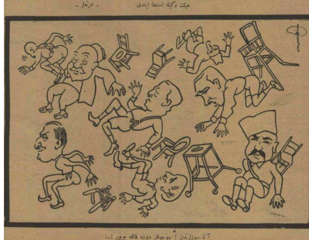
Kaynak: Akbaba, 1 Kasım 1923, s.4.

Akbaba, 1 Kasım tarihli sayısında yukarıdaki şekliyle Heyet-i Vekile'nin istifası meselesini karikatürize etmiştir. Cumhuriyetin hemen öncesinde Mustafa Kemal Paşa'nın talimatıyla çıkarılan kabine bunalımına yol açan hükümetin istifasını ortaya koyan karikatürde sandalyelerinden, taburelerinden ve koltuklarından düşen bakanlar bulunmaktadır. Karikatürde verilmeye çalışılan mesaj, bakanların kendi istekleriyle makamlarından ayrılmadıklarıdır. Adeta koltuklarından cebren uzaklaştırıldıkları resmedilmiştir. Dikkat çeken bir başka durum ise bakanların oturdukları makamların cinsidir. Sandalyenin, koltuğun, taburenin yanı sıra bakanların yaşlarından ötürü kullandıkları lazımlıklı sandalye ve tekerlekli lazımlıklar dikkat çekmektedir. Karikatürün üstünde: "Heyet-i Vekile İstifa Etti" altında ise "Atasözlerinden: Çocuklar düşse kalka büyür!..." ibareleri yer almaktadır. Özellikle son ifade ile bakanların yeterince tecrübe kazanamadıklarını, siyasetin inceliklerini bu gibi gelişmelerle öğrenecekleri mesajı aktarılmıştır (Akbaba, 1 Kasım 1923, s.4)