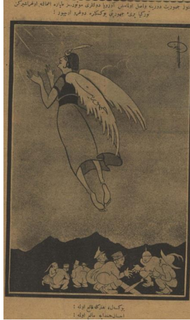
Kaynak: Akbaba, 5 Kasım 1923, s.1.

1 Kasım tarihli Akbaba 'da cumhuriyetin ilanına dair yukarıda verilen karikatür yayınlanmıştır. Ramiz imzalı karikatür “Cumhuriyet Düğünü” başlığını taşımıştır. Karikatürde cumhurbaşkanı seçilen Mustafa Kemal Paşa'nın cumhuriyeti temsil eden bir kadınla evlenmesi resmedilmiştir. Karikatürle, Mustafa Kemal Paşa'nın, milli iradenin tezahürü olarak gösterilen yönetim biçimi cumhuriyete ne kadar önem verdiği vurgulanmak istenmiştir. İsmet Paşa ise cumhuriyet gelininin, gelinliğinin kuyruk kısmının yerlere sürülmesini engellemeye çalışan bir aşk meleği olarak çizilmiştir. Bununla İsmet Paşa'nın da cumhuriyetin ilanı sürecine katkısı gösterilmiştir. Karikatürde Mustafa Kemal Paşa ve cumhuriyet gelinine hitap eden yaşlı kadın ise Celal Nuri Bey'dir. Karikatürün altında geçen ibarede Celal Nuri Nine olarak şu temennisiyle konuşturulmuştur: “Paşacığım, ikiniz bir yastıkta kocayınız inşallah!..” ( Akbaba , 1 Kasım 1923, s.1)