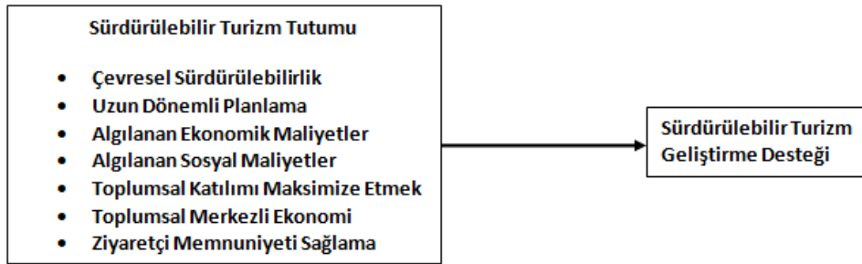
Şekil 1. Araştırma Modeli

Literatür doğrultusunda geliştirilen araştırma modeli Şekil 1’de sunulmuştur.