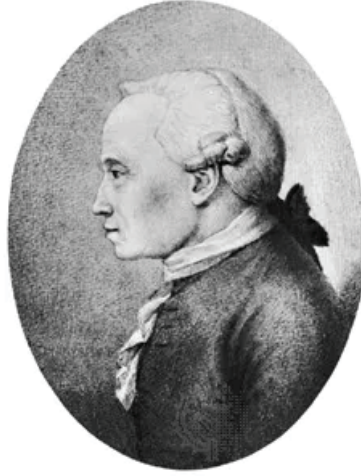
Resim 5: Kant'ı tasvir eden bir çizim.

https://www.britannica.com/biography/Immanuel-Kant [Erişim Tarihi: 25.10.2022]