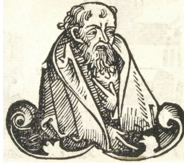
Resim 3: Empedokles'e dair yapılan bir çizim.

Rû'ya kitabında ise Empedokles, bir nevi kolsuz palto veya pelerin anlamına gelen harmani giymiş olarak tarif edilir. 51 Empedokles'in bu giyim şeklini, hak-kında yapılan bir çizimde de görmek mümkündür: