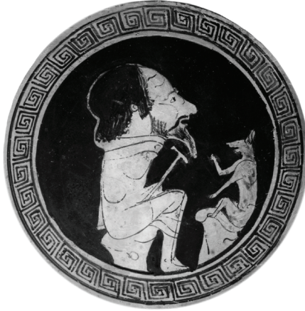
Resim 1: Aisopos'a dair yapılan bir çizim.

https://www.britannica.com/biography/Aesop [Erişim Tarihi: 25.10.2022]