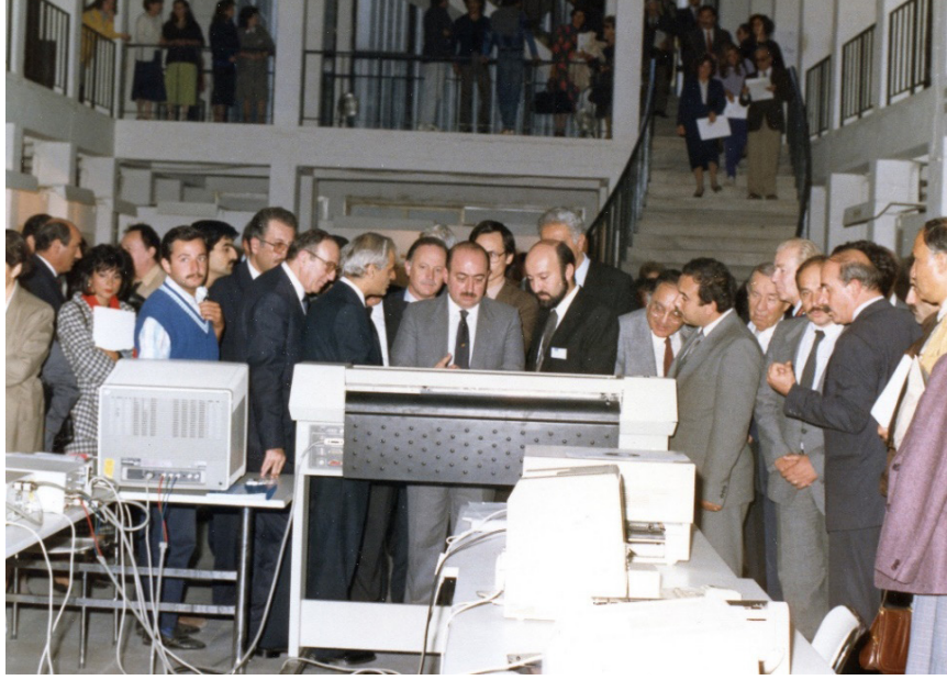
Fotoğraf 4: 1987 yılında Mimar Sinan Güzel Sanatlar Üniversitesi, Endüstri Tasarımı Bölümü ile Sümerbank arasında iş birliği projesinin Devlet Bakanı olan Tınaz Titiz ve yetkililere sunumu. (Ö. Küçükerman Arşivi, 1990).

3-Halıların orijinal doğal renkleri tanımlandı, belirlendi, sınıflandırıldı ve ürün kodlarına dönüştürüldü.