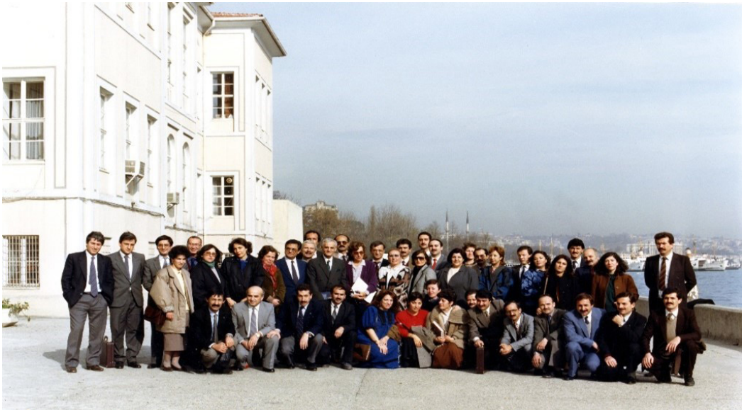
Fotoğraf 5: Sümerbank ve Mimar Sinan Güzel Sanatlar Üniversitesi Endüstri Tasarımı Bölümü arasındaki iş birliği projesi nedeniyle Sümerbank bünyesinde çalışan bütün tasarımcı kadrosu yeni halıcılık projesi için bir üniversitede arada