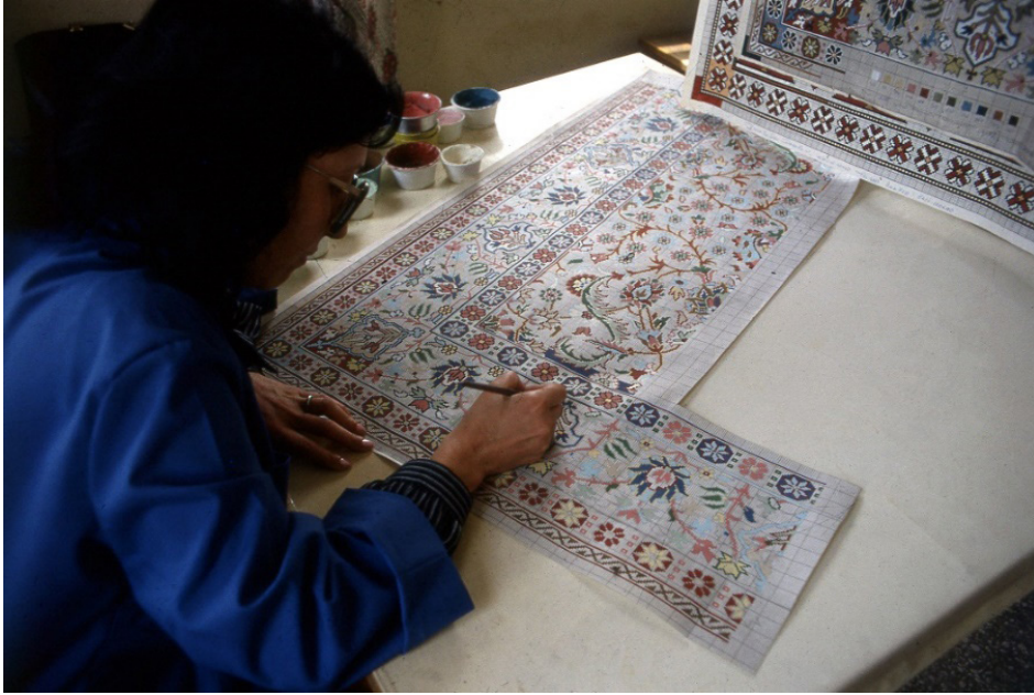
Fotoğraf 8: Isparta Halı Fabrikası'nda Sümerbank için yeniden tasarlanan halı tasarımları, renkleri ve çizimleri (Ö. Küçükerman Arşivi, 1990)

Yeniden tasarlanan yöresel halıların çizimleri Isparta Halı Fabrikası tarafından bilgisayarlar yardımıyla çoğaltıldı, basıldı ve halıcılara verilmeye başlandı. Bu kodlanmış çizimlerle birlikte kodlanmış uygun renkteki yün iplikleri de hazırlandı. Böylece en nitelikli yöresel halıların dokunması amaçlanmıştı.