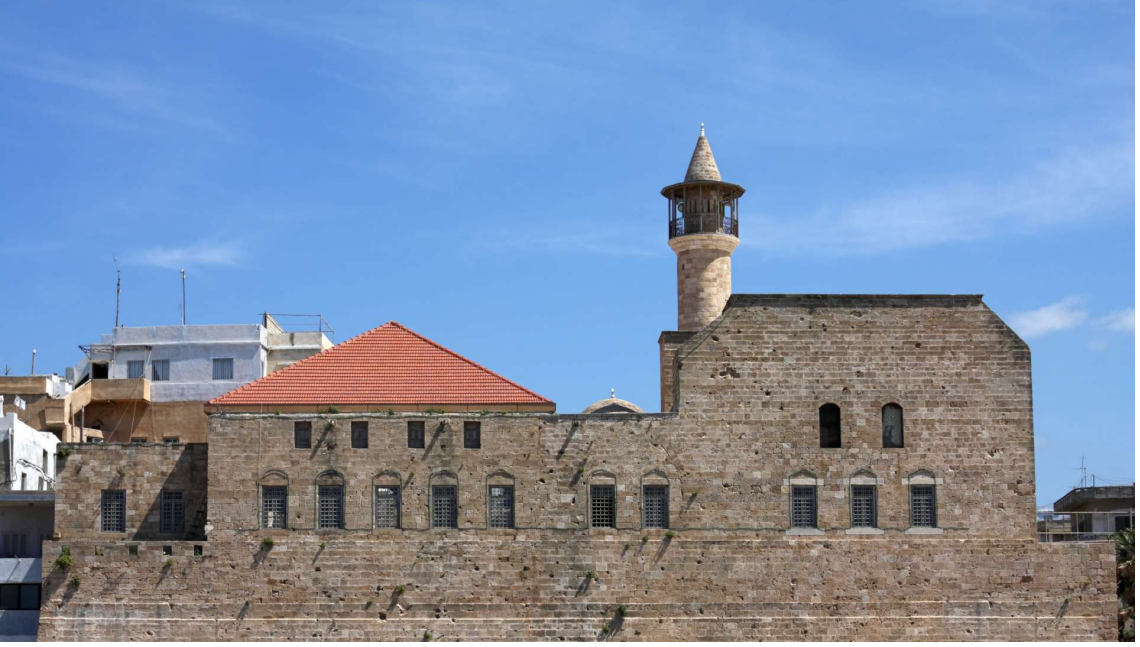
Ek 1. Sayda Hz. Ömer Camii (Dış Görünümü)