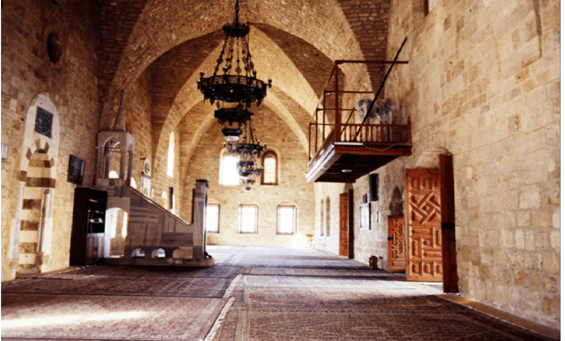
Ek 2. Sayda Hz. Ömer Camii (İç Görünümü)