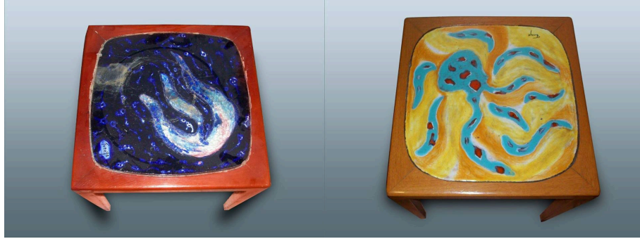
Görsel 5. Mecliste Kullanılan Sehpa Örnekleri.

bir sanatçının halka ve geleneğe bu kadar bağlı olması onun sanatını ne denli içine sindirdiğinin bir kanıtı şeklindedir.