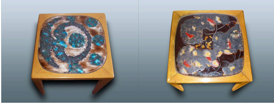
Görsel 3. Koral İmzalı Soyut Seramik Sehpalar.

Birçoğu Füreya imzalı olan sehpalar meclis odalarında ve bahçelerde kullanılmak üzere yapılmış ve yapım süreci ortalama sekiz yıl sürmüştür. Sehpalar; birkaç farklı formda tasarlanarak ölçüleri neredeyse eşit ve seri halde üretilmiştir. Ayrıca bünyenin pekişmesi gereken sıcaklıkta pişirilmediği için günümüze kadar gelen süreçte sehpalarda pek çok kırılmalar ve çatlamlar oluşmuştur.