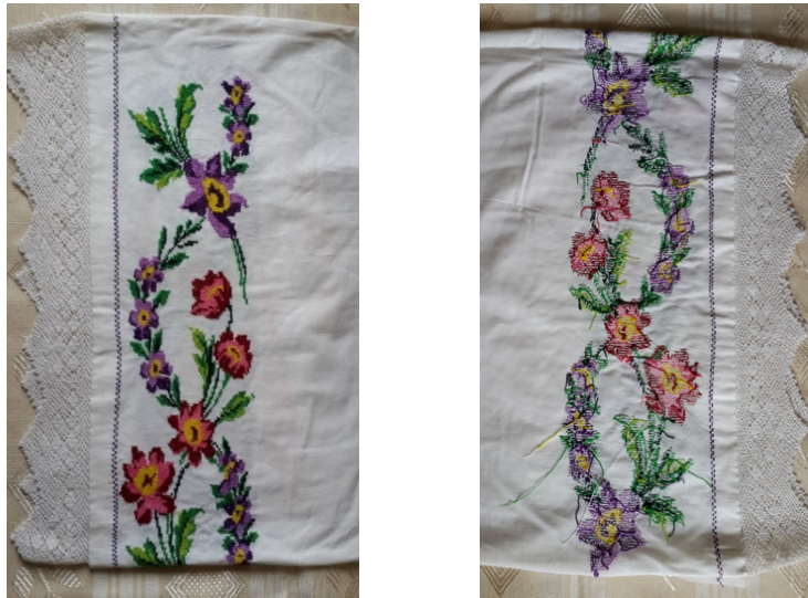
Görsel 1. "Nakış - Kanaviçe", 2016, Fotoğraf, 12,5 x 18 cm.

Nakış, sanat ve tasarım ürünlerinde olduğu gibi günlük hayat içindeki sıradan unsurların yaratıcı imgelere dönüştürülmesi temeline dayanmaktadır. Hayatın nakışla ilişkisini belki de en iyi 'hayat nakış gibidir' diyerek Schopenhauer ifade etmiştir. Düşünürü göre insanlar hayatlarının ilk yarısında nakışın ön yüzüne dikkat ederler, arka yüzünü ancak ikinci yarısında düşünmeye başlarlar (Görsel 1). Oysa nakışların arka yüzü motiflerin oluşma sürecini yani ipliklerin birbirine nasıl bağlandığını anlamamız açısından ön yüzünden daha öğreticidir (Schopenhauer, 2014:211).