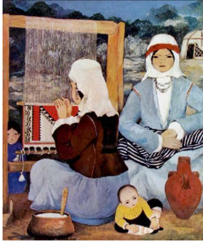
Görsel 4. Turgut Zaim, "Halı Dokuyanlar", Tarih Yok, Guvaş.

konusudur. Bu açıdan değerlendirildiğinde nakış, Zaim'in resimlerinin hem biçimini hem de içeriğini belirleyen bir sanat dili olarak izleyenin karşısına çıkmaktadır. Nurullah Berk'in parlak renk kullanımı ise (Görsel 5) bir yandan Batı resim anlayışının dışavurumcu etkilerini öte yandan minyatürlerdeki yüzeye dikkat çeken Doğu resim geleneklerini hatırlatmaktadır. Sanatçının kübist biçim anlayışını (Yasa Yaman, 2004:61) ön plana çıkardığı buna karşın konularını yerel, ulusal unsurlardan nakışlardan seçerek bir senteze varmaya çalıştığı görülmektedir. Bu örnekler Türk sanatında Batı uygarlığının kazandırdığı değerler ile bulunan coğrafyadaki kültürel mirasın ilişkilendirildiği yapıtların üretilebilmesinin özgün kimliğin ortaya çıkarılmasındaki etkisini göstermektedir.