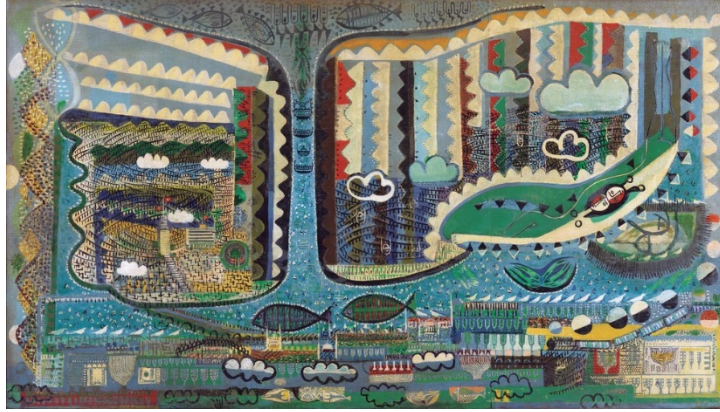
Görsel 3. Bedri Rahmi Eyüboğlu, "İstanbul", 1955, Tuval Üzerine Yağlıboya, 191x335 cm, Eyüboğlu Aile Koleksiyonu.

Sanatçı nakışın Anadolu halkının gündelik hayatındaki yeri konusunda şunları ifade etmektedir: Halk sanatında resmin yerini nakış tutar, hayatında bir tek tablo görmemiş milyonlarca insan olabilir fakat nakış girmemiş bir tek ev, nakış görmemiş bir çift göz bulmak zordur.