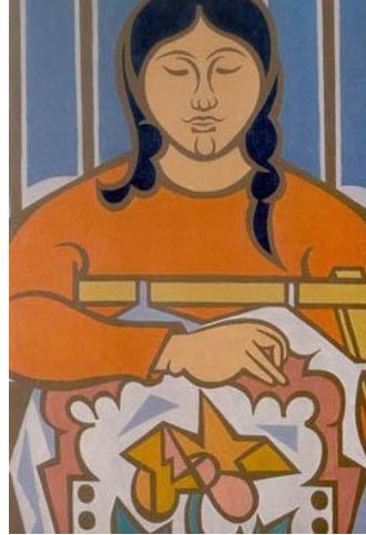
Görsel 5. Nurullah Berk, "Gergef İşleyen Kadın", Tarih Yok, Tuval Üzerine Yağlıboya.

Cumhuriyet sonrası resim sanatında sanatçılar kültürel bir olgu olarak nakıştan yerel, yöresel ya da ulusal bir sanat oluşturabilmek için yararlanmışlar ayrıca plastik etkisi nedeniyle nakışı estetik kaygılarla ele alarak bir kimlik yaratmaya çalışmışlardır. 1940'lı yıllara gelindiğinde ise yerellik, ulusallık ya da evrensellik kavramlarından ziyade günlük yaşam içinde halkın yaşadığı zorlukları yansıtmayı amaç edinen Yeniler Grubu üyeleri toplumcu gerçekçi yaklaşımlarıyla dikkat çekmişler ayrıca sanatçıların fildişi kulelerinden çıkmalarının halka yakınlaşmalarının gerekliliği