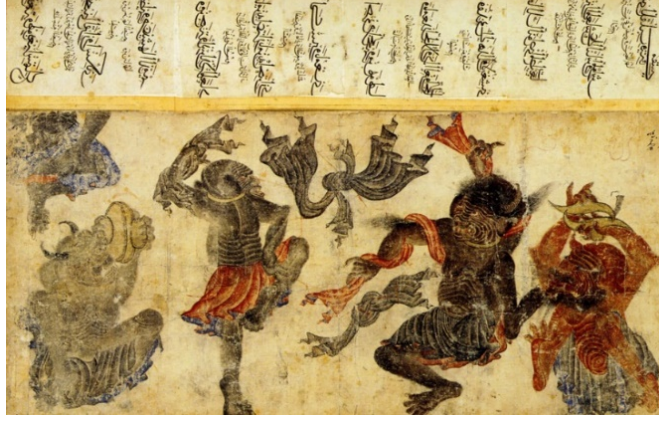
Görsel 2. Mehmet Siyah Kalem, “Demonlar”, Yaklaşık 15. Yüzyıl, Resim Rulosundan Saray Albümüne Çevrilmiş Resimler, 50 x 34 cm, Topkapı Sarayı Müzesi Fatih Albümü, İstanbul.

minyatürleri dikkat çeken önemli eserlerden bazılarıdır (Sözen, 1998:116-139).