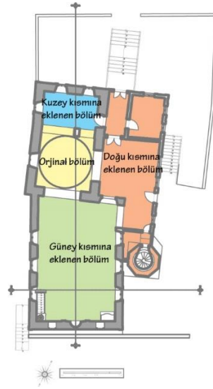
Görsel 3. Hatuncuk Hatun Cami'nin plan düzleminde sonradan eklenen bölümler

Hatuncuk Hatun Cami, günümüzde var olmayan ancak geçmişte merkez konumunda olan ve tarihi bölge niteliği taşıyabilecek mahalle içerisinde yer aldığı söylenebilir. Bu açıdan bakıldığında yapının tarihi değerinin önemi ve niteliği ön plana çıkmaktadır. 1926 yılına ait eski Trabzon haritasında bu durum açıkça görülmektedir. Haritada caminin konumu ve boyutları hakkında veriler elde edilmektedir. Yapının özgün biçimini ortaya koymak açısından da eski haritanın varlığı önemlidir. Çünkü haritanın yapım tarihinin yapının dönüşüm tarihinden yaklaşık bir yıl sonra yapılması, yapının özgün halinden fazla uzaklaşmadan haritanın içerisinde var olduğunu varsaymaktadır. Bu bağlamda yapının orijinal dokusu yani ilk evresi bu süreye kadar ki zaman dilimidir.