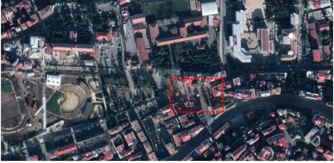
Görsel 1. Hatuncuk Hatun Cami'nin Kavak Meydanı içerisindeki konumu

Yapının yapım tarihine ilişkin bilgi veren herhangi bir vakfiye kaydı veya kitabesi bulunmamaktadır. Literatürde yapının yapım tarihi H.930/M.1523 tarihi olarak işaret edilse de yapının yapım tarihi net olmayıp genel bir ifadeyle 16.yüzyıla tarihlenebilir (Karpuz, 1990; Horuloğlu, 1978). 1925 tarihinde yürürlüğe giren tekke ve zaviyelerin kapatılması hakkındaki kanun gereğince aynı yıl içerisinde camiye dönüştürülerek yapı büyük değişim yaşamıştır (Yüksel, 2000). Bu zamana kadar tekke işlevini sürdüren yapı, yaşadığı değişim ve onarımlarla 19. yüzyıl eseri olarak nitelendirilmektedir (Özen vd., 2010). Osman Baba Tekkesi olarak da bilinen caminin bulunduğu mahalle Trabzon'nun batı tarafında yer alan ve eski zamanlarından itibaren varlığını sürdüren Kavak Meydanı'dır. Bu mahalle kayıtlarda Kavakmeydanı ve Kabakmeydanı olarak yer almaktadır (Üstün Demirkaya, 2014). Bijişkyan bu meydanın eski zamanlarda hipodrom olarak kullanıldığını; kendi zamanında (1817-1819) ise paşaların bazen at oyunları oynadıklarını belirtmiştir (Açık, 2017). Yüksel (2000) ve Horuloğlu'nun (1983) eserlerinde ortak olarak yapılan değerlendirmede yapının özgün durumunun tek kubbeli ve yaklaşık kare plana sahip olduğu belirtilmiştir. Günümüzde ise yapının orijinal bölümüne farklı ölçülerde eklenen bölümler ile cami işlevinde kullanılmaktadır (Görsel 2). Caminin son mimari durumuna göre birimleri giriş holü, imam odası, son cemaat alanları, harim alanı ve bodrum katında yer alan odadır.