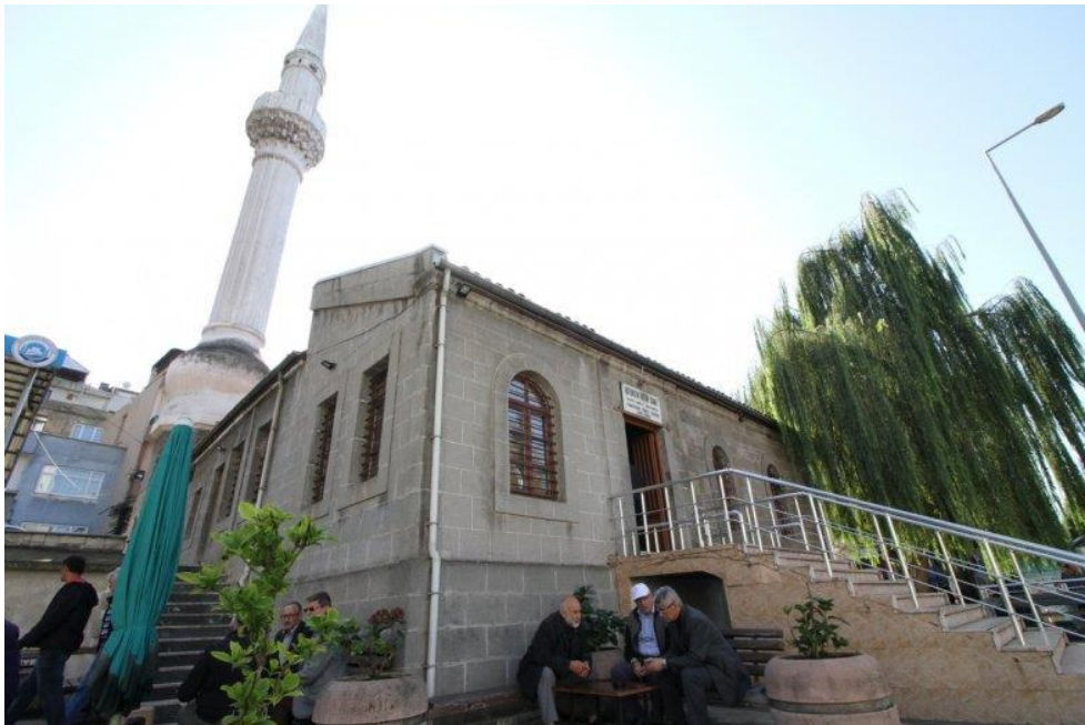
Görsel 2. Hatuncuk Hatun Cami'nin günümüzdeki durumu

Yapının yapım tarihine ilişkin bilgi veren herhangi bir vakfiye kaydı veya kitabesi bulunmamaktadır. Literatürde yapının yapım tarihi H.930/M.1523 tarihi olarak işaret edilse de yapının yapım tarihi net olmayıp genel bir ifadeyle 16.yüzyıla tarihlenebilir (Karpuz, 1990; Horuloğlu, 1978). 1925 tarihinde yürürlüğe giren tekke ve zaviyelerin kapatılması hakkındaki kanun gereğince aynı yıl içerisinde camiye dönüştürülerek yapı büyük değişim yaşamıştır (Yüksel, 2000). Bu zamana kadar tekke işlevini sürdüren yapı, yaşadığı değişim ve onarımlarla 19. yüzyıl eseri olarak nitelendirilmektedir (Özen vd., 2010). Osman Baba Tekkesi olarak da bilinen caminin bulunduğu mahalle Trabzon'nun batı tarafında yer alan ve eski zamanlarından itibaren varlığını sürdüren Kavak Meydanı'dır. Bu mahalle kayıtlarda Kavakmeydanı ve Kabakmeydanı olarak yer almaktadır (Üstün Demirkaya, 2014). Bijişkyan bu meydanın eski zamanlarda hipodrom olarak kullanıldığını; kendi zamanında (1817-1819) ise paşaların bazen at oyunları oynadıklarını belirtmiştir (Açık, 2017). Yüksel (2000) ve Horuloğlu'nun (1983) eserlerinde ortak olarak yapılan değerlendirmede yapının özgün durumunun tek kubbeli ve yaklaşık kare plana sahip olduğu belirtilmiştir. Günümüzde ise yapının orijinal bölümüne farklı ölçülerde eklenen bölümler ile cami işlevinde kullanılmaktadır (Görsel 2). Caminin son mimari durumuna göre birimleri giriş holü, imam odası, son cemaat alanları, harim alanı ve bodrum katında yer alan odadır.