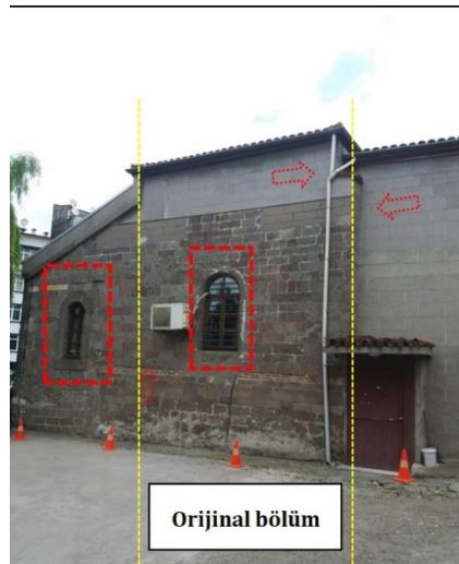
Görsel 4. Hatuncuk Hatun Cami'nin batı cephesi üzerindeki değişim izleri

Yapının özgün dokusunu yansıtan ilk evredeki mimari durumu, tek kubbeli ve kesme taştan yapılmış yığma sistemdir. Bu birimin o dönem içerisinde tevhidhane olarak kullanıldığı Trabzon Vakıflar Bölge Müdürlüğü (2021) arşivinde yer almaktadır. Bu dönem içerisinde tek ünitenin kuzey tarafından önüne beşik tonoz örtülü ve dikdörtgen biçimli bir birim eklenmiştir. Bu eklenen birimin hangi tarihte yapıldığı tam bilinmemekle birlikte orijinal bölümden farklı zamanda yapıldığı yapı üzerindeki izlerden anlaşılmaktadır. Bu bölümün duvar malzemesi dokusunun ve pencere düzeninin farklı olması orijinal bölümden ayrı zamanda yapıldığını kanıtlar niteliktedir (Görsel 4). Ayrıca yapının giriş kapısının 19.yüzyıla ait Tudors kemer olması, orijinal bölümün batı cephesindeki hatılın sonradan eklendiği birimde olmaması ve iç kısımda asimetrik açılan kemerlerin uyumsuzluğu yine kuzey bölümdeki aykırılığı doğrulamaktadır.