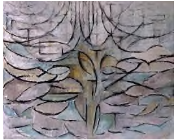
GörSEL 5. Piet Mondrian, Elma Ağacı, 1911