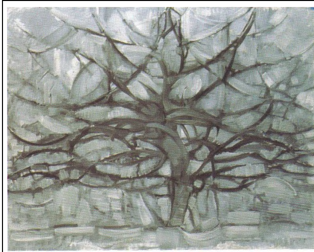
GörSEL 4. Piet Mondrian, Gri Ağaç, 1911

Mondrian'ın kübist ve post kübist dönemdeki çalışmalarının ana konuları natürmortlar, figürler, manzaralar, ormanlar, ağaçlar, çatılar, deniz, okyanus, iskeleler, kilise ve bina cepheleri ve kompozisyonlara dayalı kompozisyonlardı (Threlfall, 1978, s. 206). Kübizm temel anlamda metafizik bir sanattır kübizmin özü metafiziğe dayanır. Kübizm metafiziksel bir amaçla gerçek dünya ve onun gerçek biçimlerinden uzaklaşır. Kübist sanatçılar bunu en iyi sentetik kübizimde göstermiştir. Çünkü sentetik kübizimde gerçek doğa görünür nesnelere arındırılmıştır (Kara, 2000, s. 35). Mondrian, kübizmi soyutlama olarak görüyordu. Fakat kübizm kendisini doğa formlarından arındıramadı. Mondrian, çalışmalarında farklı bir basitleştirme arıyordu. Mondrian, yüksek sesli müziği doğadan kurtulamadığı için eleştirdiği gibi kübizmi de eleştiriyordu (İpşiroğlu, 1994, s. 80).