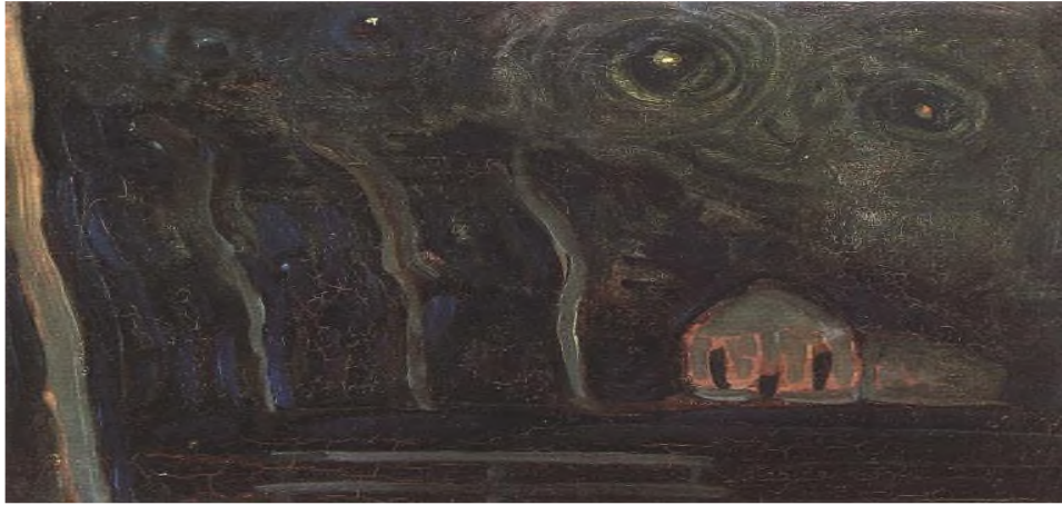
Görsel 2. Piet Mondrian, Gece Manzarası 1917-1918