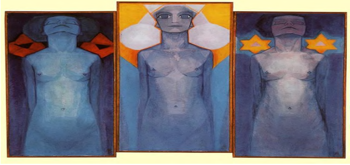
Görsel 3. Piet Mondrian, Evrim 1910-1911