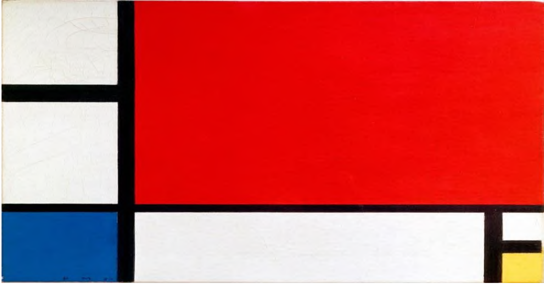
Görsel 8. Piet Mondrian, Kırmızı Mavi ve Sarı 1920

uyum vardır. Bu denge ve uyum sanatçının hem kullandığı renklerde hem de kullandığı formlarda görülmektedir.