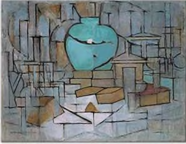
Görsele 6. Piet Mondrian, Natürmort, 1912