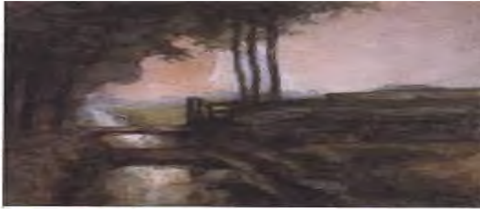
Görsel 1. Piet Mondrian, Kanallı Manzara 1897–1898

Mondrian, ilk zaman çalışmalarında dönemin empresyonist sanatçılarından oldukça etkilenmiştir. 1895 ve 1907 yıllarını kapsayan dönemde sanatçı yaşadığı ülke ve içinde bulunduğu çevreyi konu edinerek çoğunlukla natüralist ve empresyonist ağırlıklı resimler yapmaya başlamıştır. Kınalı Manzara (1897-1898), İş (1897-1899), Hague Çiftçinin Karısı (1899), Günebakanlı Ölüdoğa (1907), Ölmekte Olan Kasımpatı (1908), Kırmızı Değirmen (1910-1911) vb. çalışmalar bu dönemin ürünleridir.