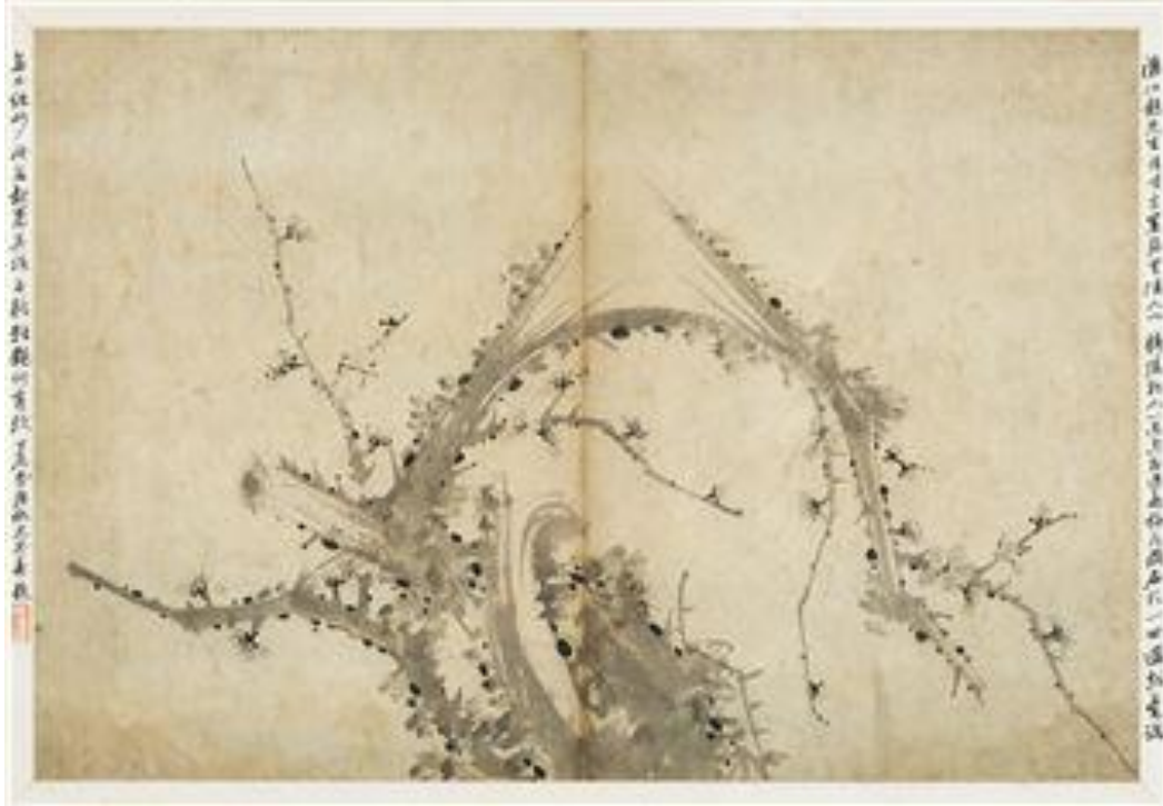
Figür 5: Jo Sok'un Erik Adlı Eseri

Kore resmine, devletin yeni ideolojisini işleyen ilk ressamlardan birisidir (Beksaç, 2002: 46). Gerçekçi manzara resminin öncüsüdür. Krallık boyunca manzaralı yerleri gezmiş ve izlenimlerini şiir ve resim yoluyla ifade etmiştir (Figür 5.). Fikirleri ve sanat tarzı oğlu Jo Ji-Un (1637-1691) tarafından devam ettirilmiş ve Jeong Seon (1676-1759) tarafından mükemmelleştirilmiştir (Koehler ve diğerleri, 2010: 67).