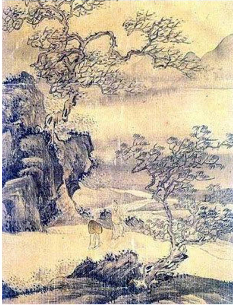
Figür 10: Jang Seung- Eop'un Manzaradaki Bir Adam Adlı Eseri