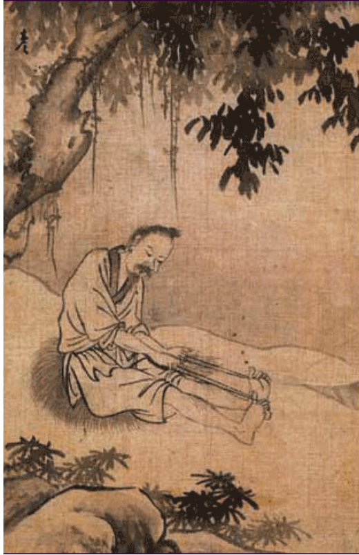
Figür 7: Yun Du-Seo'nun Hasır Ayakkabı Yapan Yaşlı Adam Adlı Eseri