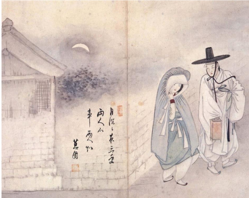
Figür 8: Shin Yun-Bok'un Ayın Altındaki Aşıklar Adlı Eseri

Shin Yun-Bok'da babası ve büyük babası gibi saray ressamıydı ve takma adı Hyewon ile tanınmaktaydı. Ne yazık ki hayatı hakkında çok az belge bulunmaktadır. Fakat sanat açısından dönemin tutkusunu, romantik zevklerini göstermekle kalmıyor ayrıca edebi tarzda manzaralar, hayvan tasvirleri ve kaligrafi ile ilgileniyordu (Korean Painting, t.y.). Resimlerinde belirgin bir şehvet duygusunu izleyicide kaçınılmaz bir şekilde hissettirmektedir ayrıca merak da uyandırmaktadır (Koehler ve diğerleri, 2010: 82). Ne kadar güzel giyimli, cinsel açıdan çekici kadınları ele alsa da aslında trajik hayatlar geçiren kadınların yaşam koşullarını araştırmaktaydı (Mia, 2020: 11). En iyi resim konuları meyhane tasvirleri, danslar, bahar gezileri, yıkanan kadınlar ve aşıklar (Figür 8.) olarak kabul edilmektedir (Koehler ve diğerleri, 2010: 82).