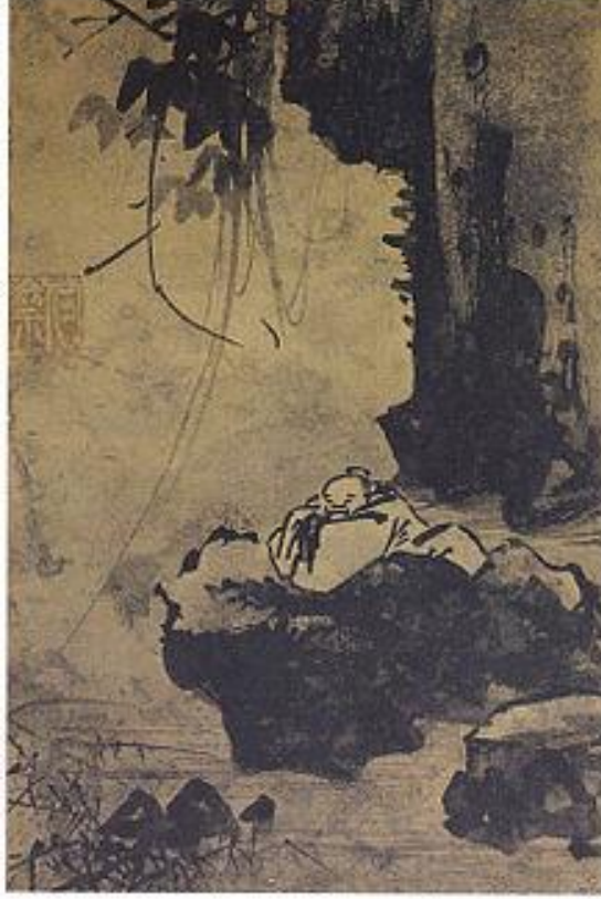
Figür 2: Gang Hui-An'ın Kaya Üzerinde Uyuyan Bilge Adlı Eseri