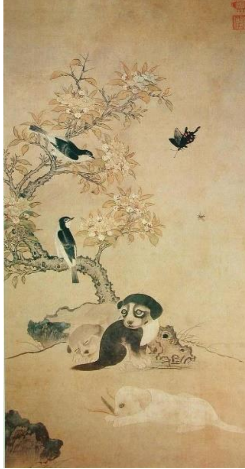
Figür 3: Yi Am'ın Köpekler ve Çiçekler, Kuşlar Adlı Eseri