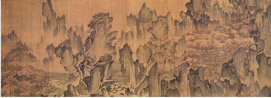
Figür 1: An Gyeon'un Şeftali Çiçekleri Ülkesine Rüya Yolculuğu Adlı Eseri