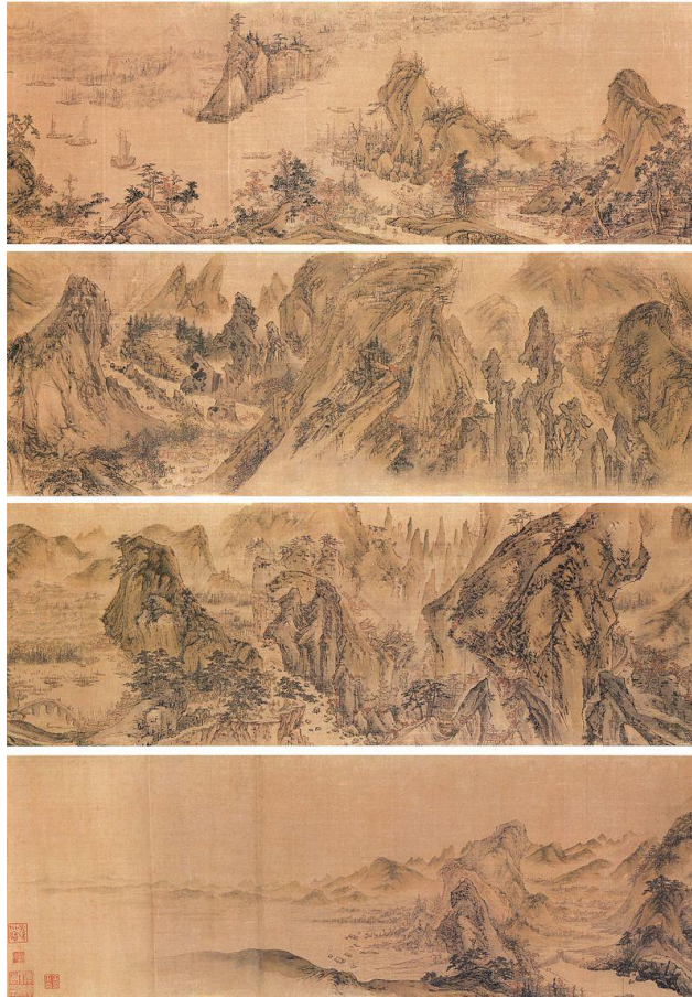
Figür 9: Yi In-Mun'un Sonsuz Akarsular ve Dağlar Adlı Eseri

Bu dönemin en mükemmel manzara ressamı arasında olan Yi, her ne kadar Çin stillerinde ustalaşmışsa da hâkim anlayışa sahip olan manzara resimlerini (Figür 9.) takip etmiştir. Resimleri incelendiğinde fark edilen şeylerden bir tanesi 60 yaşından önce yaptığı eserler de ince fırça darbeleri ile düzgün ve temiz bir işçilik görülürken 60 yaşından sonra yaptığı eserler daha kaba, güçlü ve kendini aşmaya yöneliktir (Koehler ve diğerleri, 2010: 74).