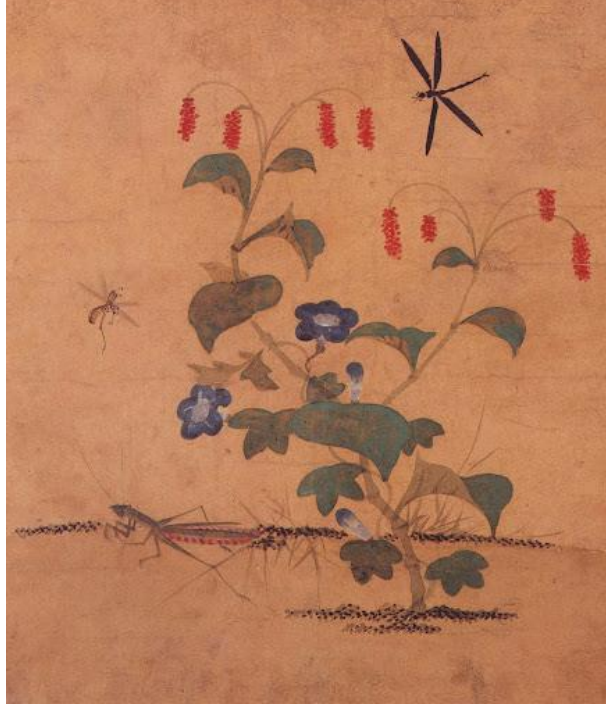
Figür 4: Shin Saimdang'ın Çim ve Böcek Adlı Eseri