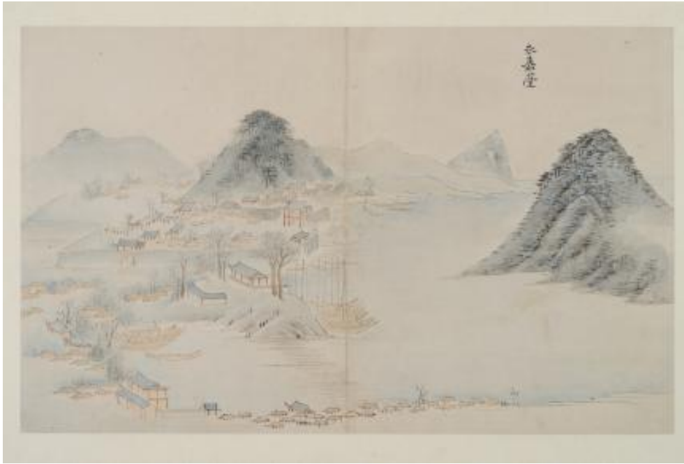
Figür 11: Kim Yun-Gyeom'un Yeongnam Bölgesi Manzaraları Albümünden Bir Eseri

Gerçekçi manzara türüne bağlı çok başarılı bir ressamdır. Çizim tekniklerinin benzerliğinden dolayı Jeong Seon'un öğrencisi olduğu düşünülmektedir. Kim, bir nesnenin belirli bir noktasını öne çıkarmak için diğer ayrıntıları atlama eğiliminde olduğu görülmektedir (Figür 12.) ayrıca dönemin diğer ressamlarından farklı olarak mürekkep ve sulu boya kullanarak özellikle kayaları üç boyutlu şekilde tasvir etmektedir (Koehler ve diğerleri, 2010: 71).