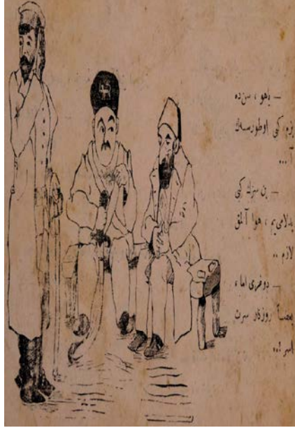
Şekil 3. Cingöz dergisinde yer alan bir karikatür.

sayısının kapağında sonra da İstanbul'da çıkan Cingöz 'ün 26 Ağustos 1324 tarihli ilk sayısının kapağında yer almıştır. Seyyid Hasan tarafından çıkarılan Cingöz dergisinin başyazarı Gıdık , Zümrüt-ü Anka , Ayna (Çapanoğlu, 1961) isimli mizah gazetelerinde de yazan Mehmed Asaf sahibi ise Seyyid Hasan olarak belirtilmiş 26 Ağustos 1324'de yayımlanmaya başlamış ve toplam yedi sayı çıkmış siyasi, edebi, mizah dergisidir.