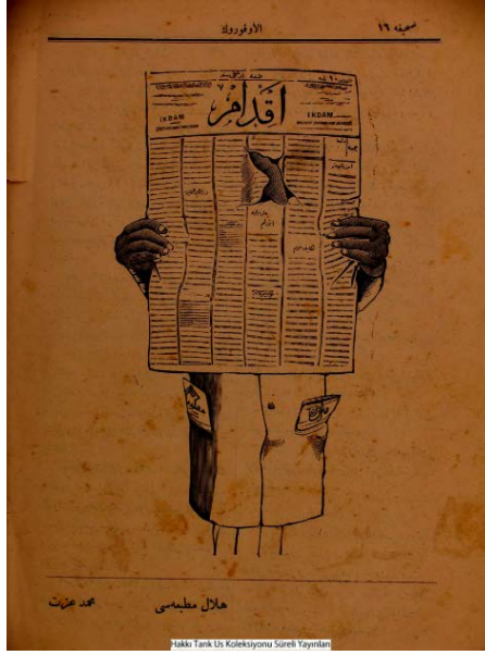
Şekil 2. El Üfürük dergisinden bir karikatür.

Aynı dergide yer alan farklı bir karikatürde (El Üfürük, 1324) II. Abdülhamid'in İkdam gazetesi okurken gazetenin arasından burnunun gözükmesiyle, basına müdahalesi aktarılmıştır. II. Abdülhamid karikatürlerinde portresi olmasa da öne çıkan burun unsuru burada kullanılmıştır. Karikatürde yer alan İkdam gazetesi 5 Temmuz 1894 senesinde Ahmet Cevdet tarafından II. Abdülhamid döneminde çıkarılmış ve zaman zaman sansüre uğrasa da uzun yıllar yayın hayatına devam etmiştir (Topuz, 2003). II. Abdülhamid döneminde yapılan herhangi bir basın kanunu bulunmamasına rağmen komisyon ve sansür kurulu aracılığı ile basın üzerinde denetim sağlanmıştır. Karikatür, 2. sayıda tam sayfa olarak yayımlanmıştır.