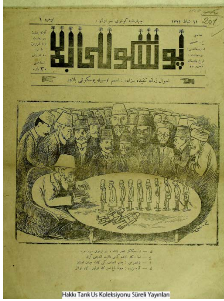
Şekil 13. Püsküllü Bela dergisinden bir karikatür.

zadır ismim o sebeple püsküllü beladır” ibaresi ile yayımlanmıştır. Ağırlıklı olarak siyasi ve askeri yazı ve karikatürlerin yer aldığı dergide basına getirilen sansür sıklıkla eleştirilmiştir. Toplam 7 sayı çıkarılan dergide toplumsal ve askeri meselelere değinilmiştir.