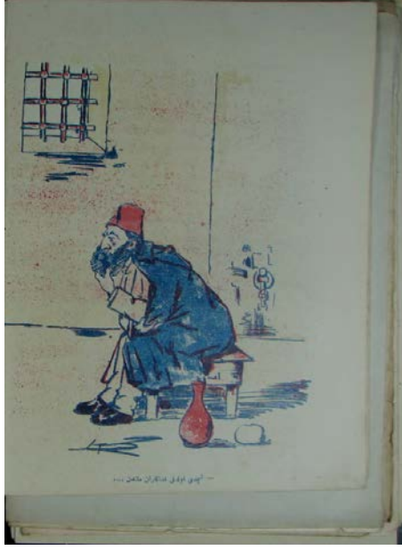
Şekil 11. Davul dergisinden bir karikatür

Dergideki bu karikatürde ise (Davul, 1324) II. Abdülhamid hapsedilmiş yanında bir testi, odada küçük bir pencere ve duvarda bir kilit asılı durmaktadır. II. Abdülhamid odadaki küçük bir banka oturarak eliyle sakalını tutarak düşüncelere dalmıştır. Üzerinde pardesüsü ve başında fesi bulunmaktadır. II. Abdülhamid sürgüne gönderilen veya yurtdışına giden aydın, gazeteci ve siyasetçilerin kurmuş olduğu II. Meşrutiyet sonrasını kaybettikleri haklarını geri almak üzere dönen Fedekaranı Millet cemiyetini (Akşin, 1974) kastederek “şimdi olduk fedekaran milletten” demiştir. Karikatür dergide tam sayfa yayımlanmıştır.