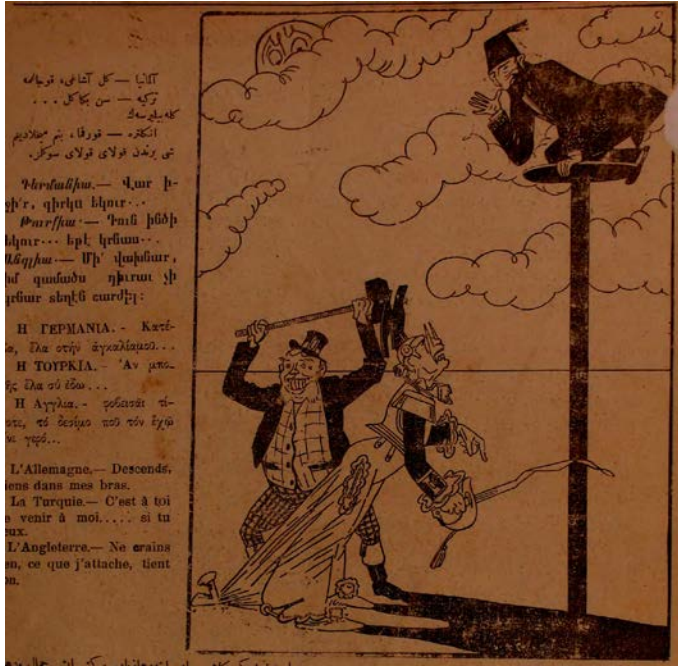
Şekil 7. Hokkabaz isimli dergiden bir karikatür.

ile ifade edilmiştir. Karikatürde yer verilen “İleriye doğru” ifadesi ile II. Abdülhamid’in engellere ve zorluklara rağmen ilerlemeye devam ettiğini ifade edilmiştir. Burada bisiklet II. Abdülhamid’in uyguladığı denge siyasetini, etrafında koşan köpekler de yabancı devletler olarak aktarılmıştır. II. Abdülhamid 1878’den XX. yüzyıla dek bağımsız bir politika ile diplomasi faaliyetlerini yönetmeye gayret etmiş, ortak emelleri olan devletleri karşı karşıya getirerek (Gelen, 2015, s. 50) denge siyaseti uygulamıştır.