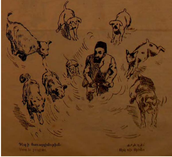
Şekil 6. “İleriye doğru” başlıklı Hokkabaz dergisinden bir karikatür.

Dergide yer alan bu karikatürde (Hokkabaz, 1908) II. Abdülhamid bükülmüş sırtında iki bavul ve kollarında çantalarla resmedilirken arkada ise yolda durmuş birbirleri ile konuşan iki erkek resmedilmiştir. II. Abdülhamid meşrutiyetin ilânı ile görüşülecek dosyaları sırtında taşımaktadır. Bavullardan birinin üstünde “meclisi mebusan” yazmaktadır. Bunu görenler aralarında konuşmaya başlayarak “Bu koca yükü nereye taşıyor?” diye sorar ve diğeri “yakında açılacak Meclis-i Mebusana” diye yanıtlayarak mecliste çözülmesi gereken sorunların çok olduğunu ifade etmiştir. Karikatür derginin ikinci sayısının kapağında tam sayfa olarak yer almıştır.