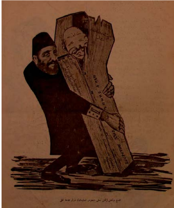
Şekil 4. Hokkabaz isimli dergiden bir karikatür.