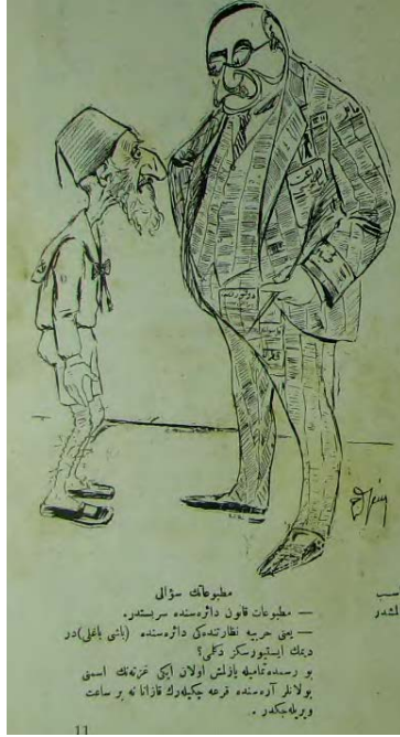
Şekil 12. Kalem dergisinden bir karikatür.

Dergide yer alan karikatürde (Kalem, 1908), II. Abdülhamid şortlu ve boynunda bir kurdela ile öğrenci olarak resmedilmiş ve karşısında yer alan kişi de gazetelerden yapılmış ceket pantolon takım giymiş elinde kalem tutmaktadır. Karikatürde öğrenci olarak resmedilen II. Abdülhamid'e basın yayım faaliyetlerinin kanun namında serbest olduğu ancak II. Meşrutiyet'in ilanından bir gün önce kurulan birçok daire ve komisyonun bağlandığı Harbiye Nezaretinde bu serbestliğin kabul edilmediği vurgulanmıştır. Karikatürdeki diyalogda: "Matbuat kanun dairesinde serbesttir" cümlesine karşılık II. Abdülhamid "yani harbiye nezaretindeki dairesinde başı bağlıdır demek istiyorsunuz değil mi? cevabını vermiştir. Cemil Cem imzalı karikatür aynı zamanda derginin resimli müsabakasının bir parçasıdır ve karikatürde yer alan iki gazete ismini bulanlara saat verileceği belirtilmiştir.