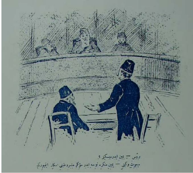
Şekil 8. Davul dergisinden bir karikatür.