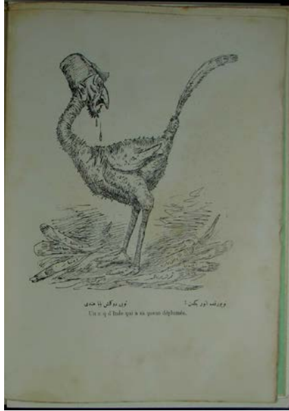
Şekil 9. Davul dergisinden bir karikatür

Dergide yer alan karikatürde (Davul,1324), mecliste 27 Nisan 1909'da gerçekleşen II. Abdülhamid'in hal'i konusuna yer verilmiştir. Karikatürde meclis başkanı olarak II. Abdülhamid döneminin en uzun süre görev yapan mabeyn başkatipliği ve sadrazamlık görevlerinde bulunan yaklaşık 50 sene Osmanlı yönetiminde çalışmış Mehmed Said Paşa resmedilmiştir. II. Meşrutiyet'in ilk sadrazamı olan Mehmed Said Paşa, II. Abdülhamid ile beraber yaklaşık otuz sene çalışmış aynı zamanda II. Abdülhamid'in hal kararını veren (Kurşun, 2008) meclisin başkanlığını da yapmıştır. Meclis eski başkanı Ahmet Rıza Bey, Şeyhülislam Mehmed Ziyaeddin Efendi ve sonrasında Hacı Nuri Efendi'nin de dahil olduğu meclis toplantısı gizli oturum ile gerçekleşmiştir (Bozdağ, 1975). Karikatürde Mehmed Said Paşa'nın "yemin eder misin" sorusuna mebus vekil "yemin menkûre teveccüh eder müvekkilim meşrutiyeti inkâr etmiyor ki!" şeklinde yanıt vermiştir. II. Abdülhamid'in hal'inde öne sürülen gerekçelerin anlaşılmasında bu karikatürle aktarılmıştır. II. Abdülhamid 31 Mart Vakası sebebi ile suçlanmış ancak bu konuda suçsuz olduğu anlaşılınca da İttihad ve Terakki ile artan sorunlar sebebi ile meclis kararı ve alınan fetva ile 27 Nisan 1909'da hal'i gerçekleşmiştir (Uzunçarşılı, 1990).