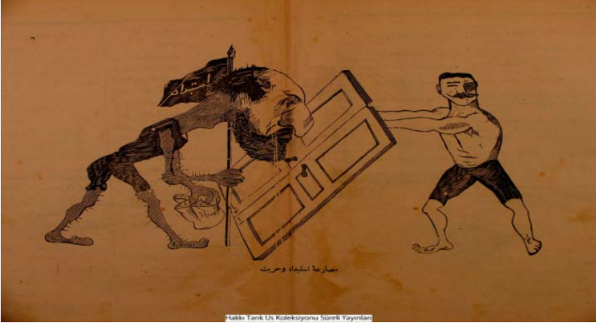
Şekil 1. El Üfürük isimli dergiden bir karikatür.

Dergideki karikatürlerin birinde (El Üfürük, 1324) II. Abdülhamid elinde “istibdat” yazılı bayrak ayağında “idare” yazısı ile “Babıali” olarak belirtilen kapıdan girmeye çalışan kolları ve bacakları dikenli bir canavara benzetilmiştir. Kapının diğer tarafı hürriyet olarak adlandırılmış ve burada da güçlü bir pehlivan kapıyı iterek canavarın girmesini engellemiştir. Karikatür iki sayfa olarak II. Meşrutiyet’in ilanından iki ay sonra yayımlanmıştır. Dolayısı ile II. Abdülhamid’in Meşrutiyet’i ilan etse bile istibdat korkusunun bitmediği yansıtılmıştır. Yine II. Abdülhamid I. Meşrutiyet’i ilan ettikten kısa bir süre sonra sıkıyönetim ilan edilerek meclisin kapatıldığı gibi II. Meşrutiyet ilan edilse de istibdadın hala bir tehdit olduğu bu karikatür ile aktarılmıştır.