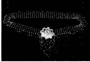
Telkari Gümüş Taki