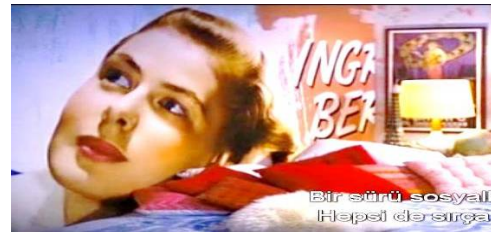
Resim 6. Ingrid Bergman (görsel içmetin)