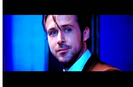
Resim 9. Son bakış

Eski âşıklar 5 yıl sonra karşılaşıncı tek kelime etmezler; çünkü herkes bilir ki “gözler kalbin aynasıdır”. Yönetmen son büyük bir klişeyle filmi bitirir. La La Land de eski filmlerden kalanları daha süslü, daha gösterişli, daha renkli bir biçimde izleyiciye sunmayı başarmıştır. İtalyan atasözünü şiirleştiren Turgut Uyar'ın dediği gibi “her şeyden biraz kalır”. (1) Eski sevgililerin gönüllerinde aşklarından bir iz, izleyicilerin akıllarında filmlerin görkemli sahneleri kalır.