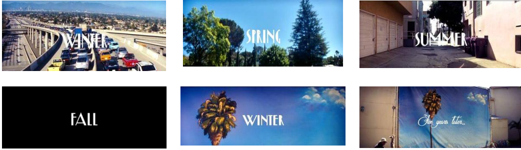
Resim 4. La La Land filminin bölüm başlıkları (içmetin)

Filmde sözel, görsel içmetinler de vardır. “Bu kadar çok Hollywood klişesini bir arada bir daha ne zaman göreceksin ki?” sözleri, doğrudan filmin kendisini anlatan bir yansılama, gülünç dönüştürümdür (Resim 5); çünkü film de baştan sona klişelerle ilerler. Aynı sahnede duvardaki Ingrid Bergman resmi görsel bir içmetindir (Resim 6.). Başka bir sahnede unutulmaz Hollywood filmlerinin adlarının sıralanması da içmetindir (Resim 7.). İzleyen sahnede, “...teyzemle ikimiz filmlerde gördüğümüz sahneleri yeniden canlandırırdık.” sözleri (Resim 8.) de birer gülünç dönüştürümdür; çünkü La La Land de eski filmlerdeki sahneleri yeniden canlandırır.