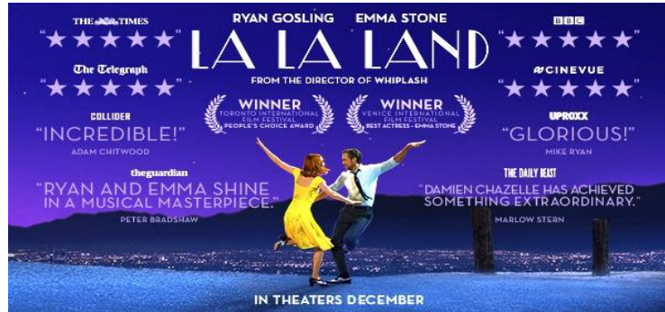
Resim 3. Eklenen bilgilerle filmin afişi (önmetin)

Genette, yanmetinsellik içinde paratext, peritext ve epitext kavramlarını açıklar. Paratext, önmetin gibidir. Giriş bölümünde okuyucunun alımlamasını denetleyerek yönlendiren bilgileri içerir. Metnin ne zaman, kim tarafından, ne amaçla üretildiğine, nasıl okunması ya da okunmaması gerektiğine ilişkin bilgiler verilir. Genette, önmetin kavramını da yazarın ve başkasının (editör, yayımcı vd.) verdiği bilgilere göre değerlendirir. Filmin afişinde yer alan, filmin türüne, oyuncularına, yönetmenine vd. ilişkin bilgilerle film hakkındaki değerlendirmeler önmetindir. Filmin afişi yanmetindir. Eklenen bilgilerle afiş önmetne dönüşmüştür (Resim 3.).