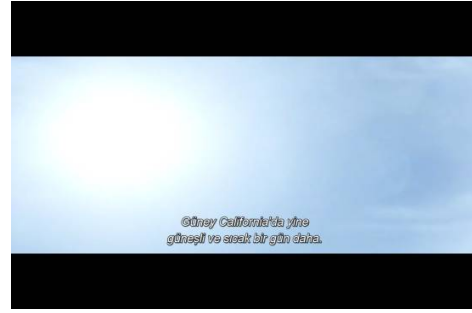
Resim 2. Filmin açılışı

(telmih / allusion) (Resim 1). Film, mavi gökyüzünden yeryüzüne doğru inerek başlar (Resim 2). Mavi renk, film içerisinde sıkça kullanılmıştır.