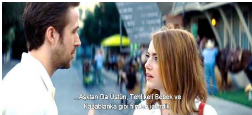
Resim 7. Hollywood filmlerinin adları (içmetin)