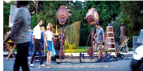
Resim 8. Gülünç dönüştürüm