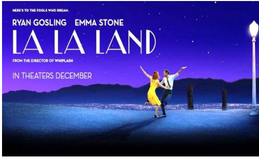
Resim 1. Filmin afişi (yanmetin)