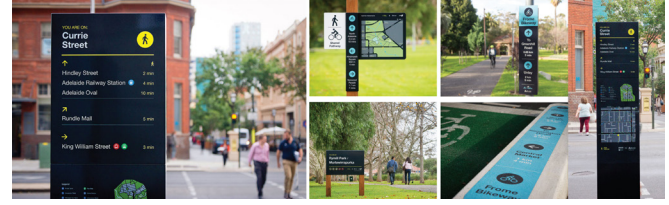
Fotoğraf 13. Adelaide yönlendirme tasarımları (Studio Binocular, 2016).

sistemi oluşturulmuştur. Yönlendirmelerde şehrin artan nüfusunu da göz önüne alınarak yürüyüş, bisiklet ve toplu taşımacılık gibi sürdürülebilir bir strateji izlenmiştir, bu sayede trafik yoğunluğunu önlemeye yönelik bir adım atılmıştır. Kapsamlı bir haritalandırma sistemi yapılarak tasarımlar zenginleştirilmiştir (Fotoğraf 13). Ayrıca dünyada 5. en yaşanabilir şehri seçilmiştir (Studio Binocular, 2016).