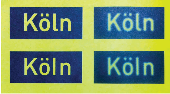
Fotoğraf 9. Almanyada yol işaretlerinde kullanılmak üzere tasarlanan Din-Schrift yazı karakteri. (Ambrose& Harris, 2010, 62).

almaktadır. Bu düzeltmeler (geliştirmeler) ile kötü hava koşullarında, DIN-Schrift yazı karakterlerinin nasıl görüldüğü ve algılandığı fotoğrafın yan tarafında gösterilmektedir (Fotoğraf 9).