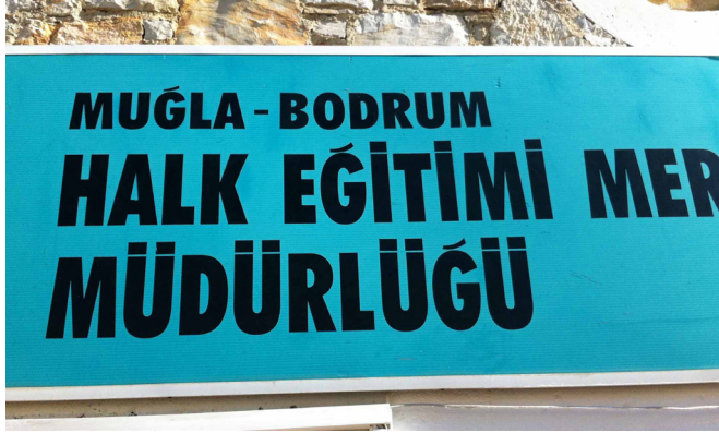
Fotoğraf 3. ‘ğ’nin şapkasının başka bir yazı karakterinden uydurulması, 2015.

Tasarlanmış her harf, kendi içinde doğru ve dengeli bir negatif - pozitif alan ilişkisi barındırmaktadır. “Helvetica yazısı”, fotografik olarak daraltıldığı zaman gerçek ‘Helvetica Condensed’ ile aynı değildir... Unutulmaması gereken ayrıntı, yeniden oranlanmış yazılardaki bozulmaların okunurluğu azaltacağıdır.” (Sarıkavak, 2004: 153). Diğer bir örnek ise, Türkçede bulunan, dilimize özel harflerin ‘ç, ğ, ş, ü, ö’, büyük harf majüskül ve küçük harf minüskül kullanımı sırasında başka bir yazıyüzünden uyarlanmaya çalışılması nedeniyle yine harf anatomisinde görülen sıkıntılardır (Fotoğraf 3).