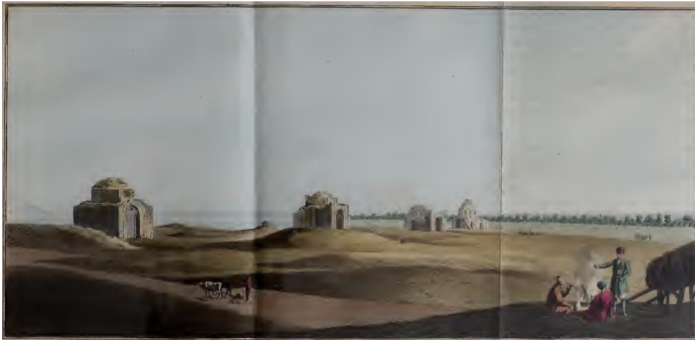
Resim 2. Macar Şehrini Ait Kalıntılar (Pallas, 1812, s. 385)

P. S. Pallas araştırmaları esnasında çift kubbe ile örtülen 8 veya 12 yüzlü kübik hacimli binalar görmüştür. Bu yapılarda yarım küre şeklindeki kubbe korunmuş, yapıların dışında da bir türbede görülebilen bir çadır örtüsü, girişin sivri bir kemerle tuğla