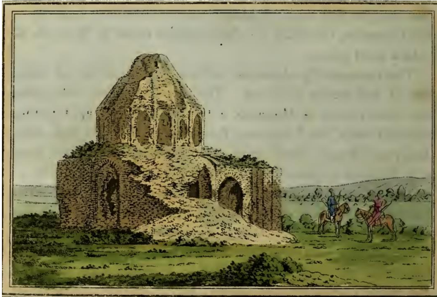
Resim 4. Macar Şehrine Ait Kalıntılar (Pallas, 1812, s. 400)

19. yüzyıla kadar ulaşmayan yapılardaki incelemede duvarları sadece kil ile betonlanmış olmasına rağmen, yaklaşık 15 fit karelik bir temel ve 36 fit uzunluğunda ve 26 fit genişliğinde başka bir temelle karşılaşmıştır. Bu temellerin ötesinde, kuzeye doğru yaklaşık 92 fit ve çevresi 41 fit olan konik bir yapının kalıntıları da keşfedilmiştir. Yine bölgenin güneyinde birbirinden uzak başka bir harabe hattı mevcuttur. Büyük bir sekizgen yapının kalıntıları bu noktadan 8 fit ötede 27 fit çapında bir yapı ve daha doğu yönünde, başka bir yuvarlak ama daha küçük tuğla yığını, batıya doğru da birkaç harabe yığını vardır. En büyük yapı, ilk parça yığınının 300 fit batısındadır; dikdörtgen ve kare