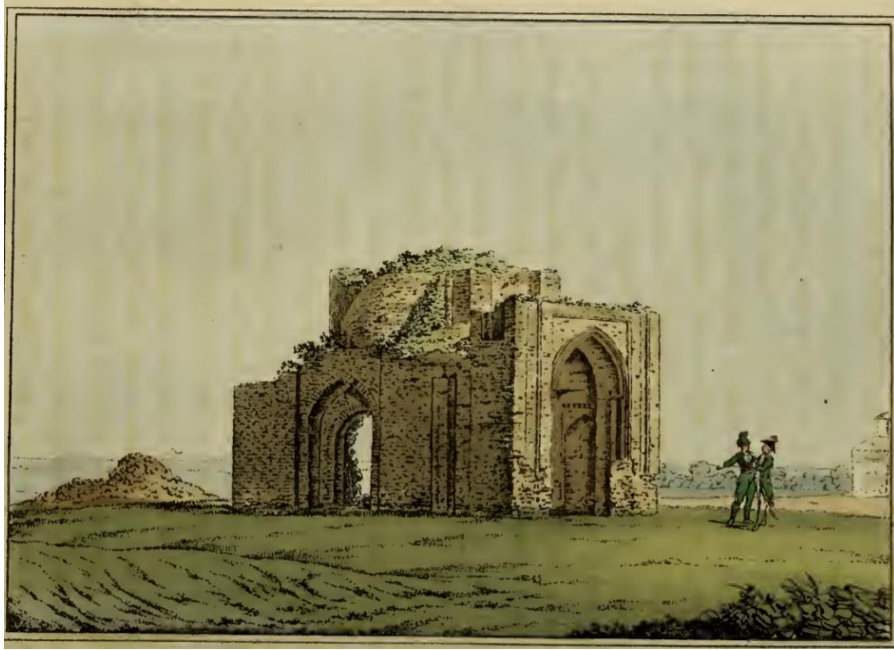
Resim 3. Macar Şehrine Ait Kalıntılar (Pallas, 1812, s. 388)

veya kiremitle kaplı iki U şekilli bir çerçeve ve çoğunda yapının ortak prizmatik gövdesinde yazılı yüksek bir portal mevcuttur. Buradaki yapıların yan duvarlarında U şekilli nişler de yapılmıştır (Zilivinskaya ve Vasiliev, 2012, s. 87).