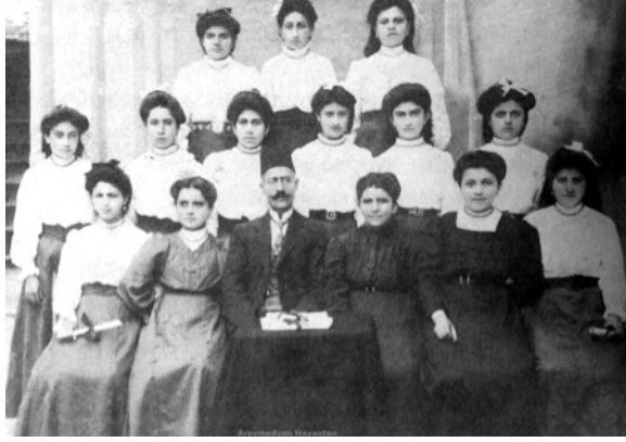
Hırpsimyants Okulu Mezunları 1911 73