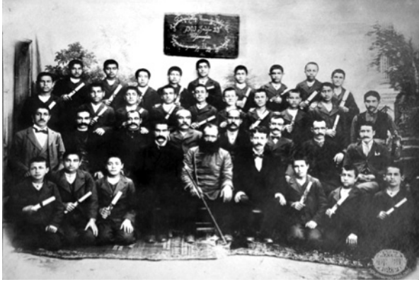
Aramyan Okulu, Sivas 1903. Mezun olan sınıf, müdür ve öğretmenleriyle. 74

Aramyan Mektebi'nin bir de Talebe Derneği vardır. 1910-1913 yılları arasında yayınlanan "Gapira ve Güvercin" gazetelerinin de bu derneğin yayın organları olduğu bilinmektedir. 75