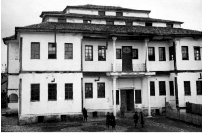
Sivas Aramyan Mektebi 72

Bahsi geçen bu mektep, belgelerde adı belirtilmemekle beraber, Aramyan Mektebi'dir. Bina yapıldıktan sonra ilk katına Hripsimiyants Mektebi yerleşmiş, ikinci katı erkek öğrencilere ayrılmıştır. 71