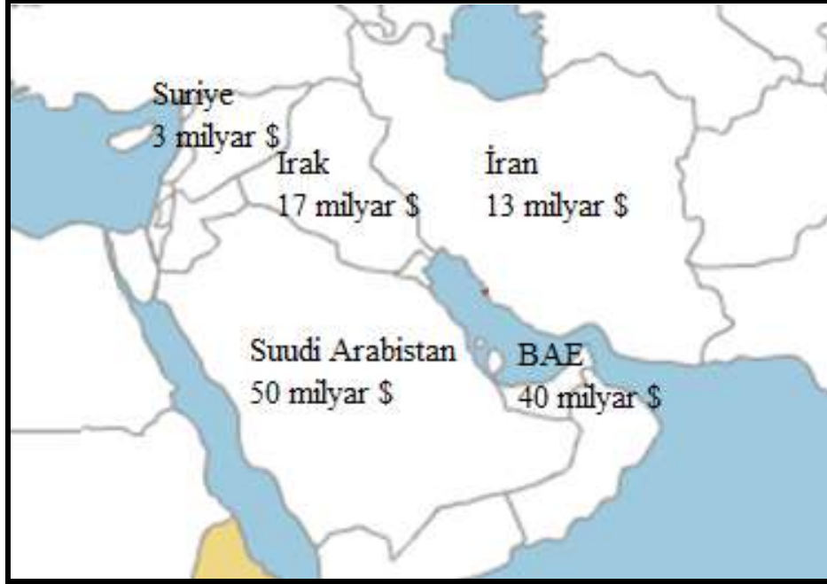
Şekil: 2012 Yılı İçin Açıklanan Silahlanma Bütçeleri

Ortadoğu, gerek ABD gerekse de Avrupa devletleri açısından stratejik öneme sahip bir mekândır. ABD ve Avrupa devletleri için Ortadoğu'nun önemi; enerji kaynaklarına ucuz ve güvenilir bir şekilde ulaşabilme, açık ve güvenli bir deniz ticaret yolu, İran'ın kontrol altında tutulması, Basra Körfezi'nden dünya pazarlarına sorunsuz ulaşan enerji kaynakları, silah pazarı ve İsrail'in güvenliği şeklinde özetlenebilir. Bu nedenlerden dolayı Ortadoğu tarih boyunca her zaman önemini korumuş ancak bu özelliği aynı zamanda mekânsal açıdan bölgenin karmaşa içerisinde bırakılmasına neden olmuştur. Aralık 2010'dan beri proje kapsamında bulunan devletlerde yaşanan Arap Baharı süreci de, Ortadoğu'nun kaderini ortaya koyan gelişmelere örnektir.