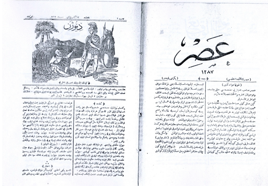
Şekil 1: Selim Nüzhet Gerçek'in kitabında “Vesikalalar” kısmında yer alan Asır dergisi

sadece bir sayfasının kitapta yer alması dergi hakkında kesin bilgiye ulaşmayı engellemektedir. Münir Süleyman Çapanoğlu ise Asır gazetesinin sahibinin Mehmet Tevfik olduğunu belirterek “(...) O devirde mizah moda halini aldığından (Asır) da böyle yapmış, bu modaya uymuş, bir de gayet küçük kıtada bir mizah sayısı çıkarmıştır(...) ” şeklinde Asır dergisinden bahsetmektedir (1962, 65). Bununla birlikte Çapanoğlu, Ebüzziya Tevfik ve Ahmet Rasim’a devri yaşamış ve devrin basın hayatı içinde bulunmuş olmalarına rağmen Asır gazetesi hakkında hiçbir bilgi aktarmamalarına sitem etmektedir. İnuğur da Asır dergisi hakkında “1870 yılında çıkan gazetelerden biri de Mehmet Tevfik tarafından küçük boyda yayınlanan ( ASIR )’dır. Bu gazete ayrıca özel eğlence sayıları da çıkarmıştır (...)” şeklinde bilgi vermektedir (2005, 247). Ömer Faruk Akün ise Mehmet Tevfik’in gazetesinde “haftalık eğlence nüshaları” yayınladığını belirterek Türk mizah basınının öncüsü ve kurucusu olduğundan bahsetmektedir (1993, 240). Turgut Çeviker de Gelişim Sürecinde Türk Karikatürü kitabında Asır dergisini görmediğini belirterek Selim Nüzhet Gerçek’in verdiği bilgileri aktarmaktadır (1986, 122).