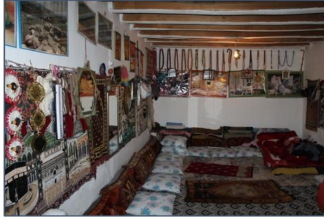
Fotoğraf 1: Fazıl Çelik'in salonunda yer alan halı yastıklar, Bulanık, Balotu (Têğud) Köyü.