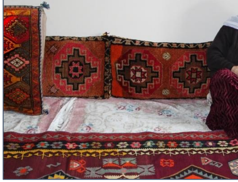
Fotoğraf 2: Hasret Aydın'a ait halı yastıklar, Bulanık, Balotu (Têğud) Köyü.