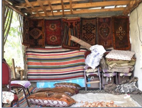
Fotoğraf 3: Maşuk Balıkçı'ya ait sedir ve halı yastıklar, Bulanık, Uzgörü (Neynik) Köyü.