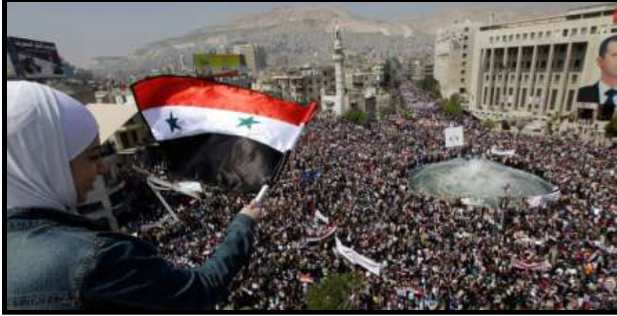
Fotoğraf 1: Suriye'de Essad Yanlısı Gösteriler

Suriye'deki önemli sorunlardan başında, Sünnilerin çoğunlukta olmasına karşın yönetimde Şiiilerin bulunması gelmektedir. Bu nedenle Suriye'de mezhepsel bölünmeye giden bir süreç ortaya çıkmaktadır (Fotoğraf 1).