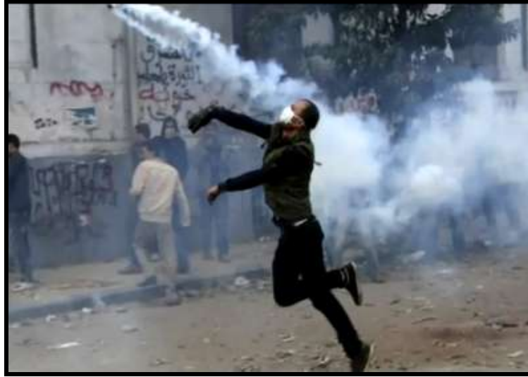
Fotoğraf:2 İsyancıların Tepkileri ( http://www.youtube.com/watch )

Yaşanan tüm gelişmeler, Suriye’de 3 muhalif grubun doğmasına neden olmuştur: Suriye Ulusal Konseyi , Özgür Suriye Ordusu ve Protestocu muhalifler . Bu muhalif gruplar içerisinde en etkin olanı, Özgür Suriye Ordusu ’dur (Fotoğraf 2).