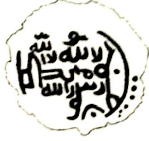
Arka yüz Lailahe illallah Muhammedün Resulu'llah Ömer, Ebubekir, Osman, Ali