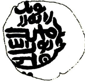
Arka yüz Lailahe illallah Muhammedün Resulu'llah Ömer, Ebubekir, Osman, Ali

Yukarıda bilgileri verilen sikkeler tarihsiz olsa da üzerinde iki beyin isminin var olması, Aydınoğullarıyla Osmanlının müşterek sikkeleri olduğunu göstermektedir. Ancak hangi tarihlerde darp edilebileceğine dair fikir yürütemek için, iki devletin arasındaki siyasi ilişkileri tahlil ederek, sikkelerin darp edildiği dönemi ortaya koymak gerekir.