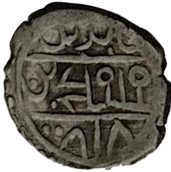
Ön yüz Mehmed bin Bayezid, halled mülkehü 818

Çelebi Mehmet ile İlyas Bey'in 1415 tarihli müşterek sikkesi 0.70 gr 15 mm ölçeklidir. (Damalı, 2009, s. 205)