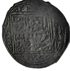
Ön yüzü Eyyam-ı devletü 'z-zaman Mehmed bin Bayezid Ebu Bekir, Ömer, Osman, Ali