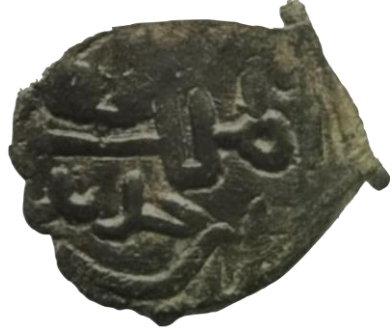
Arka yüz el-mülk-ü l'illah duribe Balad