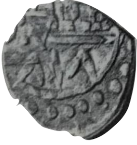
Ön yüz Mehmed bin Bayezid, halled e mülkehü 818