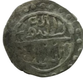
Arka yüz Resulu'llah İlyas bin Mehmed

İlyas Bey, 1421 yılında ölünce, beyliğin toprakları Leys (Üveys) ve Ahmet adlı iki oğlu arasında paylaştırılmıştır. Her ikisi de Çelebi Mehmet ve 2. Murat'la birlikte müşterek sikke darp etmişlerdir.