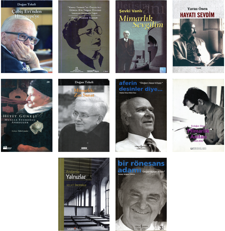
Resim 1. Yaşam anlatılarının kapaklarında mimar portreleri.