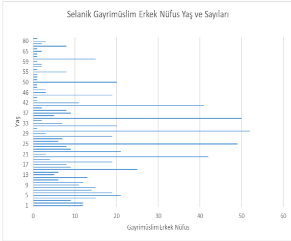
Figür 1: Gayrimüslimlerin yaş dağılımı (1841)

Kullandığımız gerek Müslim defterinde gerekse de reaya defterinde yer alan yaş verileri sayısal okur yazarlık düzeylerini hesaplayabilmemiz için elverişlidir. Figür 1 ve 2 de görüldüğü üzere kendilerine yaşları sorulduğunda son basamağı “0” ve “5” ile biten rakamlar dillendiren bireylerin sayısı gözle görülür biçimde fazladır. Her iki figürde de dikkatimizi çeken ikinci husus gayrimüslimlere görece Selanik’te incelememize konu olan dört yerleşim biriminde Müslüman nüfusun daha genç bir nüfus yapısına sahip olduğudur.