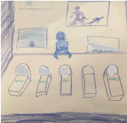
Şekil 1. Travma grubundaki kız çocuğun resmi