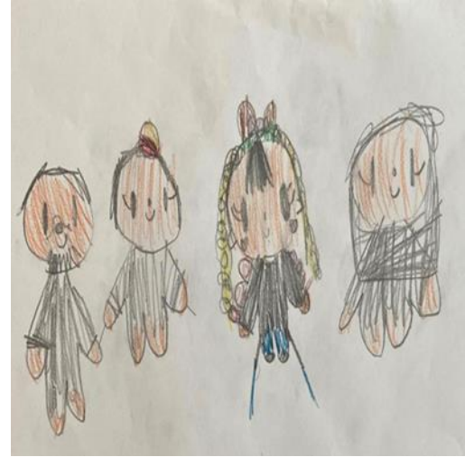
Şekil 6. Karşılaştırma grubundaki kız çocuğun resmi

Şekil 5' de beş yaşında, ani bir kayıpla travmatize olan bir kız çocuğun aile çizimi yer almaktadır. Ailenin özellikleri ele alındığında, kayıp yaşantısının geliştiği aile ortamı mevcuttur. Renk kullanımı incelendiğinde, kırmızı renk kullanımı, yerine göre farklı anlamlar içermekle birlikte travmatik yaşantıda tehlikenin halen sürdüğünün göstergesidir. Yoğun duygular kırmızı renkle dışavurulmuş olabilir. Furth (2002) kırmızı rengin önemli bir konunun, duyguların patlaması ya da tehlike sinyalini içinde taşıyabildiğini belirtmiştir. Bu açıdan çocuğun kaygı duygusu dikkat çekmektedir. Abdi ve arkadaşları (2004) kaygısı yüksek olan çocukların çizimlerinde kırmızı rengi daha çok kullandıklarını ve kalem çok fazla bastırdıklarını bildirmişlerdir. Çizim düzeyine bakıldığında resim bastırılarak çizilmiştir, çocuk iç dünyasında huzursuzdur, çocuğun duygusal gerilim yaşadığı yorumu da yapılabilir. Resim genel olarak kalın hatlarla çizilmiş, kâğıtta izler bırakmışsa bu durum dürtüsellik göstergesidir. Bir sayfada kalem baskısı varsa saldırganlığı ve çatışmayı gösteriyor olabilir (Halmatov, 2016). İçerik düzeyi açısından, çocuğun yaşamında olanlardan ne kadar etkilendiği görülmektedir, çocuk aile algısı bozulduğu için kimseyi çizmemiş, sadece evi resmetmiştir.