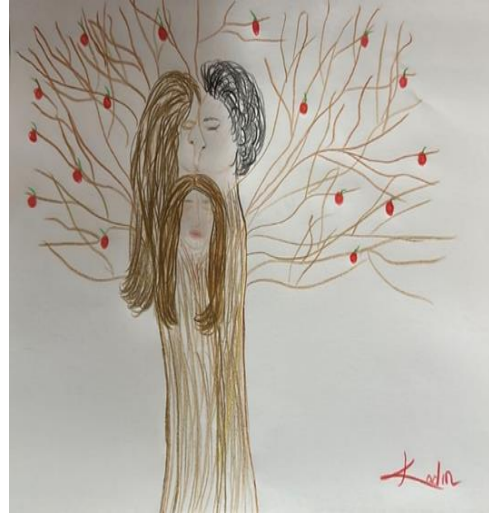
Şekil 20. Karşılaştırma Grubundaki Genç Kadının Resmi

Şekil 19' da çalışma grubundaki depresif özellikler gösteren 27 yaşındaki kadının dışavurumu yer almaktadır. Ailenin özellikleri açısından aile içi ilişkilerin zayıf olduğu, disfonksiyonel aile ortamı görülmektedir. Bu tür ailelerde yoğun duygusal rahatsızlık ve sevgi vermekte ihmalkarlık söz konusudur. Renk kullanımı incelendiğinde resim karakalem olarak çizildiği için net bir yorum yapılamamaktadır. Dilci (2014) siyah rengin depresyon ve karamsarlığı yansıttığını belirtmiştir. Çizim düzeyi incelendiğinde bastırma, siliklik yoktur. Gece ve gündüzü temsil eden ay imgelerindeki koyuluklar kadının bölme savunma mekanizmasını yansıtıyor olabilir. Resimde kâğıdın dikey kullanımı bilişsel katılığa işaret olarak değerlendirilmiştir. İçerik düzeyi açısından ağaç imgesi, kişinin yaşam enerjisini, aile yaşantısını içermektedir. Kadının kendini yalnız çizmesi izolasyonun ve sosyal destek eksikliğinin dışavurumudur. Ağacın saksıda oluşu ve saksının kırılan bölümleri kadının yaşantılarındaki kırılmayı ve uzaklaşma ihtiyacını duygusal gerilimler yaşadığını göstermektedir. Aile üyeleri resme dahil edilmemiştir.