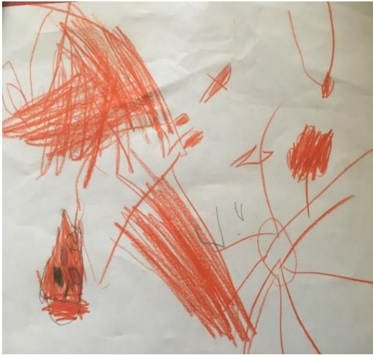
Şekil 5. Travmatize kız çocuğun resmi

Şekil 4' de ise karşılaştırma grubundaki sekiz yaşındaki bir kız çocuğun çizdiği aile çizimi yer almaktadır. Ailenin özellikleri incelendiğinde, annenin baskın olduğu aile yaşantısı söz konusudur. Renk kullanımına bakıldığında, mor renk sorumlulukların ağır geldiğini yansıtıyor olabilir, aynı zamanda kahverengi tonlar saklanmayı temsil ediyor olabilir. Çizim düzeyi açısından bastırma, siliklik, koyuluk yoktur. İçerik düzeyi incelendiğinde sağdaki figür çocuğun öğretmenidir. Kendisi ortadadır. Sol bölüm, resmi çizenin en sevdiği kişinin çizildiği kısımdır, bu bölüm anneye ayrılmıştır. Çocuğun aile algısında iki kadın özdeşim nesnesi olarak görülmektedir. Ellerin çizilmemesi kendine güveninin azaldığını düşündürmektedir. Ayrıca ellerin yokluğu utangaçlık duygusu ve iletişim zorluğu olarak ele alınmıştır. Figürlerdeki yüz ifadelerinde gülen ağızlar olduğu görülmektedir. Mutluluk teması düşünülmektedir. Öte yandan aile üyelerinden sadece anne resme dahil edilmiştir, baba imgesi resimden elenmiştir. Bu açıdan çocuk bilinçdışı süreçte babayla bir çatışma yaşıyor olabilir.