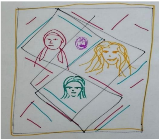
Şekil 15. Travmatize Genç Kadının Resmi

Şekil 14' de 30 yaşında bir kadının aile çizimi yer almaktadır. Ailenin özellikleri açısından işlevsel aile ortamı mevcuttur. Renk kullanımında baba figürü sakinliği ifade eden mavi renge boyanmıştır. Annedeki turuncu ton coşkuyu ve hareketi yansıtmaktadır. Çizim düzeyi incelendiğinde bastırma, siliklik, koyuluk yoktur. İçerik düzeyinde ise bireyin güneşini anne oluşturur. Anneyle olan yakınlık ve güneşin merkezdeki yerleşimi kapsanmayı göstermektedir. Anne işlevseldir. Aynı zamanda resimde ayrıntılı çizim yapılmıştır, bu durum resmi çizen kişinin ayrıntılara önem veren yapısını da göstermektedir. Ağacın sayfanın soluna çizilmesi Altinköprü (2017) tarafından aileye bağlılık olarak ifade edilmiştir. Aile içinde önemsenen bireyler ve barışık aile ortamı olan evlerin çevresi çiçeklerle, kuşlar ve evcil hayvanlarla resmedilir. Bu açıdan çalışmada mutlu bir tema vardır. Aile üyelerinin tamamı resme dahil edilmiştir. Barışık bir ortam çizilmiştir.