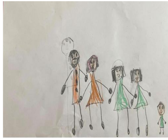
Şekil 10. Karşılaştırma grubundaki kız çocuğun resmi

Şekil 9' da şiddet ortamında büyüyen 10 yaşındaki bir kız çocuğun aile çizimi görülmektedir. Ailenin özellikleri açısından ihmalkâr ve saldırgan aile ortamı yaşantısı mevcuttur. Renk kullanımında sınırlılık görülmesi açısından çocuğun duygularına mesafeli olabileceği