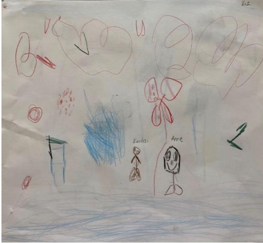
Şekil 7. Travmatize kız çocuğun resmi

bölümde ilk çizilen baba figürü babaya olan bağlılığı, babasıyla arasına kardeşini koyması babayla olan iletişim engelini göstermektedir. Aile üyelerinin tamamı resme dahil edilmiştir.