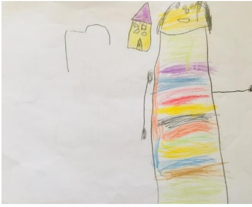
Şekil 11. Travmatize Kız Çocuğun Resmi

Şekil 10' da 10 yaşındaki bir kız çocuğun çizdiği aile resmi görülmektedir. Renk kullanımı açısından seçimlerinde üç kardeş için yeşil kullanımı özdeşimi yansıtmaktadır. Resimdeki silme davranışı değerlendirildiğinde çocuktaki hata yapma korkusu düşünülmüştür. Çizim düzeyinde de koyuluk vardır. Çizimler kontrollü biçimde çizilmiştir. Bu açıdan duygusal gerilim düşünülmektedir. Ayrıca sıkça silgi kullanımı yüksek kaygı duygusunu yansıtır. İçerik düzeyi incelendiğinde annesiyle arasında ablası yer almaktadır. En solda çizilen baba çocuğun en sevdiği kişi gibi görülmektedir. Babanın silinip yeniden çizilmesi ve ablanın silinip yeniden çizilmesi çocuğun onay ihtiyacı ve hata yapma korkusunun dışavurumu olabilir. Figürler ve nesnelere arasında yakınlık bulunması olumlu değerlendirilmiştir. Aile üyelerinin tamamı resme dahil edilmiştir.