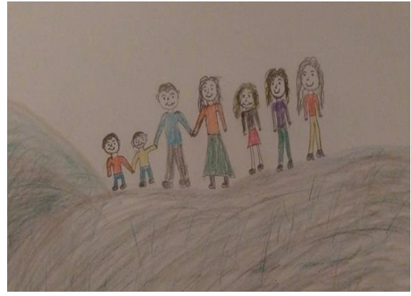
Şekil 12. Karşılaştırma Grubundaki Kız Çocuğun Resmi

Şekil 11' de ailesi ölen altı yaşındaki bir kız çocuğun aile çizimi yer almaktadır. Ailenin özellikleri açısından kayıp yaşantısının olduğu, şu an kaotik durumda olan bir aile ortamının varlığı söz konusudur. Renk kullanımı incelendiğinde çocuğun birçok rengi bir arada kullanması duygu yoğunluğunu ve geçişlerini göstermektedir. Dilci (2017) sarı rengin baskınlığının, hüznün ve bir şeylere özlem duyulmasının göstergesi olduğunu belirtir. Çocuğun ailesine bağlı olması resimde kendini sarı tonlarla gösterebilir. Furth (2002) bu çocukların heyecanı yüksek kişiler olduğunu belirtir. Sarı renk babaya bağlılığın da bir işareti sayılabilir. Çizim düzeyi açısından bastırma, siliklik, koyuluk yoktur. İçerik düzeyi incelendiğinde sağdaki tek figür çocuğun aile algısındaki yalnızlaşmayı temsil etmektedir. Boyunsuz çizilen insan figürü çocuğun öz düzenleme kapasitesindeki güçlüğü yansıtmaktadır. Mor renkteki çatı çocuğun hane ve korunmayla ilgili ya da kaldıramayacağı sorumluluklarını, anne ve baba desteğine ihtiyaç duyduğunu düşündürmektedir.