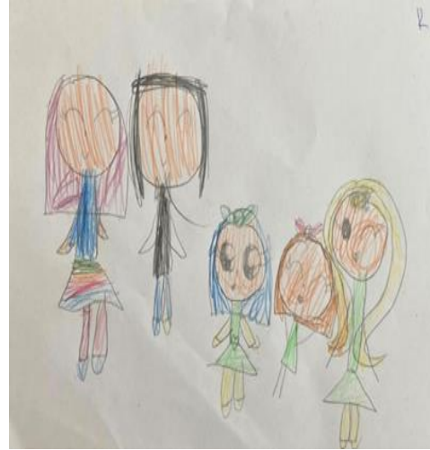
Şekil 8. Karşılaştırma grubundaki kız çocuğun resmi

Şekil 7' de kopuk aile ilişkileri olan yedi yaşında bir kız çocuğun aile çizimi görülmektedir. Ailenin özellikleri açısından parçalanmış aile, baskıcı tutumun olduğu ortam mevcuttur. Çocuk uzun zamandır babasını görmemektedir. Renk kullanımı incelendiğinde, çocuğun çalışmadaki sınırlı renk kullanımı duygularıyla mesafesini yansıtıyor olabilir. Avara (2019) mavi rengi seçenlerin mantığa önem verdiklerini ve yalnızlığa yakın olduklarını öne sürmüştür. Çizim düzeyi açısından resim bastırılarak çizilmiştir, çocuk iç dünyasında huzursuzdur. İçerik düzeyi incelendiğinde annesi ve kendi dışında kimseyi resme dâhil etmeyen çocuk aile algısında sadece annesinin olduğunu göstermektedir. Aynı zamanda annesiyle arasına yerleştirilen çiçek ailedeki iletişim eksikliği olarak yorumlanabilir. Annenin başının büyük çizilişi onun otoritesini gösteriyor olabilir.