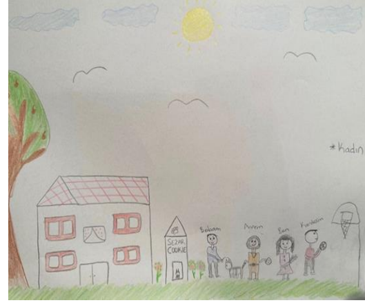
Şekil 14. Karşılaştırma Grubundaki Genç Kadının Resmi

Şekil 13' de aile içi şiddet gören 35 yaşında bir kadının aile resmi yer almaktadır. Renk kullanımı incelendiğinde siyah beyaz çizimi duygularına mesafe koyma ihtiyacını düşündürmektedir. Çizim düzeyinde belirgin bir bastırma, siliklik, koyuluk yoktur. İçerik düzeyi açısından kağıdın sol bölümünde en sevilen ya da çatışılan çocuğuna yer verdiği anlaşılmaktadır. Anne, çocuğu güneşte bırakarak kapsayıcılığını sunmuş ve sol bölümü çiçeklendirerek onunla ilgili arzuları dışavurmuştur. Kendi bölümünde ise yağmur çizimi ve bulutlar bastırma savunma mekanizmasını ve depresif duygu durumunu yansıtıyor olabilir. Her iki figürde yer alan çantalar da bu mekanizmanın habercisidir. Anne figüründe ayaklar çocuğa yönelmiştir. Annenin libidinal enerjisinin azaldığı ve çocuğundan güç aldığı düşünülmüştür. Anne sayfayı aslında ikiye bölmüş; çocuğu güneşte, kendini yağmurda bırakmıştır. Bu açıdan kötü ben- iyi öteki algısı ile bölme mekanizmasının kullanımı söz konusu olabilir. Bölme savunma mekanizmasının kullanım amacının, iyi ve kötü olan nesne ve kendilik imgelerinin bütünleşmesinden kaynaklanacak kaygıları azaltmak ve iyi nesnelere kötü nesnelere korunmasını sağlamak olduğu belirtilir (Winnicott, 2006).