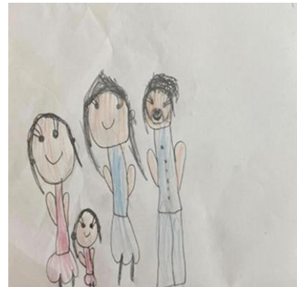
Şekil 2. Karşılaştırma grubundaki kız çocuğun resmi