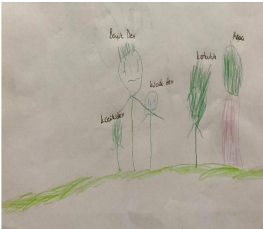
Şekil 9. Travmatize kız çocuğun resmi

Şekil 8' de karşılaştırma grubundaki altı yaşındaki bir kız çocuğun çizdiği aile resmi yer almaktadır. Ailenin özelliklerini demokratik aile ortamı olarak tanımlamak mümkündür. Annede birçok rengin kullanılması aslında annenin birçok yüzünü ve çocuğun ona yönelik yoğun duygularını da yansıtıyor gibidir. Çizim düzeyinde bastırma, siliklik, koyuluk yoktur. İçerik düzeyi incelendiğinde çocuk kendini merkezde konumlandırmıştır. İri gözler gözlemcilik ve sosyalleşmeyi yansıtmaktadır. Merak duygusu olan, dışa dönük çocuklar figürleri bu şekilde çizmektedir. Altınköprü (2017) belirgin, iri, ayrıntılı çizilen gözlerin; canlı ilişkilerin varlığına işaret olabildiğini belirtir. Aile üyelerinin tamamı resme dahil edilmiştir.