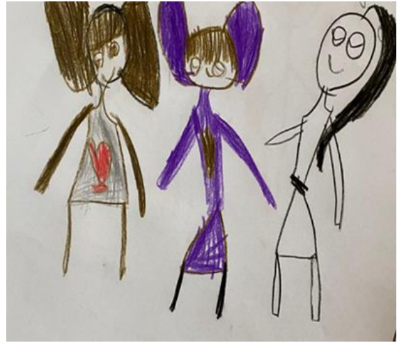
Şekil 4. Karşılaştırma grubundaki kız çocuğun resmi

Şekil 3' de cinsel istismar yaşantısı olan 10 yaşında bir kız çocuğun aile çizimi bulunmaktadır. Ailenin özellikleri açısından çocuğu korumayan işlevsiz-ihmkâr aile ortamı mevcuttur. Renk kullanımı incelendiğinde, çalışma resmi çizenin gerçeklik döneminde olmasına paralel biçimde doğayla uyumlu biçimde renklendirilmiştir. Çizim düzeyi incelendiğinde bastırma, koyuluk, siliklik yoktur. İçerik düzeyi incelendiğinde çocuk ailedeki tek bir kişiyle kendini konumlandırmış ve ateş başında ısındıklarını ifade etmiştir. Bu açıdan çocuğun aile algısında bir kişi ile özdeşim kurduğu ve ihtiyaçlarını onunla giderdiğini anlaşılmaktadır. Kalın ağaç gövdesi çocuğun anneye olan bağlılığını yansıtmaktadır. Aynı zamanda çocuk, örseleyici olaylardan sonra da psikososyal gelişimde gerileme yaşamaktadır. Kalın ağaç çocuğun öğrenme yaşantısındaki güçlüklerle ilgili bilgileriyle uyumludur. Ağacın gövde başlangıcının ana gövdeye oranla geniş tutulması, kavrama ve öğrenmede yavaşlık olarak belirtilir (Altinköprü, 2017). Bunun yanında Dilci (2014) resimde