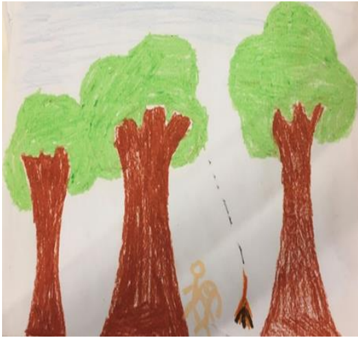
Şekil 3. Travma grubundaki kız çocuğun resmi

Şekil 2' de karşılaştırma grubundan sekiz yaşındaki bir kız çocuğun aile algısı yer almaktadır. Ailenin özellikleri açısından annenin baskın olduğu aile yaşantısı mevcuttur. Bu çocukta işlev bozucu bir travmatik yaşantı kaydedilmemiştir. Renk kullanımına bakıldığında, pembe ve mavi renk seçimleri iyimserlik ve güven duygusunun dışavurumu olarak değerlendirilmiştir. Çizim düzeyi açısından bastırma, siliklik, koyuluk yoktur. İçerik düzeyi incelendiğinde annesiyle arasına kardeşini koyması annesiyle sınırlı ilişkiyi düşündürmektedir. En sağda olan baba imgesi hem geleceği temsil etmekte hem de babayla iletişimin sınırlı olup olmadığı yorumuna açıktır. Aile üyelerinin fiziksel yakınlığı olumlu bulunmuştur. Altı yaşından sonra çocukların çizimlerinde eller ve ayaklar gibi uzuvların yer alması gerekmektedir. Çocuğun babaya ayak çizmemesi onunla ilgili bazı güçlükler yaşadığını düşündürmektedir. Çocuk ebeveynlerden birinin ayağını eksik çizmişse çocuğun güven sorunu yaşadığı düşünülür. Aynı zamanda babanın baş çizimi de küçüktür. Annenin baskın olduğu aile yaşantısı, annedeki büyük baş çizimi ile kendini göstermektedir. Aile üyelerinin tamamı resme dahil edilmiştir. Uyumlu kategorisine ait çocukların çizimleri daha doğru, düzenli ve biçimlidir ve bu önceki spesifik literatürü (Corman, 1964, Porot, 1965) doğrulamaktadır.