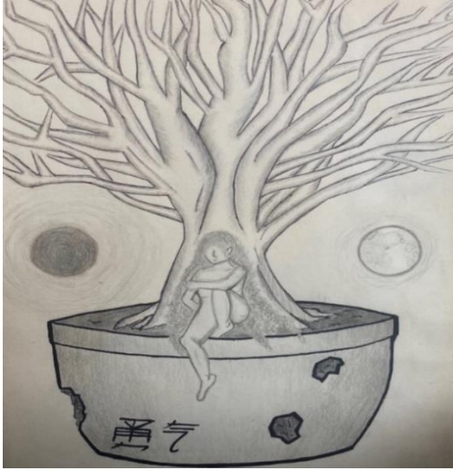
Şekil 19. Travmatize Genç Kadının Resmi

ve dengeli bireyler yeşil renge yönelebilmektedir. Kuşların gözleri merakı, içiçe oluşları barışçıl, iletişimin iyi olduğu bir aile ortamını aktarmaktadır.