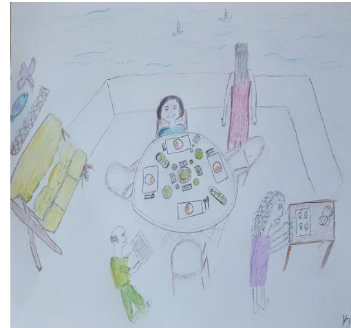
Şekil 16. Karşılaştırma Grubundaki Genç Kadının Resmi