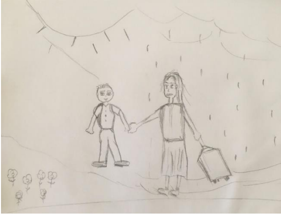
Şekil 13. Travmatize Genç Kadının Resmi