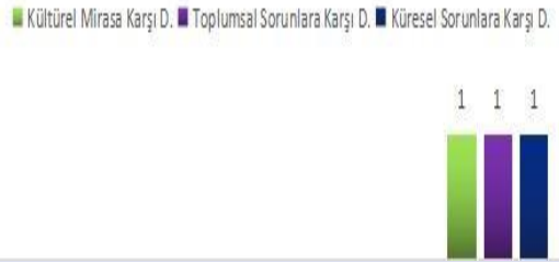
Grafik 4. 4. Ünitenin Duyarlılık Türleri Oranları

3. ünite, M16, M17, M18, M19, M20, M21 kodlu metinleri içermektedir. Şekil.3 incelendiğinde, metinlerde en fazla %62,5 oranla küresel sorunlara karşı duyarlılığın yansıtıldığı gözlemlenirken ikinci sırada %25 oranında toplumsal sorunlara karşı duyarlılığın metinlere yansıtılması gözlemlenmektedir. %12,5 oranla en az yansıtılan duyarlılık türünün doğal çevreye karşı duyarlılık olduğunun söylenmesi mümkündür. 3. ünite metinlerinde diğer duyarlılık türlerinin yansıtılması saptanmamıştır.