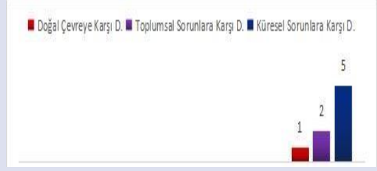
Grafik 3. 3. Ünitenin Duyarlılık Türleri Oranları

2. ünite M5, M6, M7 M8, M9, M10, M11, M12, M13, M14 ve M15 kodlu metinleri içermektedir. Şekil.2 incelendiğinde, metinlerin %36,36 oranla en fazla toplumsal sorunlara yönelik duyarlılık gösterdiği görülmektedir. %31,81 oranla Türk Tarihi ve Türk Büyüklerine karşı duyarlılık, toplumsal sorunlara karşı duyarlılığı takip etmektedir. %22,72'lik bir oranla kültürel mirasa karşı duyarlılık üçüncü sırada yer alırken söz konusu üniteye %9,09 oranla en az küresel sorunlara karşı duyarlılık saptanmıştır.