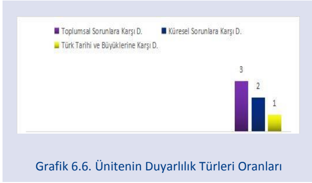
Grafik 6.6. Ünitenin Duyarlılık Türleri Oranları

Türk Büyükleri'ne karşı duyarlılık yansıtılmıştır. %12,5 oranla en az doğal çevreye karşı duyarlılık yansıtılmıştır. Diğer duyarlılık türleri, kodları verilen metinlerde saptanmamıştır.