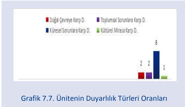
Grafik 7.7. Ünitenin Duyarlılık Türleri Oranları

6. ünite, M29, M30 ve M31 kodlu metinleri içermektedir. Şekil.6 incelendiğinde, bahsi geçen metinlerde %49,99 oranla en fazla toplumsal sorunlara karşı duyarlılık yansıtılırken, %33,33 oranında küresel sorunlara karşı duyarlılık yansıtılmış ve ikinci sırada yer almıştır. %16,66 oranla Türk Tarihi ve Türk Büyükleri'ne karşı duyarlılık 6. ünite metinlerinde en az yansıtılan duyarlılık türü olarak saptanmıştır. Diğer duyarlılık türlerine söz konusu ünite metinlerinde yer verilmemiştir.