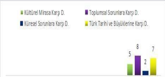
Grafik 2. 2. Ünitenin Duyarlılık Türleri Oranları

1. ünite, M1, M2, M3 ve M4 kodlu metinleri bünyesinde barındırmaktadır. M1 kodlu metinde kültürel mirasa yönelik duyarlılığın yansımaları görülürken, M2, M3 ve M4 kodlu metinlerde toplumsal sorunlara yönelik duyarlılık söz konusudur. Diğer duyarlılık türlerini bu üniteye yer aldığı saptanmamıştır. Bu bağlamda, 1. üniteye yer aldığı saptanmamıştır. Bu bağlamda, 1. üniteye yer aldığı saptanmamıştır. Bu bağlamda, 1. üniteye yer aldığı saptanmamıştır.