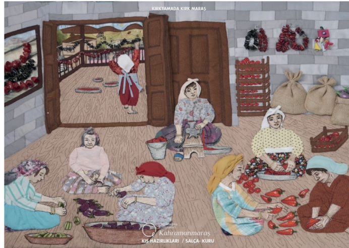
Görsel 15. Bölgede Kış Hazırlıkları Kuru ve Salça Yapımı