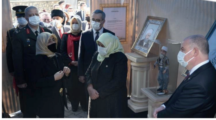
Görsel 7. Kurtuluşun Kahramanları Sergisi