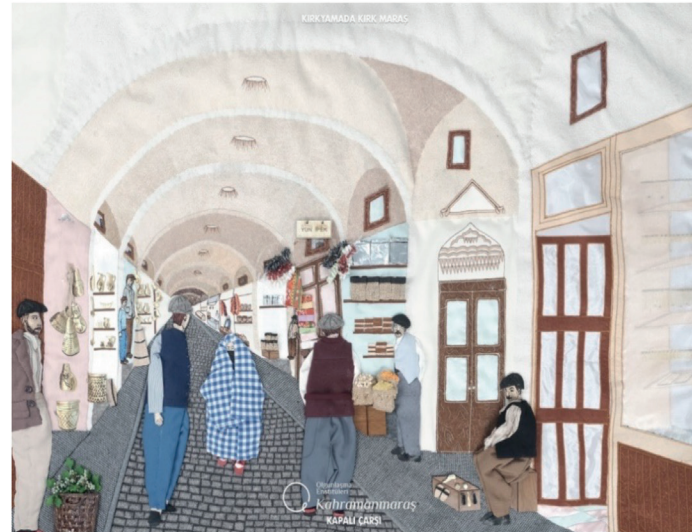
Görsel 16. Kahramanmaraş Kapalı Çarşı