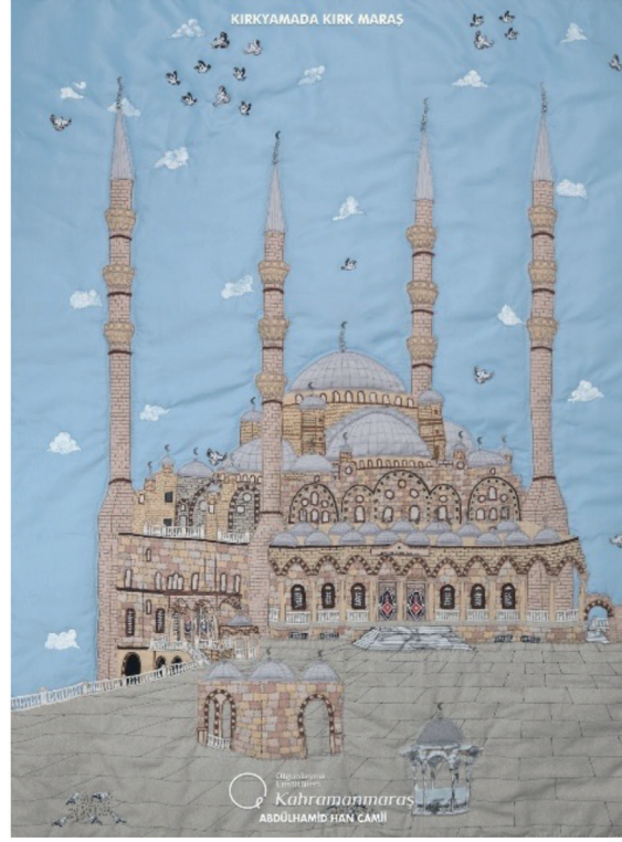
Görsel 19. Sivil Direniş Destanından Atıfla Tamamen Sivil İmkânlar ile İnşa Edilmiş Abdulhamit Han Camii