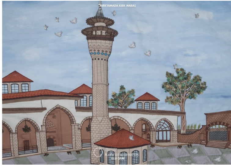
Görsel 20. Maraş Ulu Camii