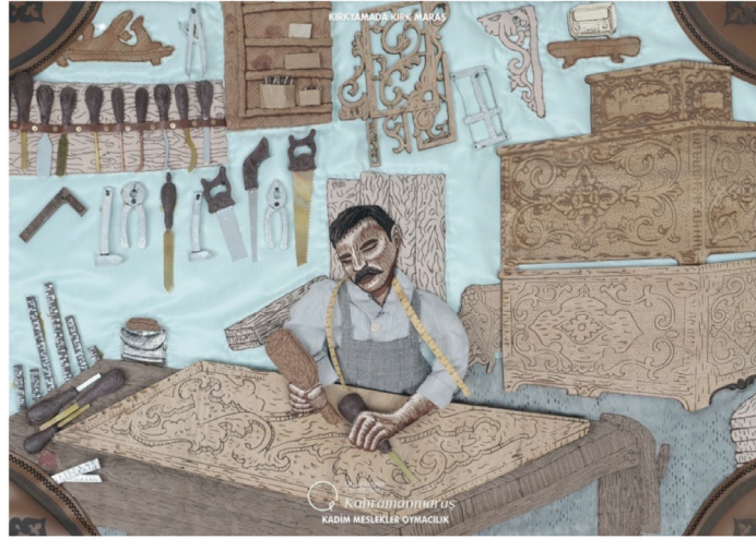
Görsel 14. Kadim Meslekler Ahşap Oyma