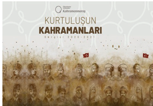
Görsel 6. Kurtuluşun Kahramanları Sergi Afişi

Enstitünün 11-12-13 Şubat 2021’de yaptığı ve kurum tarafından ziyaretçi sayısına dair yapılan giriş bileti uygulamasından edinilen verilere göre açık kaldığı üç günde 1000 adet ziyaretçinin izlediği ve her ustanın eserlerin farklı üretim süreçlerinde maharetlerini eklediği Kurtuluşun Kahramanları sergisi de pandemi koşullarına rağmen güçlü bir ses getirmiştir.