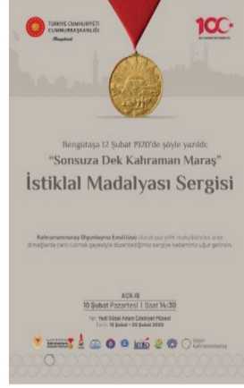
Görsel 1. Sonsuza Dek Kahraman Maraş Sergisi Afışı

ve teknikte yapıldığı ve sergi toplandıktan sonra içeriğin halka arzının devamını sağlayacak katalogun da tasarlandığı “Sonsuza Dek Kahraman Maraş” sergisi, ilk haftasında 5000 ziyaretçi olarak toplamda 12.000 izleyici ile bölgede alanında izleyici sayısında bir rekora imza atmıştır. İzleyici sayısı verilerine bakılınca şehirde sanatsal ve kültürel faaliyetlere ne denli ihtiyaç olduğu görülmektedir.