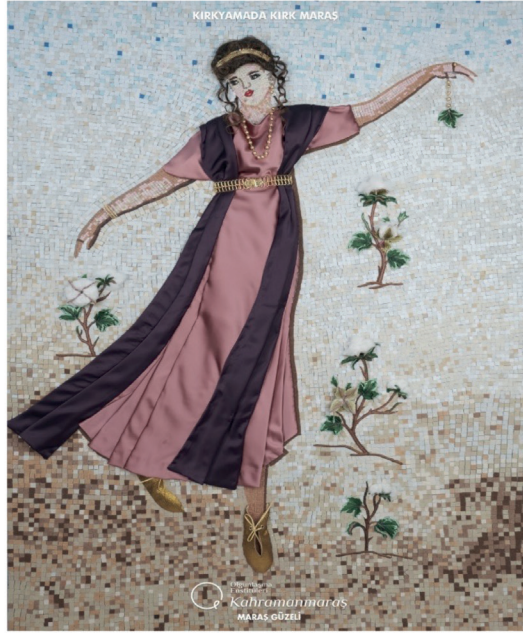
Görsel 18. Germanicia Antik Kenti Maraş Güzeli Mozaïği