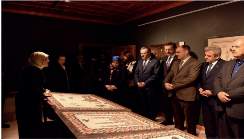
Görsel 2. Sonsuza Dek Kahraman Maraş Sergisi