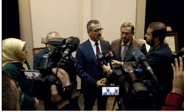
Görsel 4. Gemenicia'nın Ardından Sergisi

Kahramanmaraş tarihinde ilk defa arkeoloji müze salonunda yapılan “Gemenicia’nın Ardından” sergisi de entelektüel çevrelerce iltifat görmüştür. Kurumun bütün koleksiyonlarında olduğu gibi bu çalışması da farklı alanlarda uzmanlaşmış ustaların eserlerde ortak performans sergilemeleri ile oluşmaktadır. Yoğunlukla mozaik sanat eserlerinden oluşan ancak mozaik ile süslenmiş birçok farklı objeden oluşan sergide kurumdaki tüm ustalar farklı maharetleri ile aktif olmuştur. Yerel ve ulusal basında adından övgüyle söz ettiren çalışmalar, TRT radyolarının da ilgisini çekmiş ve muhtelif programlarda yer verilmiştir.