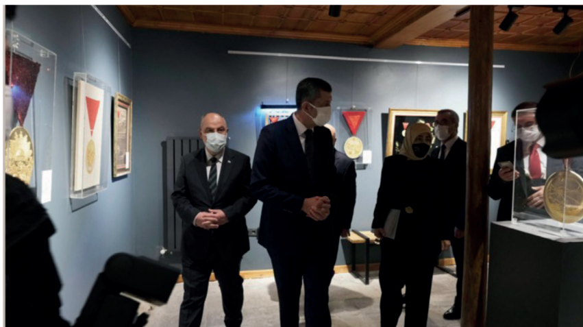
Görsel 3. Sonsuza Dek Kahraman Maraş Sergisi