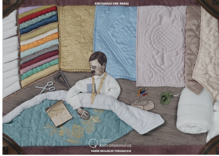
Görsel 17. Kadım Meslekler Yorgancılık