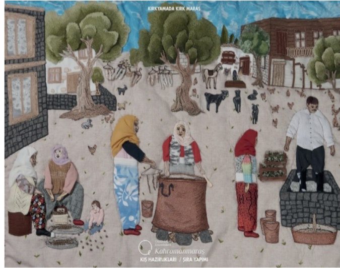
Görsel 12. Bölgede Kış Hazırlıkları ve Şıra Yapımı