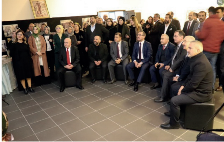
Görsel 5. Gemenicia'nın Ardından Sergisi

Enstitünün 11-12-13 Şubat 2021’de yaptığı ve kurum tarafından ziyaretçi sayısına dair yapılan giriş bileti uygulamasından edinilen verilere göre açık kaldığı üç günde 1000 adet ziyaretçinin izlediği ve her ustanın eserlerin farklı üretim süreçlerinde maharetlerini eklediği Kurtuluşun Kahramanları sergisi de pandemi koşullarına rağmen güçlü bir ses getirmiştir.