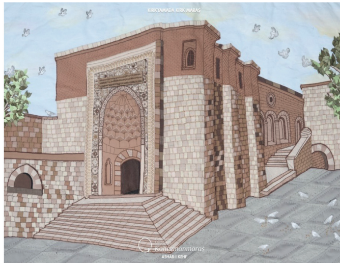
Görsel 13. Afşin Eshab-ı Khef Külliyesi