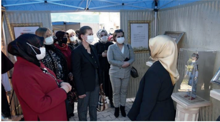
Görsel 8. Kurtuluşun Kahramanları Sergisi

Bütün objelerin yapımında enstitünün mevcut 15 atölyesinde farklı disiplinlerde ustalık belgesine sahip sanatçıların katkısı bulunan serginin eserleri: kitle karakterler, tuğralar, portreler, savaş dönemi günlük halk kıyafetleri olarak gruplandırılmıştır. Birinci bölüm eserler, araştırmacı yazar Serdar Yakar'ın 2014 de basılan “Maraş Milli Mücadelesinde Önden Gidenler” kitabında bahsi geçen Maraş sivil direnişinde kahramanca savaşan, istiklâlimizin timsali haline gelmiş yüz karakterden başlangıç olarak seçilen 12 mücahidin 70 cm boyunda tasarlanan kitle karakterleridir. İkinci bölümünde ise 12 kahramanın, zemini ebru sanatıyla hazırlanan minyatür tekniği ile yapılmış portreleri bulunmaktadır. Minyatür ve ebru sanatına derinlik katmak için bazı bölümlerinde üç boyutlu aksesuarlar eklenen portreler sanatseverlerin ilgi odağı olmuştur. Üçüncü bölüm ise kahramanlar için tasarlanan tuğralardan oluşmaktadır. (Kurtuluşun Kahramanları Sergi Kataloğu, 2022)