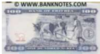
Fotoğraf 72. Eritre Banknotunda Öküzle tarla süren çiftçi (100 Nakfa)