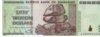
Fotoğraf 6. Zimbabwe Harare Yakınlarında Kayalıklar (50 Trilyon Zimbabwe Doları)