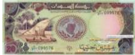
Fotoğraf 13. Sudan Banknotunda Nil Nehri'nde Yelkenliler ve Nil Boyunda Palmiye Ağaçları (20 Sudan Dinarı)