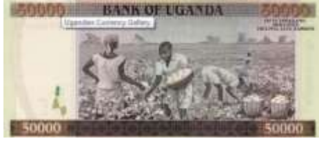
Fotoğraf 64. Uganda Banknotunda Pamuk Toplayan Çiftçiler (50000 Uganda Şilini)