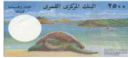
Fotoğraf 41. Komor Adalarına Ait Banknotta Deniz Kaplumbağası Görünümü (2500 Komor Frangı)