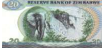
Fotoğraf 12. Zimbabwe Banknotunda Viktorya Şelalesi (20 Zimbabwe Doları)