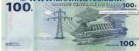
Fotoğraf 98. Demokratik Kongo Cumhuriyeti Banknotunda Kongo Nehri üzerindeki Inga II Hidroelektrik Santrali ve Yüksek Gerilim Enerji Nakil Hatları (100 Kongo Fransı)