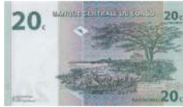
Fotoğraf 21. Upemba Ulusal Parkındaki (Demokratik Kongo Cumhuriyeti) Savanlarda Antiloplardan Görünüm (20 Kongo Frangı)

Savanların çoğunda seyrek de olsa büyüklü küçüklü ağaçlara rastlanır. Savanlarda baobap, yağ palmyesi gibi ağaçlar çoğunluktadır (Özey, 2009; 33). Bazı Afrika ülkelerinin banknotlarında palmyelere yer verilmiştir. Bu ülkeler; Cezayir, Ekvatorial Gine, Gambiya, Güney Afrika, Kamerun, Komor (Fotoğraf 22), Libya, Madagaskar, Mali, Moritanya (Fotoğraf 23), Seyşeller, Sierra Leone, Sudan, Togo ve Zambiya'dır.