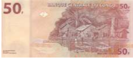
Fotoğraf 83. Demokratik Kongo Cumhuriyeti Banknotunda Kongo Nehri Kenarında Bir Balıkçı Köyü (50 Kongo Frangı)

yapılmaktadır. Atlas ve Hint Okyanusuna kıyısı olan anakara ve ada ülkelerinde kıyı balıkçılığı, kara devletlerinde ise akarsu balıkçılığı yapılmaktadır. Benin, Botswana, Demokratik Kongo Cumhuriyeti (Fotoğraf 83), Gambiya (Fotoğraf 84), Gana (Fotoğraf 85), Gine-Bissau (Fotoğraf 86), Fildişi Kıyısı, Komor Adaları, Kongo, Madagaskar, Malavi (Fotoğraf 87), Mali, Mauritius, Moritanya, Nijerya (Fotoğraf 88), Orta Afrika Cumhuriyeti (Fotoğraf 89), Seyşeller (Fotoğraf 90), Sierra Leone, Somali ve Tanzania (Fotoğraf 91) paralarında balıkçılık faaliyetine, balıkçılara, balıkçı vasıtalarına, avlanan balıklara ilişkin görüntülere yer verilmiştir.