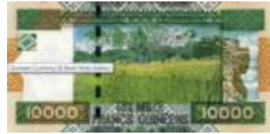
Fotoğraf 20. Kuzey Gine'de uzun boylu otlar ve ağaçlardan oluşan savanlardan bir görünüm (10000 Gine Frangı)