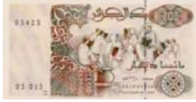
Fotoğraf 123. Cezayir Banknotunda Kuran Kursu (200 Cezayir Dinarı)