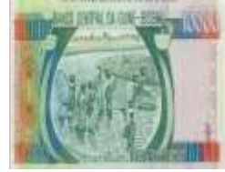
Fotoğraf 86. Gine Bissau Banknotunda Kadınlar Geleneksel Yöntemlerle Balık Avlarken (10000 Pese)