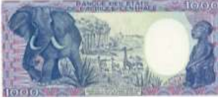
Fotoğraf 17. Orta Afrika Cumhuriyeti Banknotunda savan sahası ve bu sahada fil, zürafa ve diğer savan hayvanları (1000 CFA Frangı)