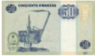
Fotoğraf 100. Angola Banknotunda Deniz Aşırı Petrol Platformu (50 Kwanza)