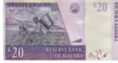
Fotoğraf 65. Malawi Banknotunda Çay Yaprağı Toplayan İşçiler (20 Kivaça)

Liberya banknotlarında kauçuk (Fotoğraf 59), Gana (Fotoğraf 60) ve Ekvatorial Gine banknotlarında kakao, Seyşel Adaları'nın banknotlarında Hindistan cevizi (Fotoğraf 61), Senegal ve Sudan banknotlarında yer fıstığı görüntülerine yer verilmiştir. Bu ülkelerin ihracat gelirlerinde bahsi geçen ürünler önemli bir yere sahiptir (Dünya Atlası, 2011).