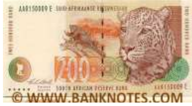
Fotoğraf 36. Güney Afrika Cumhuriyeti Banknotunda Leopar Görünümü (200 Rand)