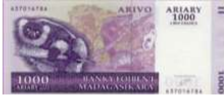
Fotoğraf 46. Madagaskar'a Ait Banknota Ülkede Yaşayan Maymunlardan Görünüm (1000 Ariari)