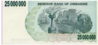
Fotoğraf 50. Zimbabwe'nin Başkenti Harare'den Bir Görünüm (25 Milyon Zimbabwe Doları)