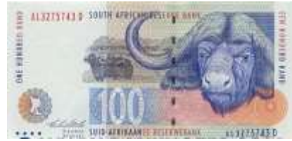
Fotoğraf 39. Güney Afrika Cumhuriyeti Banknotunda Buffalolardan Görünüm (100 Rand)