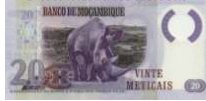
Fotoğraf 37. Mozambik Banknotunda Savan Sahasındaki Bir Gergedandan Görünüm (20 Metical)