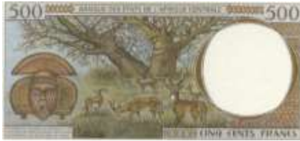
Fotoğraf 24. Kamerun Banknotunda Antiloplar, Baobap Ağacı (500 CFA Frangı)

Savanlarda kuraklığa uyum sağlamış baobap ağaçları yaygındır (Köksal, 1999, 50). Kamerun (Fotoğraf 24), Çad, Kongo, Ekvatorial Gine, Gabon, Madagaskar (Fotoğraf 25), Orta Afrika Cumhuriyeti ve Zambiya paralarında savanların tipik ağaçlarından baobap ağacı görüntüsüne yer verilmiştir. Yeşil Burun Adaları'nın paralarında Dragon ağacına ve Zambiya paralarında Akasya ağacına ilişkin görünüm mevcuttur. Sudan ve Uganda banknotlarında bambu bitkisinin görünümüne, Seyşeller, Güney Afrika Cumhuriyeti, Lesotho, Zambiya, Madagaskar, Mauritius ülkelerinin banknotlarında çiçek görüntülerine yer verilmiştir.