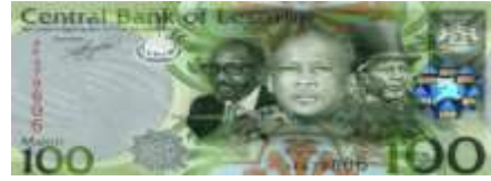
Fotoğraf 130. Lesotho'nun 3 Kral (100 Loti)