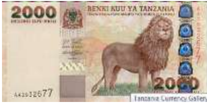
Fotoğraf 1. Önde Savan Sahasında Bir Afrika Aslanı, Arkada Kilimanjaro Dağı Zirvesi (2000 Tanzania Şilini)

Komor ve Madagaskar ada ülkelerinin banknotlarında plajlara (Fotoğraf 7) yer verilmiştir.