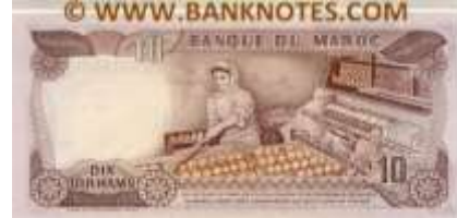
Fotoğraf 71. Fas Banknotunda Portakal İşleme Tesisleri (10 Fas Dirhemi)