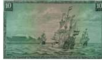
Fotoğraf 2. Cape Town'da Arkada Masa Dağı, Önde Atlas Okyanusu'nda Yelkenli Gemiler (10 Rand)