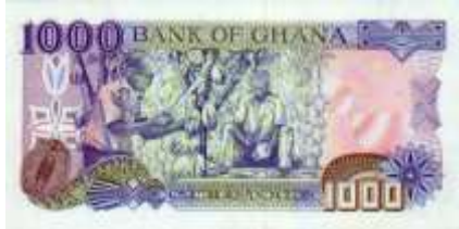
Fotoğraf 60. Gana Banknotunda Kakao hasadı (1000 Cedi ya da Yeni Sedi)