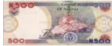
Fotoğraf 101. Nijerya Banknotunda Deniz Aşırı Petrol Platformu (500 Naira)