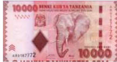
Fotoğraf 29. Tanzanya Banknotunda Bir Filin Başı (10000 Tanzanya Şilini)