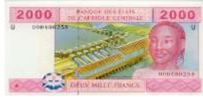
Fotoğraf 95. Kamerun Banknotunda Baraj ve Santral (2000 CFA Frangı)

Bazı Afrika ülkelerinin ekonomisinde petrol önemli bir yere sahiptir. Afrika'nın önemli petrol üreticisi ülkeleri arasında olan Angola (Fotoğraf 100), Nijerya (Fotoğraf 101) ve Libya banknotlarında petrol platformlarının ve rafinerilerinin görüntülerine yer verilmiştir. Angola'nın ihracatında petrolün payı %90 (Özey, 2009), Nijerya'nın %95'dir (Atalay, 2007). Libya'nın en önemli gelir kaynağını petrol oluşturmaktadır.