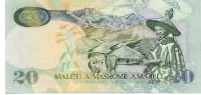
Fotoğraf 77. Lesotho Banknotunda Erkek Çoban ve Sığırlar (20 Loti)