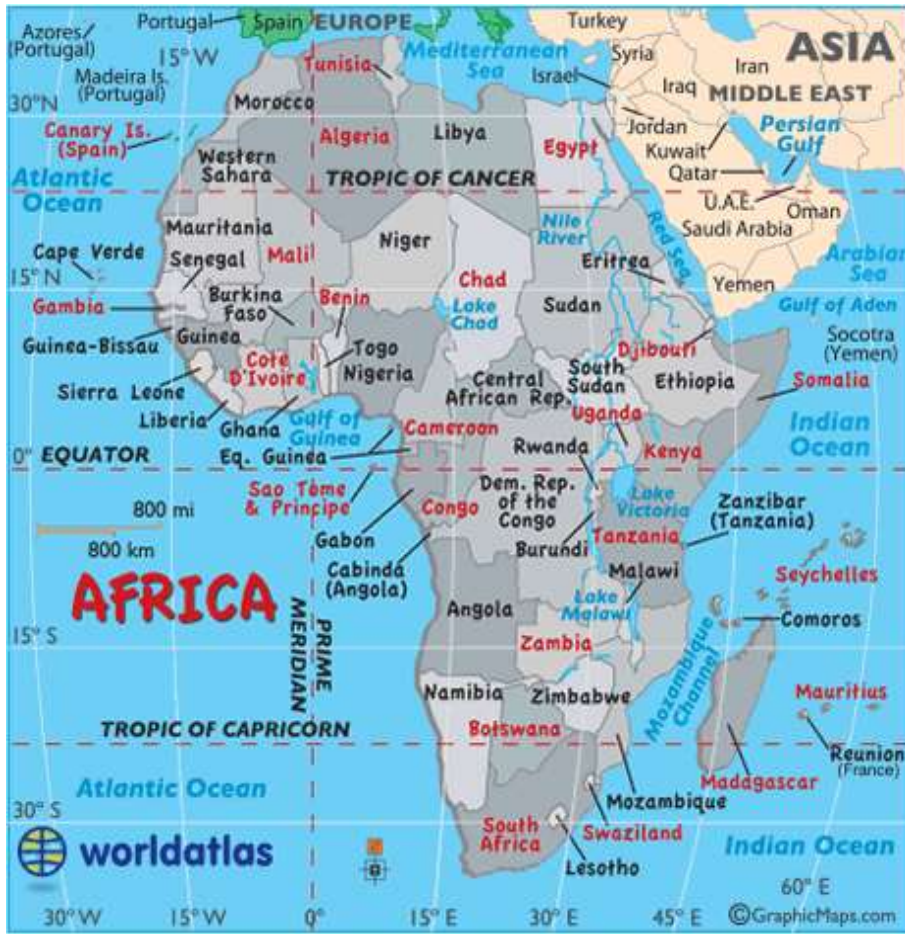
Şekil 1: Afrika Kıtasındaki Ülkeler

Para insanoğlunun yaşamının vazgeçilmez unsurlarından biridir. Her ülke sınırları dâhilinde halkının kullanması maksadıyla para basarak, piyasaya sürer. Paraların üzerinde değerini ifade eden rakamlar ile bazı resim ve görüntüler yer alır.