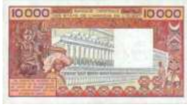
Fotoğraf 104. Burkina Faso Banknotunda Tekstil Fabrikasından Görünüm (10000 CFA Frangı)