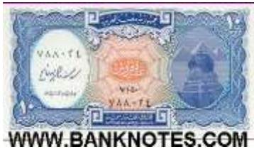
Fotoğraf 115. Mısır Banknotunda Giza'da Büyük Sfenks ve Piramitler (10 Mısır Paundu)