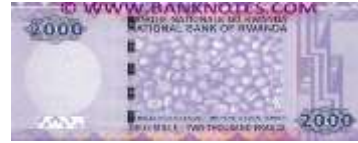
Fotoğraf 58. Ruanda Banknotunda kahve çekirdekleri yığını (2000 Ruanda Fransı)