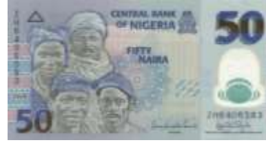
Fotoğraf 126. NijeryaHausa, İbo,Yoruba ve Fulani Halklarını Temsilen İnsan Portreleri (50 Naira)