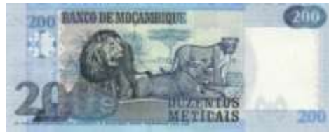
Fotoğraf 34. Mozambik Banknotunda erkek ve dişi aslanlar (200 Metical)

Komor (Fotoğraf 41), Madagaskar, Sao Tome ve Principe ve Seyşeller'in (Fotoğraf 42) paralarında kaplumbağalara yer verilmiştir.