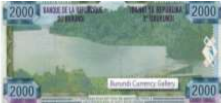
Fotoğraf 8. Burundi Banknotunda Tanganika Gölü (2000 Burundi Fransı)

Bazı Afrika ülkelerinin paralarında hidrografik unsurlardan göl, şelale ve nehir görüntülerine yer verilmiştir. Doğu Afrika'da göller bölgesinde arazileri olan ülkelerin kâğıt paralarında göl görünümlerine yer verilmiştir.