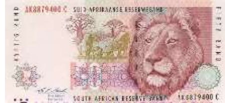
Fotoğraf 33. Güney Afrika Cumhuriyeti Banknotunda Bir Aslan Başı Görünümü (50 Rand)

Komor (Fotoğraf 41), Madagaskar, Sao Tome ve Principe ve Seyşeller'in (Fotoğraf 42) paralarında kaplumbağalara yer verilmiştir.