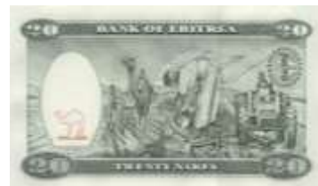
Fotoğraf 73. Eritre Banknotunda Deve ve Traktör ile Tarla Sürme (20 Nakfa)