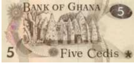
Fotoğraf 113. Gana Banknotunda Tarihi Larabanga Cami (5 Yeni Sedi)

Fas banknotlarında; Muhammed V anıt kabrine, Tanca'da Ulu Camiye, Fas kentinde Kairaouine Camisine ve tarihi kalelere ilişkin görüntülere yer verilmiştir.