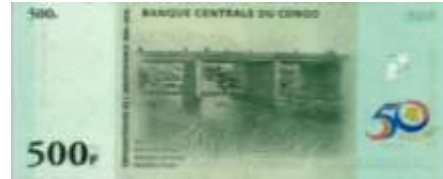
Fotoğraf 111. Demokratik Kongo Cumhuriyeti Banknotunda Kongo Nehri Üzerinde Köprü (500 Kongo Fransı)