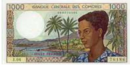
Fotoğraf 22. Komor Banknotunda palmye ağaçları (1000 Komor Frangı)