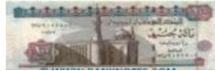
Fotoğraf 118. Mısır Banknotunda Kahire'de Sultan Hasan Cami (100 Mısır Paundu)