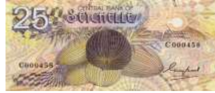
Fotoğraf 61. Tropikal Seyşel Adaları'nın Banknotunda Hindistan Cevizlerinden Görünüm (25 Seyşel Rupisi)

Angola, Burundi, Kamerun, Orta Afrika Cumhuriyeti (Fotoğraf 56), Çad, Demokratik Kongo Cumhuriyeti, Kenya, Kongo Cumhuriyeti, Ekvatorial Gine (Fotoğraf 57), Etiyopya, Gine, Ruanda (Fotoğraf 58), Mauritius, Tanzanya ve Uganda banknotlarında kahve plantasyonlarına, kahve bitkisine ve kahve hasadına ilişkin görüntülere yer verilmiştir. Angola, Orta Afrika Cumhuriyeti, Demokratik Kongo Cumhuriyeti, Kongo Cumhuriyeti, Etiyopya, Gine, Ruanda, Tanzanya ve Uganda ülkelerinin ihraç ettiği en önemli tarım ürünleri arasında kahve yer almaktadır (Dünya Atlası, 2011).