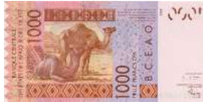
Fotoğraf 81. Fildişi Kıyısı'nın Banknotunda Sahel Bölgesi'ndeki Develeri (1000 CFA Fransı)