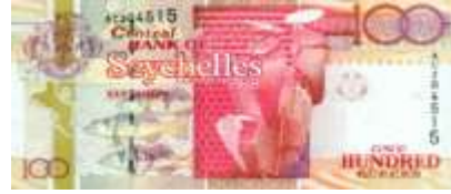
Fotoğraf 47. Seyşel Adalarının Banknotunda Balık, Deniz Kaplumbağası ve Deniz Kabukları (100 Seyşel Rupisi)

Botswana, Gambiya, Etiyopya, Fildişi Kıyısı, Liberya, Sao Tome ve Principe, Senegal, Seyşeller (Fotoğraf 47), Sierra Leone, Sudan, Swaziland ve Zambiya paralarında kuş, Komor, Gambiya, Fildişi Kıyısı, Senegal ve Seyşeller'in paralarında balık görüntülerine yer verilmiştir.