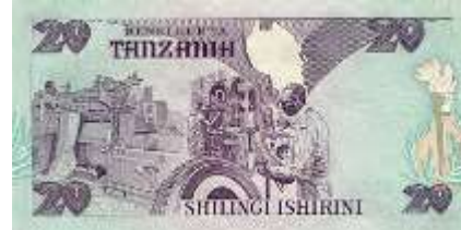
Fotoğraf 107. Tanzania Banknotunda Lastik Fabrikası Görünümü (20 Tanzania Şilini)