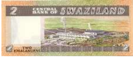
Fotoğraf 106. Swaziland Banknotunda Şeker Fabrikası Görünümü (2 Lilangeni)