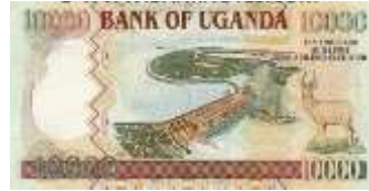
Fotoğraf 99. Uganda Banknotunda Kiira (Kiyira) Hidroelektrik Barajı ve Santrali (10000 Uganda Şilini)