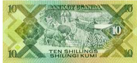
Fotoğraf 79. Uganda Banknotunda Sığır, Bambu ve Muz (10 Uganda Şilini)