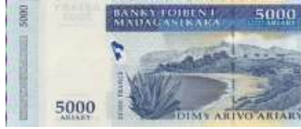
Fotoğraf 7. Madagaskar'da Hint Okyanusu Kıyısındaki Plajlardan Birinden Görünüm (5000 Ariari)