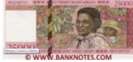
Fotoğraf 55. Madagaskar Banknotunda Sırtında çocuk ile bir Madagaskarlı kadını portresi ve Çeşitli Tropikal Meyvelerden Görünüm (25000 Ariari)