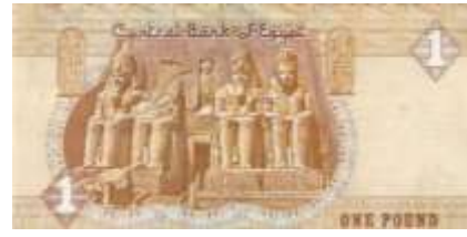
Fotoğraf 116. Mısır Banknotunda Ebu Simbel Tapınağından Görünüm (1 Mısır Paundu)