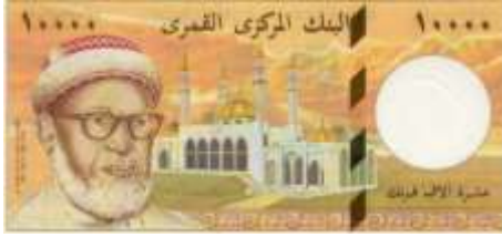
Fotoğraf 125. Komor Adaları Banknotunda Cami Görünümü (10000 Komor Frangı)