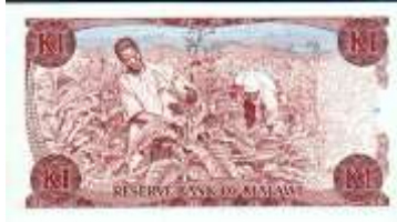
Fotoğraf 70. Malawi Banknotunda Tütün Tarlaları ve İşçiler (1 Kivaça)

Malavi parasında tütüne (Fotoğraf 70), Fas parasında Akdeniz İklimi koşullarında yetiştirilen portakalın işlendiği tesislere (Fotoğraf 71) yer verilmiştir.