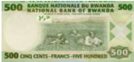
Fotoğraf 66. Ruanda Banknotunda Plantasyonda Çay Yaprağı Toplayan Tarım İşçileri (500 Ruanda Frangı)

Ekvatorial Gine, Fildişi Kıyısı, Gine (Fotoğraf 67), Madagaskar, Ruanda, Sao Tome ve Principe, Senegal, Somali ve Uganda (Fotoğraf 79) banknotlarında muz bahçelerine ve muz hasadına yer verilmiştir. Muz, Fildişi Kıyısı ve Somali'nin önemli ihraç ürünleri arasında yer almaktadır.