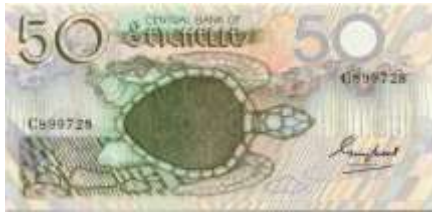
Fotoğraf 42. Seyşeller'in Banknotunda Kaplumbağa Görünümü (50 Seyşel Rupisi)