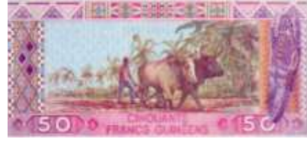
Fotoğraf 74. Gine Banknotunda Hayvan Gücü ile Tarla Sürme (50 Gine Fransı)

Afrika Kıtası'nda tarım faaliyeti genellikle geleneksel yöntemlerle yürütülmektedir. Bu özellik ülke paralarında tarıma ilişkin görüntüleri etkilemiştir. Liberya, Eritre (Fotoğraf 72-73), Gine (Fotoğraf 74) paralarında hayvan gücü ile tarla sürme görüntüleri yer almaktadır. Tarımla ilgili görüntüler içeren paralarda genellikle tarım işçilerinin görüntülerine (Fotoğraf 75) yer verilmiştir. Komor, Liberya, Mauritius paralarında pazaryeri manzarası, Burundi ve Moritanya paralarında hasat manzarası yer almaktadır.