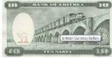
Fotoğraf 112. Eritre Banknotunda Dogali Nehri Üzerinde Köprü (10 Nakfa)