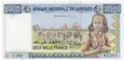
Fotoğraf 80. Cibuti Banknotunda Deve Kervanı (2000 Cibuti Fransı)