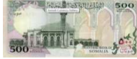
Fotoğraf 124. Somali Banknotunda Başkentte Bir Cami (500 Somali Şilini)