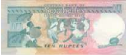
Fotoğraf 127. Seyşeller Banknotunda Yerel Dans Yapan Topluluktan Görünüm (10 Şeyssel Rupisi)