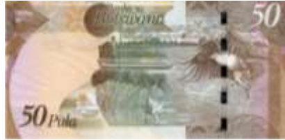
Fotoğraf 14. Botswana Banknotunda Okowango Deltası ve Bataklıklar (50 Pula)

Uganda banknotlarında Afrika'nın en büyük gölü Victorya Gölü ve Bunyonyi Gölü'ne, Burundi banknotlarında Tanganika Gölü'ne (Fotoğraf 8), Malavi banknotlarında Nyassa (Malavi) Gölü'ne (Fotoğraf 9), Ruanda banknotlarında Kivu Gölü'ne (Fotoğraf 10) yer verilmiştir. Bazı Afrika ülkelerinin (Cezayir, Orta Afrika Cumhuriyeti, Demokratik Kongo Cumhuriyeti, Etiyopya, Lesotho, Mauritius, Uganda, Swaziland, Sao Tome ve Principe) banknotlarında nehirler üzerindeki şelaleler gösterilmiştir. Afrika'da, Zambezi Nehri üzerinde, Zambiya ve Zimbabwe sınırlarının birleştiği noktada turistik öneme sahip ünlü Victorya Şelalesi yer almaktadır. Zambiya ve Zimbabwe ülkelerinin banknotlarında Viktorya Şelalesi gösterilmiştir (Fotoğraf 11-12). Sudan banknotlarında ülkeye hayat veren Nil Nehri yer almaktadır (Fotoğraf 13). Botswana banknotlarında Okowango Nehri'nin oluşturduğu delta ve bataklıklara ilişkin görünüm (Fotoğraf 14) yer almaktadır.