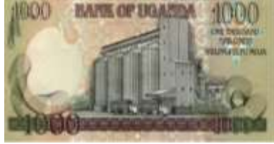
Fotoğraf 68. Uganda Banknotunda Buğday Silosu (1000 Uganda Şilini)