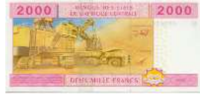
Fotoğraf 93. Kamerun Banknotunda Açık Maden Ocağı İşletmesi (2000 CFA Frangı)