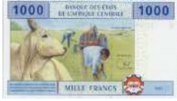
Fotoğraf 75. Kamerun Banknotunda Tarlada Çalışan İşçiler (1000 CFA Fransı)