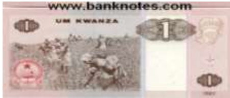
Fotoğraf 62. Angola Banknotunda Pamuk Tarlası ve Pamuk İşçileri (1 Kwanza)

Angola, Burundi, Kamerun, Orta Afrika Cumhuriyeti (Fotoğraf 56), Çad, Demokratik Kongo Cumhuriyeti, Kenya, Kongo Cumhuriyeti, Ekvatorial Gine (Fotoğraf 57), Etiyopya, Gine, Ruanda (Fotoğraf 58), Mauritius, Tanzanya ve Uganda banknotlarında kahve plantasyonlarına, kahve bitkisine ve kahve hasadına ilişkin görüntülere yer verilmiştir. Angola, Orta Afrika Cumhuriyeti, Demokratik Kongo Cumhuriyeti, Kongo Cumhuriyeti, Etiyopya, Gine, Ruanda, Tanzanya ve Uganda ülkelerinin ihraç ettiği en önemli tarım ürünleri arasında kahve yer almaktadır (Dünya Atlası, 2011).