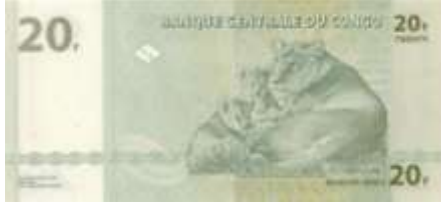
Fotoğraf 32. Demokratik Kongo Cumhuriyeti Banknotunda Kundelungu Ulusal Parkındaki Aslan ve Yavruları (20 Kongo Frangı)

Demokratik Kongo Cumhuriyeti (Fotoğraf 32), Etiyopya, Güney Afrika Cumhuriyeti (Fotoğraf 33), Kenya, Mozambik (Fotoğraf 34), Sierra Leone, Tanzania (Fotoğraf 1), Zambiya banknotlarında aslan ya da aslanlara ait görüntülere yer verilmiştir. Burundi, Cezayir ve Uganda banknotlarında; su aygırı, Ruanda banknotunda; ceylan (Fotoğraf 35), Güney Afrika Cumhuriyeti (Fotoğraf 36) ve Zambiya banknotlarında; leopar, Angola, Demokratik Kongo Cumhuriyeti, Mozambik (Fotoğraf 37), Güney Afrika Cumhuriyeti, Tanzania (Fotoğraf 38) banknotlarında gergedan, Güney Afrika Cumhuriyeti (Fotoğraf 39), Mozambik, Somali (Fotoğraf 40), Tanzania, Zambiya ve Zimbabve banknotlarında buffalo görüntülerine yer verilmiştir.