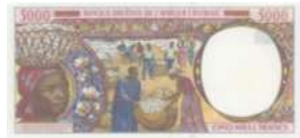
Fotoğraf 63. Kamerun Banknotunda pamuk toplayan mevsimlik işçiler ve başının üzerinde sepette pamuk taşıyan Kamerunlu Kadın (5000 CFA Frangı)