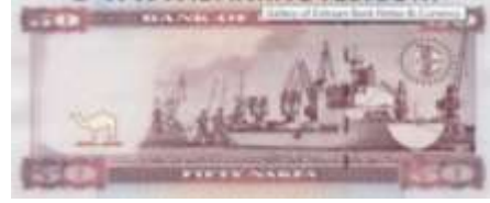
Fotoğraf 109. Eritre Banknotunda Massawa Limanında Gemiler (50 Nakfa)