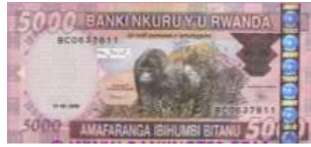
Fotoğraf 43. Ruanda Volcano Milli Parkı'nda Yaşayan Dağ Gorillerinden Görünüm (5000 Ruanda Frangı)