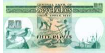
Fotoğraf 90. Seyşeller Banknotunda Gemiler, Kuşlar ve Balıkçılık (50 Seyşel Rupisi)