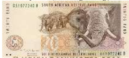
Fotoğraf 28. Güney Afrika Cumhuriyeti Banknotunda Filler (20 Rand)