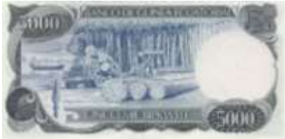
Fotoğraf 15. Ekvatorial Gine Banknotunda Orman, tomruklar, orman ürünleri temini (5000 CFA Frangı)

Afrika Kıtası'nda Ekvatordan kuzeye ve güneye doğru uzaklaştıkça yağmur miktarının azalmasına bağlı olarak bitki örtüsü seyrekleşir. Kıtanın büyük bir bölümünü kaplayan savanlar ve bozkırlar şeklindeki daha açık arazilere ulaşılır (Özey, 2009; 33). Savan, taçları düz şemsiye şeklinde dikenli ağaçlar ve uzun boylu otlardan oluşur (Atalay, 2007, 254). Afrika savanları dünyada başka bir benzeri olmayan olağanüstü doğa ve eşsiz canlılar topluluğunu barındırmaktadır. Savanların geniş yer kapladığı Orta Afrika Cumhuriyeti (Fotoğraf 17), Tanzania, Mozambik (Fotoğraf 18), Malawi (Fotoğraf 19), Senegal, Gine (Fotoğraf 20) ülkeleri ile savanların kısmen yayılım gösterdiği Demokratik Kongo Cumhuriyeti (Fotoğraf 21), Togo ve Fildişi ülkelerinin paralarında savan görüntülerine yer verdikleri tespit edilmiştir.