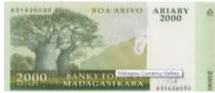
Fotoğraf 25. Madagaskar Banknotunda Güney Madagaskar'daki Baobaplar (2000 Ariari)

Afrika savanı, Dünyanın en zengin ve en görkemli büyük memeli türleri topluluğunu barındırmaktadır. Savanlar yaban hayatı yönünden çok zengindir. Savanlarda antilop, fil, zebra, zürafa, buffalo, su aygırı, aslan, leopar, gergedan ve diğer omurgalı yaban hayvanları yaşar. Bazı Afrika ülkelerinin paralarında, tek bir yaban hayvanı görünümüne ya da aynı ya da farklı türden yaban hayvan sürülerinin görünümüne yer verilmiştir.