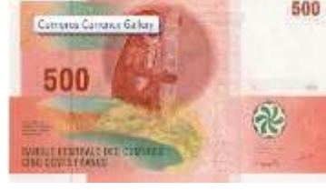
Fotoğraf 45. Komor Adalarına Ait Banknota Lemur Maymunu (500 Komor Frangı)