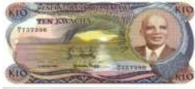
Fotoğraf 87. Kara Devleti Olan Malawi Banknotunda Nyassa Gölü'nde Balıkçı Teknesi ve Balıkçılar (10 Kivaça)