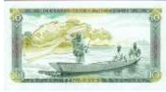
Fotoğraf 84. Gambiya Banknotunda Balıkçı Teknesi ve Balıkçılar (10 Dalasi)