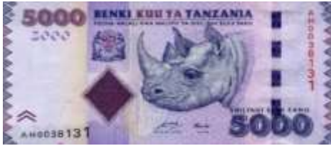
Fotoğraf 38. Tanzanya Banknotunda Bir Gergedan Başı (5000 Tanzanya Şilini)