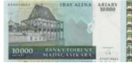
Fotoğraf 114. Madagaskar Banknotunda Antananarivo'daki Tarihi Saray Binası (10000 Ariari)