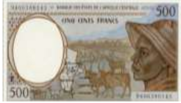
Fotoğraf 76. Kamerun Banknotunda Keçi ve Sığır Sürüsü ve Bir Çoban (500 CFA Fransı)