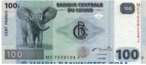
Fotoğraf 26. Demokratik Kongo Cumhuriyeti Banknotunda Virunga Milli Parkında yaşayan bir fil türü (100 Kongo Fransı)

Namibya, Ruanda, Senegal, Uganda, Kamerun (Fotoğraf 24), Malavi, Orta Afrika Cumhuriyeti banknotlarında antilop görüntüsüne yer verilmiştir.