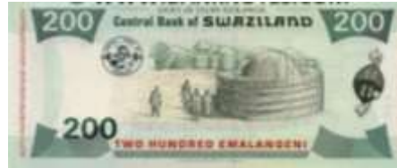
Fotoğraf 53. Swaziland Banknotunda Yapı Malzemesini Genellikle Sazların Oluşturduğu Meskenler (200 Lilangeni)