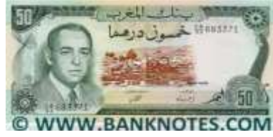
Fotoğraf 49. Marakeş Şehrinden Bir Görünüm ve Fas Kralı II. Hassan'ın Portresi (50 Fas Dirhemi)