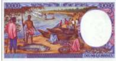
Fotoğraf 89. Orta Afrika Cumhuriyeti Parasında Akarsu Kenarında Balıkçılar, Tekneler ve Avlanan Balıklar (10000 CFA Frangı)