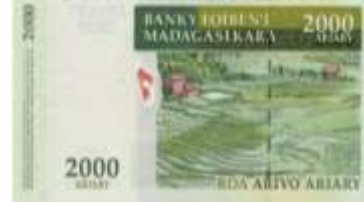
Fotoğraf 69. Madagaskar Banknotunda Pirinç Terasları (2000 Ariari)

Bazı Afrika ülkelerinin paralarında tahıllara yer verilmiştir. Cezayir, Gine-Bissau, Libya, Uganda ve Zimbabve banknotlarında buğday bitkisi, buğday hasadı, buğday başakları, buğday siloları (Fotoğraf 68) gibi görüntüler yer almaktadır. Fildişi Kıyısı, Liberya, Madagaskar ve Senegal'in kâğıt paralarında pirinç tarlaları ve teraslarından (Fotoğraf 69) görüntülere yer verilmiştir.