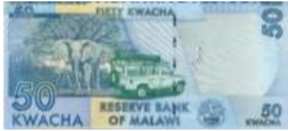
Fotoğraf 19. Malawi'de Kasungu Milli Parkı'nda filler ve safari cipi (50 Kivaça)