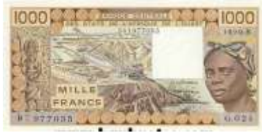
Fotoğraf 92. Benin Banknotunda Açık Maden Ocağı İşletmesi (1000 CFA Frangı)

Demokratik Kongo Cumhuriyeti banknotunda Kongo Nehri üzerindeki Inga II Hidroelektrik Santrali ve yüksek gerilim enerji nakil hatları (Fotoğraf 98), Gana banknotunda Akosombo Barajı, Malavi banknotunda Zomba Platosu'nda Mulunguzi Barajı, Fas banknotunda Mohamed V Hidroelektrik Barajı, Sierra Leone banknotunda Bumbuna Barajı, Swaziland banknotunda Lumphohlo'da hidroelektrik santrali, Uganda banknotunda Kiira (Kiyira) Hidroelektrik Santrali (Fotoğraf 99), Zimbabwe banknotunda Zambezi Nehri üzerindeki Kariba Barajı görüntüsüne yer verilmiştir.