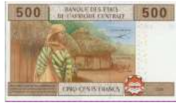
Fotoğraf 51. Kamerun ve Kongo Paralarında Kırsal Meskenlerden Görünüm (500 CFA Frangı)