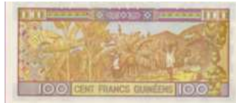
Fotoğraf 67. Gine Banknotunda Muz Bahçeleri ve Muz Hasadı (100 Gine Frangı)