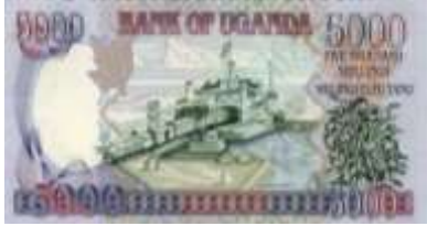
Fotoğraf 108. Uganda Banknotunda Viktorya Gölü'nde Bir Feribot (5000 Uganda Şilini)

Kamerun, Kenya, Orta Afrika Cumhuriyeti ve Yeşil Burun Adaları paralarında havaalanı ve uçak görüntüleri bulunmaktadır.