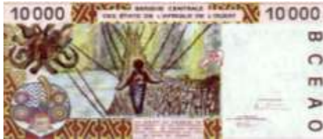
Fotoğraf 110. Benin Banknotunda Asma Köprü Görüntüsü (10000 CFA Fransı)