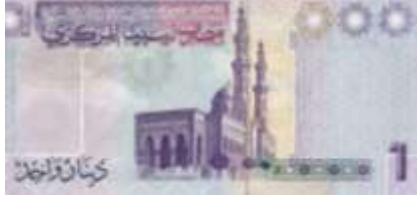
Fotoğraf 121. Libya Banknotunda Batı Trablus'ta Muhammed Camisi (1 Libya Dinarı)