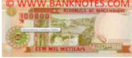
Fotoğraf 96. Mozambik Banknotunda Zambezi Nehri Üzerinde Hidroelektrik Barajı ve Santrali (100000 Metical)