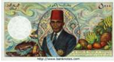
Fotoğraf 54. Komor Banknotunda Tropikal Meyvelerden Görünüm (5000 Komor Fransı)

20 kuzey ve 20 güney paralelleri arasında arazileri olan Kamerun, Çad, Komor (Fotoğraf 54), Ekvatorial Gine, Gabon, Togo, Mali, Madagaskar (Fotoğraf 55), Orta Afrika Cumhuriyeti, Kongo Cumhuriyeti ve Uganda'nın banknotlarında tropikal meyvelere ilişkin görsellere yer verilmiştir.