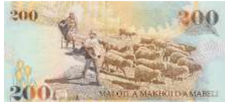
Fotoğraf 83. Lesotho Banknotunda Koyun Sürüsü ve Çobanlar (200 Loti)