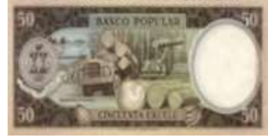
Fotoğraf 103. Ekvatorial Gine Banknotunda Orman Ürünleri Endüstrisine Yönelik Faaliyetlerden Görünüm (50 CFA Frangı)