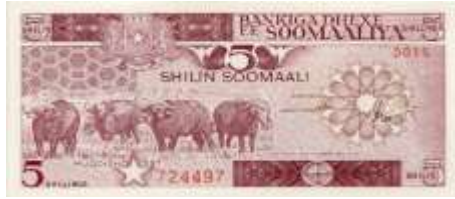
Fotoğraf 40. Somali Banknotunda Buffalo Sürüsünden Görünüm (5 Somali Şilini)