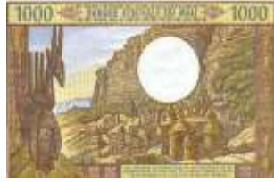
Fotoğraf 48. Mali Banknotunda Bir Köyden görünüm (1000 CFA Frangı)

ve Zimbabwe (Fotoğraf 50) paralarında şehir görüntüleri yer almaktadır. Kamerun, Kongo (Fotoğraf 51), Komor Adaları, Gine (Fotoğraf 52), Lesotho, Moritanya, Seyşeller, Sudan ve Swaziland (Fotoğraf 53) paralarında yakın çevreden temin edilen ahşap, saz ve kamış gibi malzemelerle yapılan kır meskenlerine yer verilmiştir.