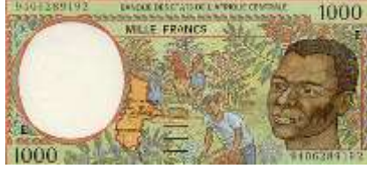
Fotoğraf 56. Kamerun ve Orta Afrika Cumhuriyeti Banknotlarında Kahve Bahçeleri ve Kahve Hasadı (1000 CFA Frangı)