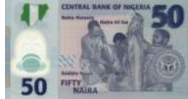
Fotoğraf 88. Nijerya Banknotunda Büyük Bir Balık Avlamış Olan Yerel Balıkçılar (50 Naira)