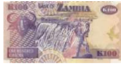
Fotoğraf 11. Zambiya Banknotunda Zambezi Nehrinde Victoria şelalesi (100 Kivaça)