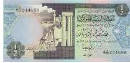
Fotoğraf 105. Libya Banknotunda Petrol Rafinerisi (1/2 Libya Dinarı)