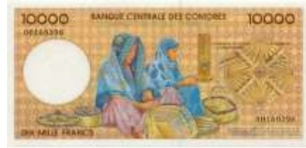
Fotoğraf 128. Komor Adaları Banknotunda Yerel Kıyafetleri ile Sepet Ören Kadınlar (10000 Komor Frangı)

Sahra Güneyi Afrika'sı, çok değişik kültürel özelliklere sahiptir. Yüzlerce farklı etnik grup bulunmaktadır. Her toplumun farklı dili, âdeti, inanç ve davranışları vardır. Birkaç yüz nüfuslu etnik grupların yanında milyonlarca nüfusa sahip etnik gruplar mevcuttur. Nijerya'nın banknotunda ülkedeki en önemli etnik grupları (Yoruba, Hausa, İbo, Fulani) temsilen insan portrelerine (Fotoğraf 126) yer verilmiştir. Bazı Afrika ülkelerinin banknotlarında yerel halklardan çocuk, yetişkin, yaşlı erkek ve kadın portrelerine (Fotoğraf 4, 22, 51, 55, 76, 80, 92, 125, 126) yer verilmiştir. Seyşeller'in banknotunda yerel danslar yapan bir topluluğun görüntüsü yer almaktadır (Fotoğraf 127).