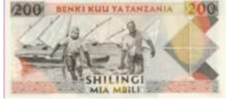
Fotoğraf 91. Tanzania Banknotunda Hint Okyanusu'nda Büyük Bir Balık Yakalamış Olan Balıkçılar ve Yelkenliler (200 Tanzania Şilini)