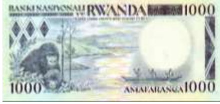
Fotoğraf 44. Ruanda'da Yaşayan Doğu Gorillerinden Görünüm (1000 Ruanda Frangı)

Ruanda paralarında Volcano Ulusal Parkı'ndaki dağ ve doğu gorilleri (Fotoğraf 43-44), Komor ve Madagaskar paralarında (Fotoğraf 45-46) maymunlar gösterilmiştir.