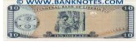
Fotoğraf 59. Liberya'da kauçuk hasadı (10 Liberya Doları)