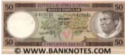
Fotoğraf 57. Ekvatorial Gine Banknotunda Kahve Bitkisinden Görünüm (50 CFA Fransı)