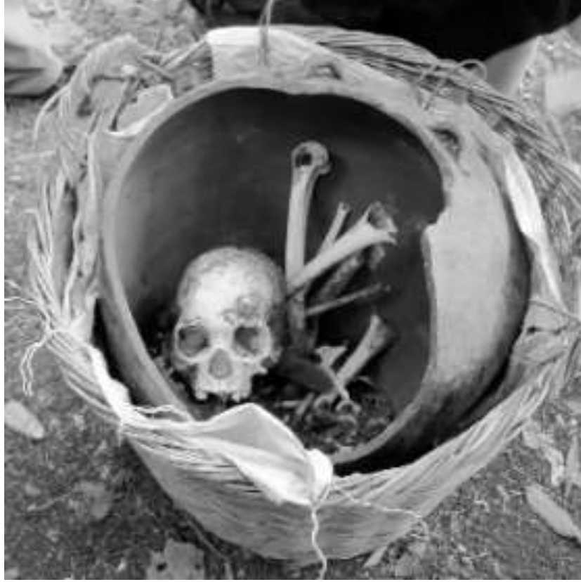
Şekil 15. Etlerinden sıyrılarak urna içerisine yerleştirilmiş cenaze.

konulabileceğini ortaya koymaktadır. Phnom Khnang Peung gömü alanında bulunan seramik urnaların çoğu ise deniz ticaretinde kullanılan seramik kaplardır (Carter ve Nancy, 2014: 9). Bölgede kullanılan seramik urna formlarının çok yönlü işlevlere sahip olduğu anlaşılmaktadır. Kamboçya'da, insanlar aileleri veya yakınlarına ait kemiklere erişim sağlamak ve onları muhafaza etmek amacıyla kalıntıları urna içinde saklar; bu kemiklerden bazıları ise urna içine konularak evlerin önündeki bir sunakta korunur (Bennet, 2015: 113). Kamboçya'nın cenaze geleneklerinde önemli bir rol oynayan ve ülkenin geçmişindeki dini ve sosyal pratikleri yansıtan seramik urna geleneği, saygı duyulan bir gelenek olarak sürdürülmektedir.