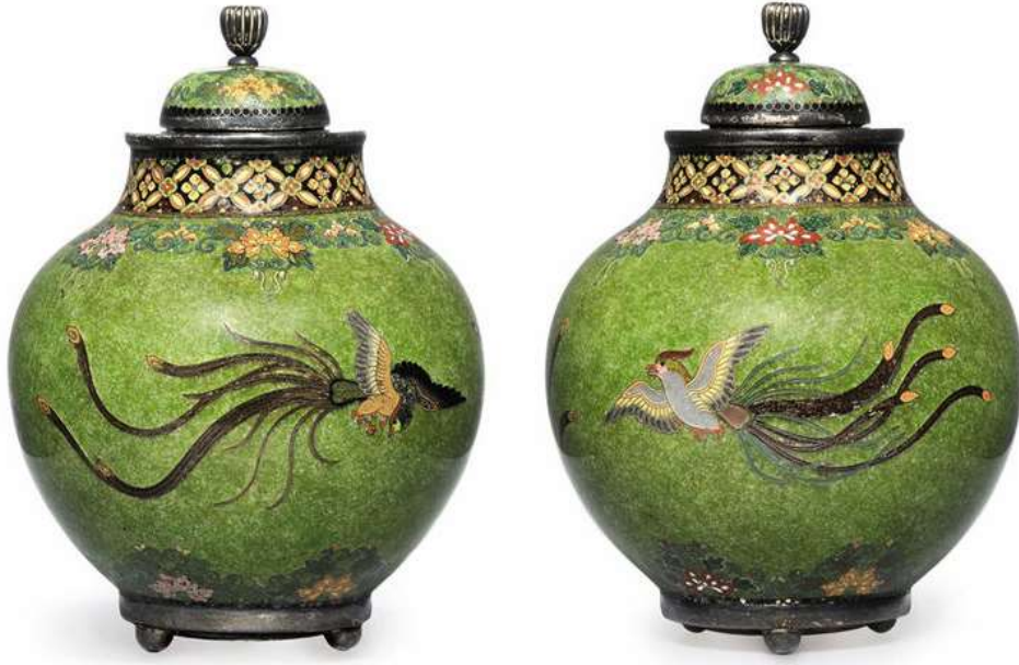
Şekil 7. Cloisonné tekniği, anka kuşu figürlü urnalar, Namikava Yasuyuki.