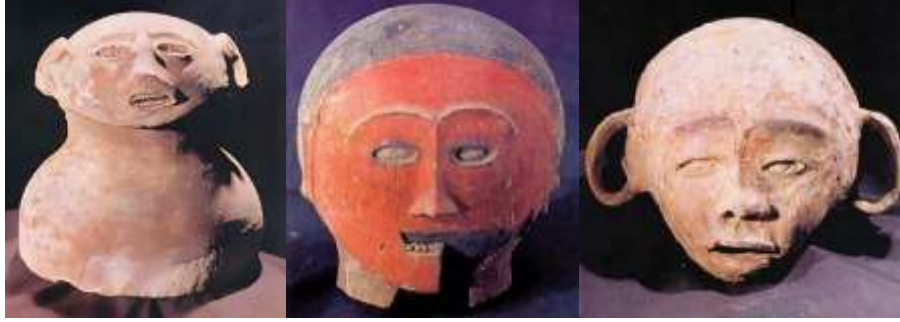
Şekil 12. Ayup Mağarası insan biçimli urna kapakları ve insan figürlü urnaları.

Kaynak: Tabarev, A.V. (2019). "Burials in Anthropomorphic Jars in the Philippines", Archaeology, Ethnology & Anthropology of Eurasia . 47(2), s. 43.