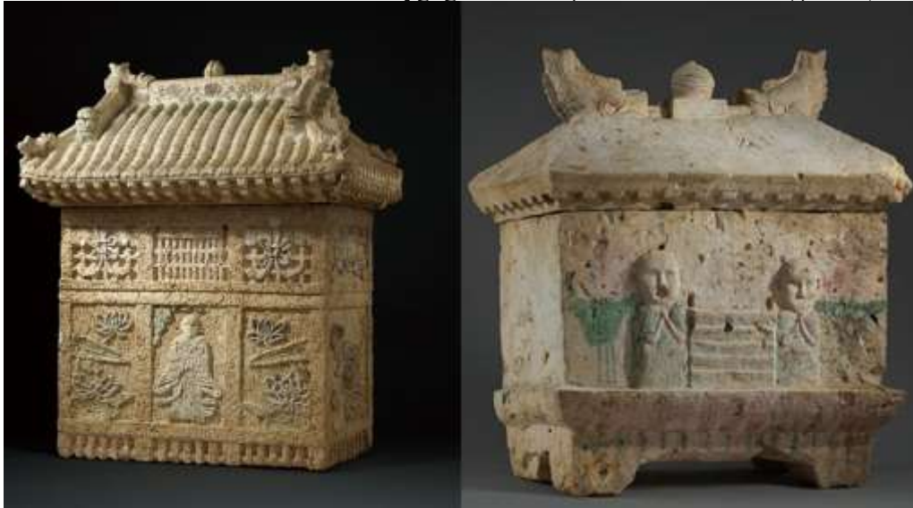
Şekil 5. Japonya seramik urna örnekleri.

Ölü yakma işlemi, yaklaşık 10 bin yıl öncesine dayanan prestijli bir uygulamadır ve ölen kişinin küllerinin rüzgâra, suya veya toprağa bırakılması gibi farklı yöntemlerle gerçekleştirildiği arkeolojik bulgularla kanıtlanmıştır (Picone, 2007: 139). Japonya'da Dōshō'nün yaşadığı dönemden önce kremasyon uygulandığına dair arkeolojik bulgular olsa da, Heian döneminin sonlarına gelindiğinde kremasyonun genellikle Budist inanç ve ritüelle sıkı bir şekilde bağlantılı olduğu, ancak gerçekleşen tüm kremasyonların Budist inançlarından kaynaklanmadığını belirtmek mümkündür (Bernstein, 2000: 300). Bernstein'in ifadesi, ölü yakma işleminin dinsel gereklilikten öte bir gelenek olduğunu göstermektedir. Japonya'da orta çağda başlayan Budist ayinlerle birlikte uygulanan ölü yakma geleneği, genel olarak Japonya'daki cenaze uygulamalarının en yaygını olarak bilinse de bazı bölgelerde, özellikle İbaraki gibi yerlerde ölülerin yakılması, toprağa gömme kadar yaygın değildir (Yiğiter, 2016: 57). Japon kültüründe ölü yakma geleneği, derin bir saygı ve anlam taşımaktadır. Bu geleneğin bir parçası olarak, ölülerin külleri seramik urnalarda korunarak anılarına saygı gösterilmektedir. Ölü yakma geleneğinin uygulandığı bölgelerde küller, ölen kişinin saf özü olarak kabul edilir. Bu nedenle, küllerin korunması önemlidir. Seramik urnalar, ölülerin küllerini muhafaza etmek ve onlara saygı göstermek için kullanılmaktadır (Şekil 5).