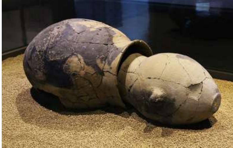
Şekil 10. İki parçalı yatay gömülmüş urna, Kore.