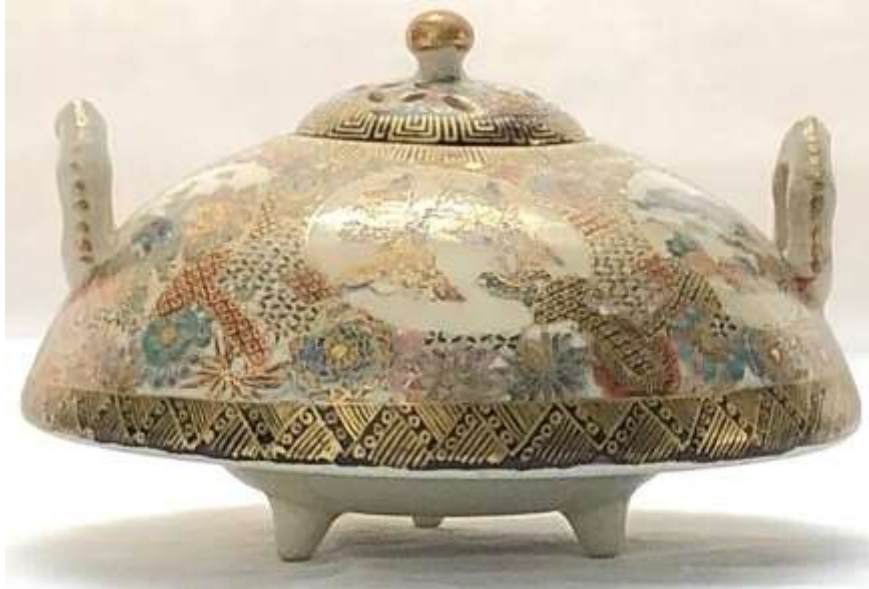
Şekil 6. 19. Yüzyıl Japon urna örneği, Satsuma Earthenware Koro.

eylemlerle gerçekleştirilir. Ölen kişinin bedeni yakıldıktan sonra, krematör tarafından ayaklardan başlanarak toplanan kalıntılar, aile için üzücü sayılabilecek kafatası kırma işleminin ardından, yas tutanlardan bir kişi tarafından ahşap veya bambu sopalarla urna içerisine yerleştirilir ve işlem, urnanın tahta bir kutuya konmasıyla tamamlanır (Picone, 2007: 137). Ölü yakma ve urna geleneği, Japonya'nın zengin kültürel mirasının önemli bir parçası olarak günümüze kadar devam etmiş ve geleneksel cenaze ritüellerinin anlamını yansıtmıştır. Japonya'da, ölü yakma işlemi ve küllerin saklanması geleneğiyle bağlantılı olarak seramik urnalar (Şekil 6), geçmişten günümüze değerli bir kültürel miras ve anma geleneği olarak varlığını sürdürmektedir.