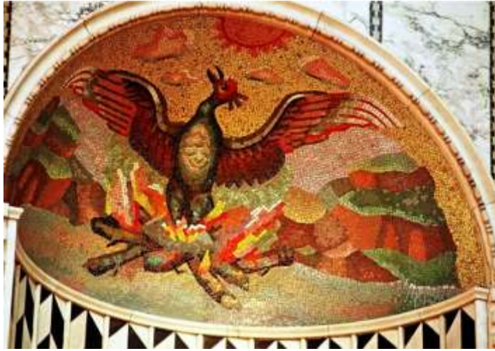
Şekil 1. Burning Nest'te bir anka kuşu: Londra Roma Katolik Katedrali apsis mozaik örneği, 20. yüzyıl.

motifler de diğer kullanılan figürler arasında yer almaktadır. Seramik urnaların biçimsel özellikleri ve üzerlerindeki sembolizm, ölen kişinin kültürü, hayatı ve inançları gibi çeşitli bilgileri içerebilir. Uzakdoğu'da ölüm sonrası küllerin saklanması için kullanılan seramik kaplara ait bazı örneklerin, araştırmalar sonucunda sosyoekonomik olarak üst düzeydeki kültürlerle ait olduğu anlaşılmaktadır.