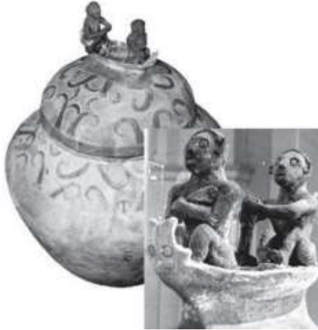
Şekil 13. Tabon Mağaralarından Manunggul mezar kavanozu.

Seramik urnalar, Filipinler'deki toplumların yaşam biçimi ve cenaze uygulamalarını yorumlamak için önemli bir kaynaktır. Seramik cenaze kapları, Filipinler'de ölüm sonrası inanç ve kültürel uygulamaların bir yansıması olarak önemli bir rol oynamakta ve farklı biçimlerde günümüze ulaşmaktadır.