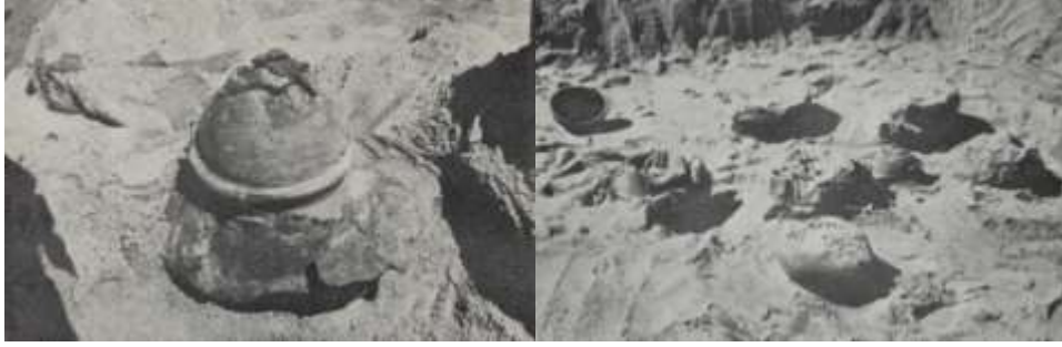
Şekil 11. Vietnam'da gömülmüş seramik urna örnekleri.

yapıldığı görülmektedir. Çocuk cenazelerinde, küller sığ ve büyük, kapağı olan seramik çömleklerin içine konur ve bu çömlekler mezarların içine ters çevrilerek gömülür (Coupey, 2006: 121). Urnalar genellikle dairesel biçimde şekillendirilmiş ve Burmalıların kullandığı şapkaları andıran kapaklarla tamamlanmıştır (Şekil 11). Janse (1959: 110), bu urnaların özelliklerini detaylı bir şekilde anlatmıştır. Güneydoğu Asya'da kullanılan urna örneklerinin benzer yapısal özelliklere sahip olması, kültürel etkileşimin varlığına işaret etmektedir.