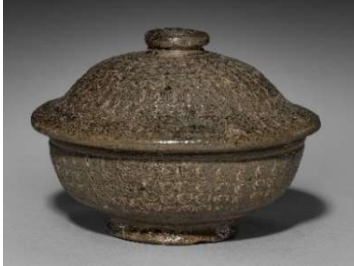
Şekil 9. Damgalı tasarımlı zeytin yeşili sırlı urna, Kore, Unified Silla Dönemi, (500-600 yılları).

Bir çukur açıldıktan sonra seramik kaplar farklı pozisyonlara göre (yatay, dikey, eğimli) hazırlanmış ve iki seramik kap ağızdan ağıza birleştirilerek (Şekil 10) yatay pozisyonda gömülmüşlerdir (Rhee vd., 2022: 29).