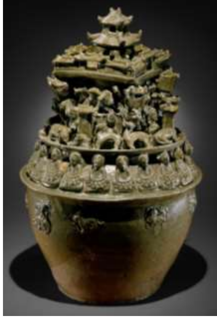
Şekil 3. Western Jin Dynasty (265–316), Çin urna, zeytin yeşili sırlı seramik.