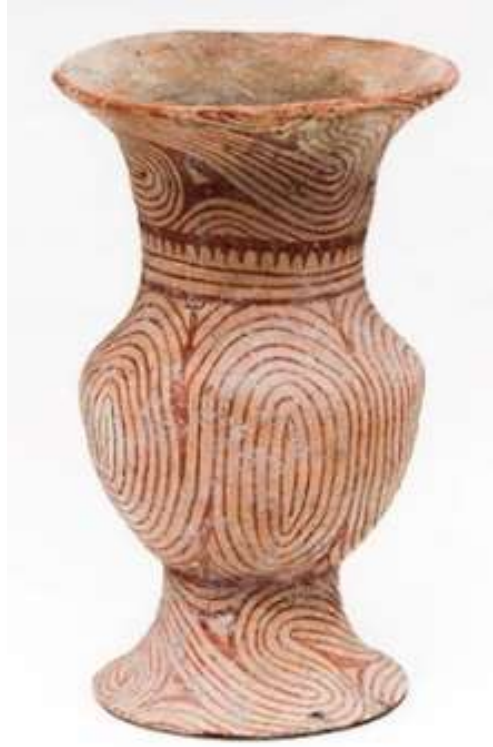
Şekil 14. Geç Dönem Ban Chiang urna örneği.