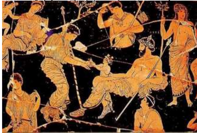
Şekil 2. Dionysos'un doğumu, İ.Ö. 5. ve 6. yy,

Kaynak: Kałużny, J. (2020). "Phoenix and Delphinus Salvator: The History of the Forgotten Images of Early Christian Iconography", Perspektywy Kultury . 30(3): 9-26. Sayfa: 16.