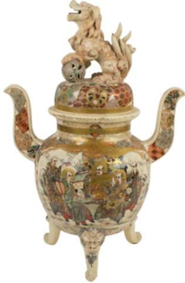
Şekil 8. Japon urna modeli, porselen.