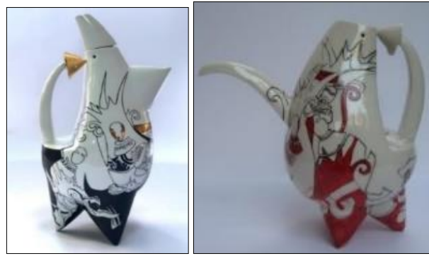
Görsel 17, 18: B. Ceren Değirmenci (Değirmenci, 2019, s. 52, 51)

Berfu Ceren Değirmenci, Anadolu söylenceleri arasında yer alan Şahmeran figürünü çağdaş bir dille seramik form ve yüzey üzerine yansıtmayı hedeflemektedir. Bu çalışmada, "Kadın ve yılan imgesinin vücut bulmuş hali diyebileceğimiz Şahmeran, kırılğan ve güçlü, zarif-güzel ve korkulan olarak anlatılan bir figür olarak en uygun malzeme... porselen seçilmiştir" (Değirmenci, 2019, s. 43). Form olarak ise çaydanlık tercih edilmiştir (Görsel 17, 18).