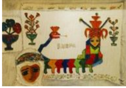
Görsel 2: Fikret Otyam (URL-8).

Ümit Aslan resimlerinde, geleneksel Şahmeran söylencesini yeniden yorumlamaktadır. Yılanlardan korunmak amacı ile yapılmış ve bir tılsım niteliği taşıdığına inanılan cam altı Şahmeran resimlerinde bulunan Şahmeran ögesini çağdaş kadın imgesiyle yer değiştirmekte ve genellikle kadın sanatı olarak bilinen kilim dokumacılığında kullanılan motifler ile de ilişkilendirerek ifadeyi güçlendirmektedir (Görsel 3).