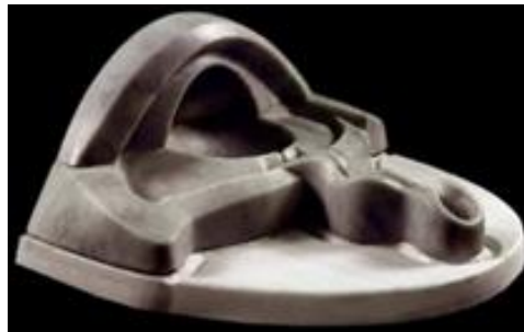
Görsel 4: Mehmet Aksoy (Yılmaz ve Yayan, 2022, s. 15).

Heykeltıraş Mehmet Aksoy'un Anadolu kültüründen beslendiği Şahmeran konulu birçok çalışması bulunmaktadır. Şahmeran'ın gözyaşı adlı eserinde; "Şahmeran'ın Dramı"nı anlatarak, bir şekilde onun acısına vurgu yapmaktadır. Bu mitolojik öyküde Şahmeran'ın yanında bulunan bir kişi onu ihbar etmiş, sanatçı da insanoğlunun Şahmeran'a yaptığı bu ihaneti, aslında doğaya ihanet edişin sembolü olarak eserinde işlemiştir" (Yılmaz ve Yayan, 2022, s. 15). Bu eserde Şahmeran'ın gözyaşı devir daim yapan bir çeşme formunda tasvir edilmiştir (Görsel 4).