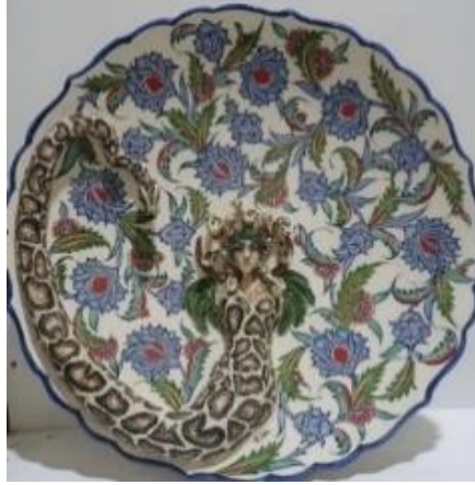
Görsel 14: Erkan Ünal (URL-18)

Kütahyalı sanatçılar Serkan Ünal kardeşi Erkan Ünal ile birlikte seramik çamurundan ürettikleri hayvan figürlerini vazo ve tabak üzerine uygulamış, üç boyutlu bir görsel elde ederek çini ve seramik sektörü içerisinde kendilerine özgü bir yer edinmişlerdir. Çalışmalarında seramik çamuru kullanmayı tercih etmektedirler. Ancak Kütahyanın çini dekoru daima arka fonda yerini almaktadır. Erkan Ünal Anadolu kültürünün ünlü Şahmeran söylencesini geleneksel form anlayışına yakın tasarımıyla eserinde yer vermektedir (URL-17). (Görsel 14). Anadolu'nun önemli seramik merkezlerinden Avanos'ta da Zübeyir Ayhan'ın çalışmasında (Görsel 15) olduğu gibi Şahmeran söylencesi ve geleneksel form canlılığını korumaktadır.