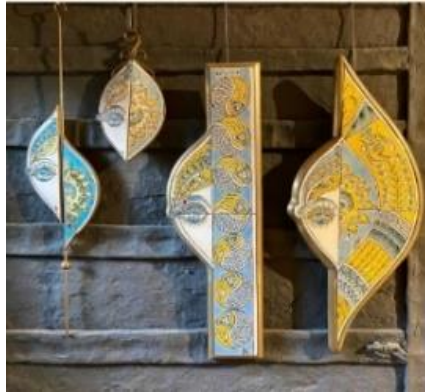
Görsel 12: Gülen Kesova (URL-15).

Gülen Kesova, kendi atölyesinde üretim yaparken bilgisini aktardığı kurslar da düzenlemektedir. Sanatçının Şahmeran konulu çini yorumu form ve deseniyle oldukça özgün ve stilize bir yaklaşım içermektedir (Görsel 12).