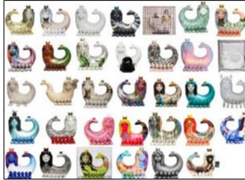
Görsel 6: ‘Şahmeran 34’ sergisi (URL-10).

Şahmeran söylencesinin şifacı kimliğine odaklanılan ‘Şahmeran 34’ (2022) sergisi ise İstanbul’un kamusal alanlarında yerini almıştır. Davetli 34 sanatçının yorumu ve imzasını taşıyan eserler Şahmeran’ın hikâyesini anlatmayı hedeflemiştir (Görsel 6). Müzayede satışından elde edilen gelir ile Şahmeran’ın bu kez kız çocuklarına şifa olması amaçlanmıştır. Serginin küratörü Marcus Graf ‘tır (Akkoyun).