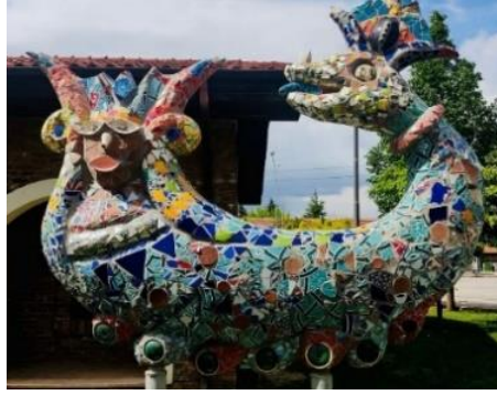
Görsel 7: B. Uzuner, S. Kaplan,V. Özel (URL-11).