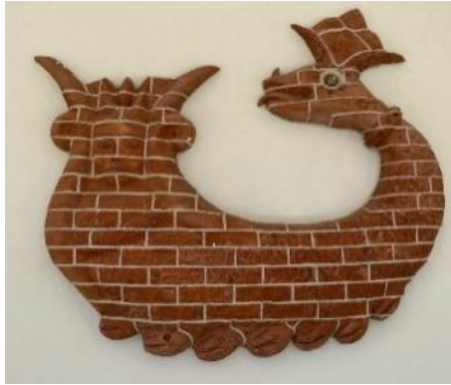
Görsel 8: B. ve O. Uzuner (URL-12).

Azize & Azime Önlü ikiz kız kardeşler ve Dokuz Eylül Üniversitesinde biri seramik ve diğeri resim eğitimi almış, sanat yaşamlarını aynı markada sürdürmektedirler. Seramik heykellerinde genellikle figüratif sürreal unsurları kullanmaktadırlar. Azize Önlü imzalı Şahmeran heykeli ise çocuklukta babalarından dinledikleri Şahmeran söylencesini içselleştirmiş olmalarının bir dışa vurumunu içermektedir. Geleneksel Şahmeran motifinin özgün bir stilizasyon ile ele alındığı görülmektedir (Görsel 9).