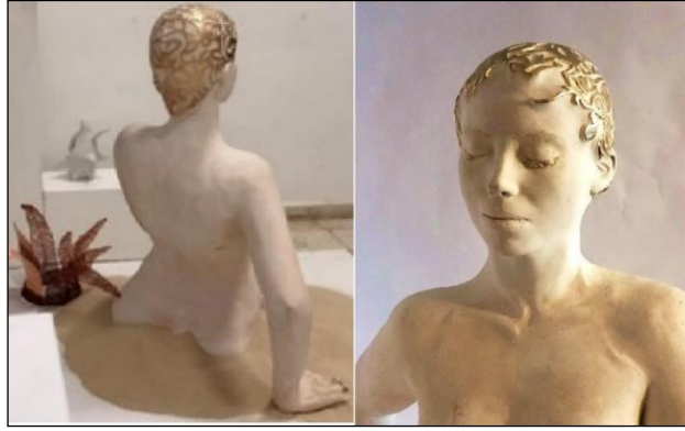
Görsel 19: B. Ceren Değirmenci

(Soldan sağa) 1. Heykel arkadan detay (Değirmenci, 2019, s. 57). 2. Heykel önden detay (Değirmenci, 2019, s. 58 ).