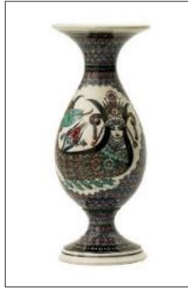
Görsel 15: Zübeyir Ayhan (URL-19).