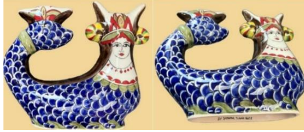
Görsel 13 : Şebnem Tuna (URL-16).

kurmuşlar ve burada yeni ve özgün tasarımlar oluşturmaktadırlar. Şebnem Tuna imzalı ve 'yılan tanrıçası Şahmeran' olarak adlandırılan seramik heykel, "her şeyi iyileştiren tanrıçayı evinizin görünen bir yerine yerleştiriniz" (URL-16) şeklinde sunulmaktadır. Bu çalışmada geleneksel Şahmeran motifine oldukça sadık kalınmıştır (Görsel 13).