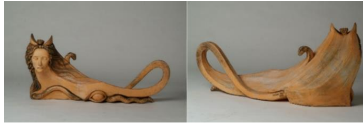
Görsel 9: Azize Önlü (URL-13).

Azize & Azime Önlü ikiz kız kardeşler ve Dokuz Eylül Üniversitesinde biri seramik ve diğeri resim eğitimi almış, sanat yaşamlarını aynı markada sürdürmektedirler. Seramik heykellerinde genellikle figüratif sürreal unsurları kullanmaktadırlar. Azize Önlü imzalı Şahmeran heykeli ise çocuklukta babalarından dinledikleri Şahmeran söylencesini içselleştirmiş olmalarının bir dışa vurumunu içermektedir. Geleneksel Şahmeran motifinin özgün bir stilizasyon ile ele alındığı görülmektedir (Görsel 9).