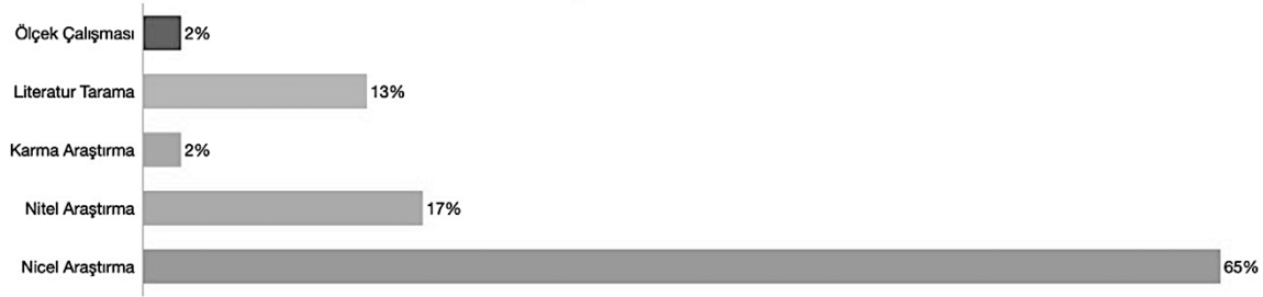
Şekil 3: Makalelerde Kullanılan Araştırma Yöntemleri

İlgili literatür araştırma yöntemleri açısından incelendiğinde ise yapılan çalışmalarda ağırlıklı olarak nicel araştırma yöntemlerinin kullanıldığı görülmektedir (bkz. Şekil 3). Nitel araştırma yöntemleri kullanılarak yapılan çalışmaların sayısı ise oldukça azdır. Bununla beraber, üniversite gençliğinin dine karşı tutumları, İslam dinine inanma düzeyleri, dinin hayatlarındaki etkisi vb. konularda onların tecrübe ve düşünceleri ile ilgili daha ayrıntılı bilgi edinilerek, hikayelerinin tespit edilmesinde nitel araştırma