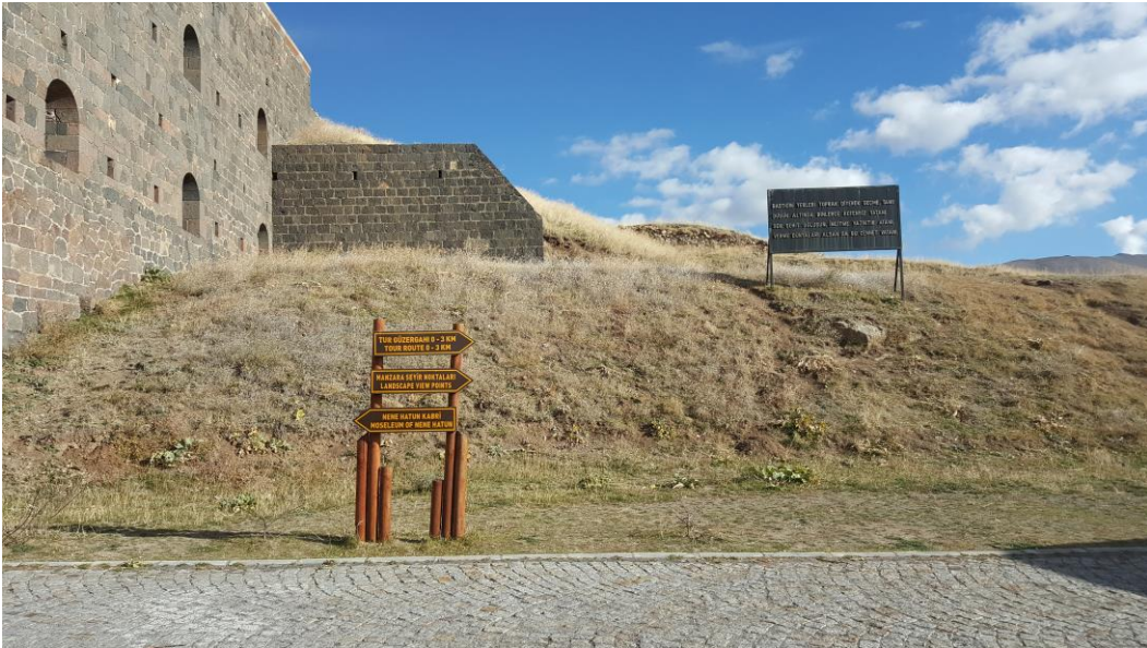
Fotoğraf 1.4. Nene Hatun Tarihi Milli Parkı İçerisindeki 1 Numaralı Aziziye Tabyası Önündeki Tur Güzergâhı Tabelaları