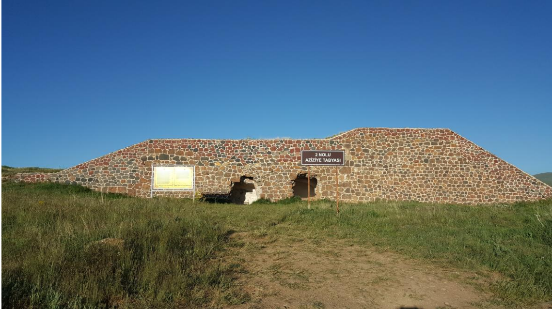
Fotoğraf 1.6. Nene Hatun Tarihi Milli Parkı İçerisindeki 2 Numaralı Aziziye Tabyası