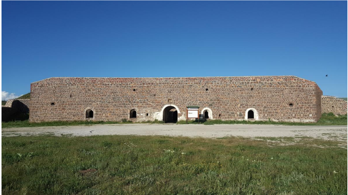
Fotoğraf 1.8. Nene Hatun Tarihi Milli Parkı İçerisindeki 3 Numaralı Aziziye Tabyası