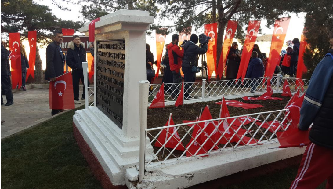
Fotoğraf 1.12. Nene Hatun Tarihi Milli Parkı İçerisindeki Nene Hatun Kabri

Anıtın hemen arkasında 1877-1878 Osmanlı-Rus Savaşı'nda cesur bir kahramanlık gösteren Türk kadını Nene Hatun'un kabri bulunmaktadır. Kabrin başındaki plakada "1877-78 OSMANLI-RUS HARBİ'NDE AZİZİYE TABYADA GENÇ KIZ İKEN RUS ASKERLERİYLE GÖĞÜS GÖĞÜSE ÇARPIŞARAK TÜRK KADINININ SAVAŞÇILIK RUH VE ASALETİNİ DÜNYAYA TANITAN KAHRAMAN TÜRK ANASI NENE HATUN'UN RUHUNA FATİHA. VEFATI 22 MAYIS 1955." yazısı bulunmaktadır. Nene Hatun'a 1952 yılında "3. Ordu'nun Nenesi" unvanı verilmiş, kendisi 1955 yılında ise Türkiye'de "Yılın Annesi" unvanı verilen ilk kadın olmuştur.