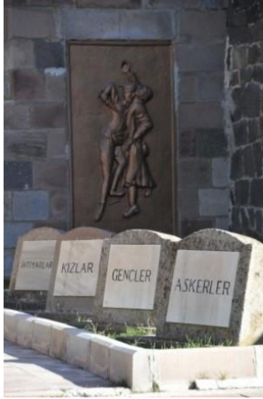
Fotoğraf 1.13. Nene Hatun Tarihi Milli Parkı İçerisindeki Aziziye Şehitleri Anıtı Yanındaki Toplu Şehitlik

Aziziye Şehitleri Anıtı'nın sağ tarafındaki “İHTİYARLAR, KIZLAR, GENÇLER, ASKERLER” isimlerinin yazılı olduğu birer mezar taşının yer aldığı alanda ise anıtın inşası sonrası yine alandaki orijinal mezarları açılarak oraya yeniden defnedilen 70 şehidin naaşı bulunmaktadır. 1952 yılında anıtın inşası sonrası söz konusu mezarlar açılarak 70 şehit anıt yanına bir arada defnedilmişlerdir. Uzun yıllar sembolik şehitlik zannedilen bu alanın sembolik şehitlik olmadığı son yıllardaki farkındalıkla ortaya çıkmıştır.