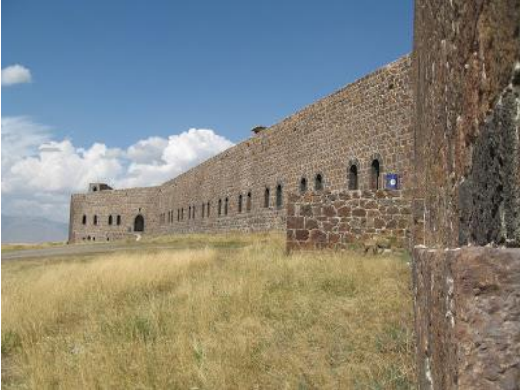
Fotoğraf 1.10. Nene Hatun Tarihi Milli Parkı İçerisindeki Mecidiye Tabyası