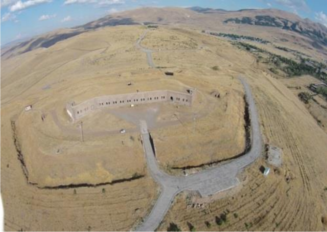
Fotoğraf 1.9. Nene Hatun Tarihi Milli Parkı İçerisindeki Mecidiye Tabyası

Yapı, savaş idaresinin yapıldığı bina ve asker barınağı olarak kullanılmış ve diğer tabyalara göre daha az tahrip olmuştur. Tabyanın ön kısmında büyük bir avlu vardır. Tabyanın orta kısmı tek katlı, yan kısımları ise iki katlıdır. Tabyada, üst kata doğru çıkan merdivenler de bulunmaktadır. Tabya içerisinde koğuş olarak değerlendirilen ayrı ayrı odalar, yemekhane şeklindeki kısımlar, hamam ve tuvalet bölümleri vardır. Mecidiye Tabyası, Erzurum şehrini yukardan gören bir tepe üzerinde şehre oldukça yakın bir konumdadır (Eymirli, 2012).