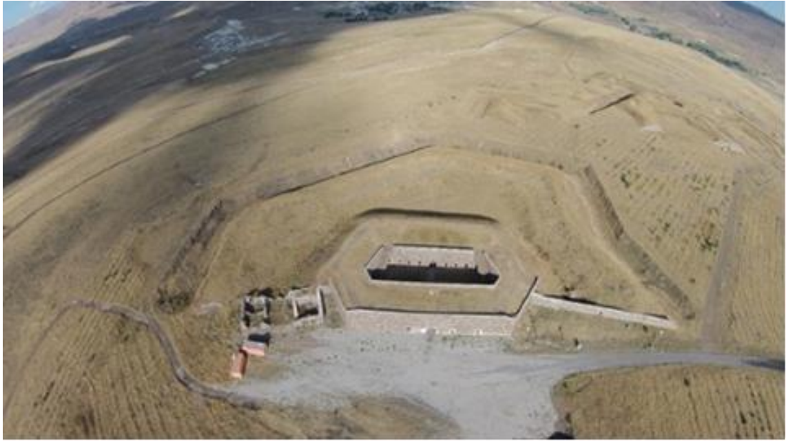
Fotoğraf 1.7. Nene Hatun Tarihi Milli Parkı İçerisindeki 3 Numaralı Aziziye Tabyası