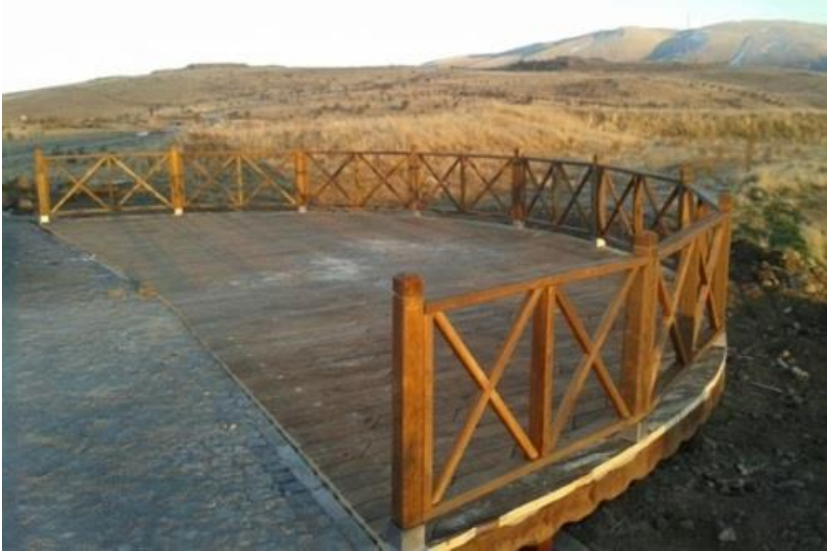
Fotoğraf 1.2. Nene Hatun Tarihi Milli Parkı İçerisindeki Manzara Seyir Teraslarından