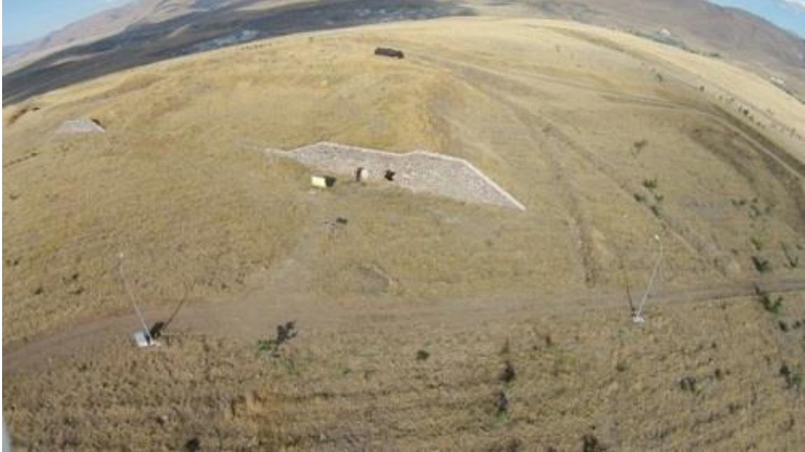
Fotoğraf 1.5. Nene Hatun Tarihi Milli Parkı İçerisindeki 2 Numaralı Aziziye Tabyası

1869-1873 yılları arasında Fosfor Mustafa Paşa'nın projesi ve nezaretinde yaptırılmıştır. Erzurum'un doğusunda bulunan Topdağı'nın güneyinde 1 Numaralı Aziziye Tabyası'nın 200 metre kuzeyinde bulunmaktadır. Aziziye Tabyaları'yla birlikte 1869-1873 yılları arasında, Sultan Abdülaziz döneminde Fosfor Mustafa Paşa'nın projesi üzerine yapılmıştır. 2 numaralı Aziziye Tabyası bugün hilal şeklindeki bir toprak yığını ve bu şeklin iki ucunda bulunan taş bir yapıdan meydana gelmektedir (Özcan, 2014). Bu yapının büyük bir kısmı bugün tahrip olmuş bir şekildedir. 2 Numaralı Aziziye Tabyası sağ ve sol kanattan oluşan iki yapı dâhilinde olup, sağ kanattaki bölüm daha sağlam olarak günümüze ulaşmıştır. Sağ kanattaki yapı, içerisindeki yaklaşık 9 metre uzunluğundaki bir dehliz ve ucunda yer alan bir odadan oluşmaktadır. Bu alanların, geçici barınak ya da cephanelik olarak inşa edildiği düşünülmektedir. 2 Numaralı Aziziye Tabyası, 8 Kasım 1877 gecesi Rus güçlerin ilk işgal ettiği yapı olmasıyla birlikte, 9 Kasım 1877'de ilk kurtarılan tabya olma özelliğini de taşımaktadır. 8 Kasım 1877 gecesi, Rus güçler, Topdağı önlerine kadar ilerlemiş ve önce 2 ve 3 Numaralı Aziziye Tabyaları'nı ele geçirmişlerdir (Doğa Koruma ve Milli Parklar Genel Müdürlüğü, 2014).