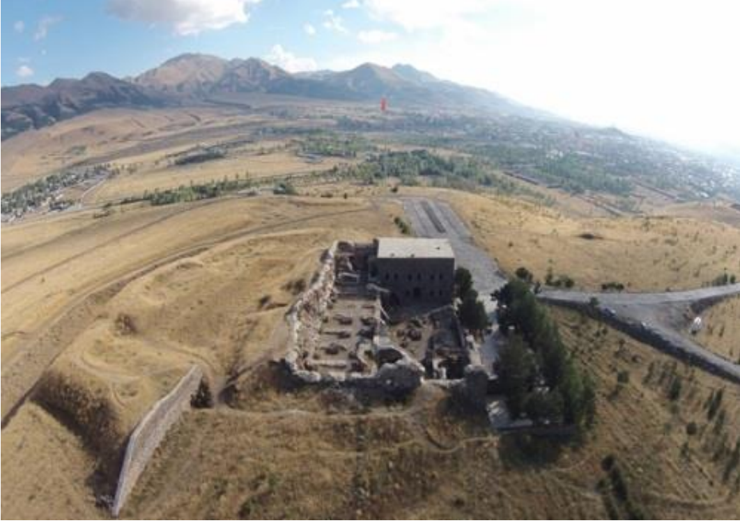
Fotoğraf 1.3. Nene Hatun Tarihi Milli Parkı İçerindeki 1 Numaralı Aziziye Tabyası

numaralı Aziziye Tabyası, güney tarafta bulunan tabyadır ve yanında Aziziye Şehitler Anıtı ve Nene Hatun' un anıt mezarı bulunmaktadır (Özcan, 2014).