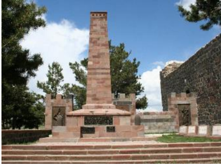
Fotoğraf 1.11. Nene Hatun Tarihi Milli Parkı İçerisindeki Aziziye Şehitleri Anıtı