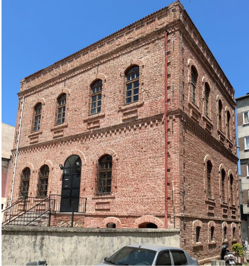
Şekil 3. Kirmasti Rum Mektebi (Taş Mektep) Arka ve Yan Cepheler