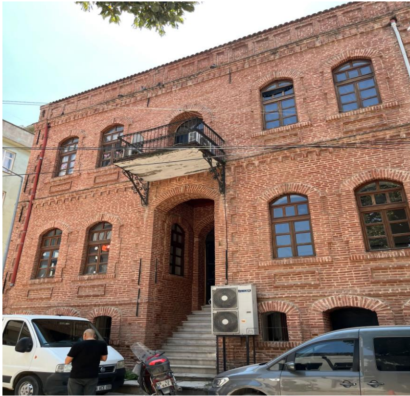
Şekil 2. Kirmasti Rum Mektebi Ön Cephe

Bey ise bu zincirin halkalarından biridir ve izinsiz olarak Rum mektebinin inşasına başlanması hakkındaki kararı hem kendisinin hem de okulun kurucusu ve Meclis-i İdâre azalarının soruşturma geçirmesini gerektirmiştir. Burada Kirmasti'deki kaymakamlar hakkında zincirleme devam eden şikâyetler bağlamında mektebin ruhsatsız inşası ile Meclis-i İdâre azalarının sorgulanması ve Kazım Bey'in de ifadesinin alınması hakkındaki süreç gayrimüslimlerin kamusal yapılarının inşasını gerçekleştirebilmek için uymaları gereken bürokratik kurallar çerçevesinde değerlendirilmiştir. Makale, arşiv belgeleri ışığında Kirmasti bölgesinde inşa edilen bir Rum mektebinin inşa sürecinin nasıl geliştiğini ve neden aksamalara uğradığını çok sayıda şahidin anlatımından karşılaştırmalı ve detaylı olarak anlamaya dönük nitel bir araştırmanın ürünüdür.