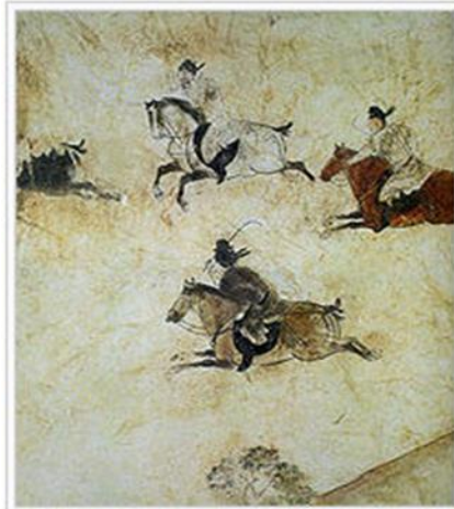
Tang Dynasty Chinese courtiers on horseback playing a game of polo, 706 AD

Jiju karşılaşmaları, genel olarak eşit sayıdan oluşan takımlar arasında oynanırken, bazen de sayısı belirlenemeyen oyuncular arasında oynanırdı. Maçın oynanacağı alana 24 tane kırmızı bayrak yerleştirilirdi. Bu bayraklar takımlar gol atıkça ödül olarak verilirdi ve maçı en çok bayrak alan takım kazanırdı. Kaynaklardan elde edilen bilgilere göre, Jiju iki kenarı eşit ve yaklaşık olarak 1000 x100 m'lik bir alanda oynadığı var olan belgelerden anlaşılmaktadır. Bu alan, polonun bu günkü alanından daha dar ve uzundur. Çinliler bu oyunu kemik, taş ya da sert ağaçlarla yapmış oldukları toplarla oynamaktaydılar. Önemli bir polo karşılaşması M.Ö. 821 yılında, Japonya ve Çin arasında Tokyo'da oynanmıştır. Oynanan bu maç, uluslararası oynanan ilk turnuva olarak bilinmektedir. Bu karşılaşmada Çinli büyükelçiler Japon İmparatoru tarafından seçilen oyunculara karşı mücadele etmiştir (Riordan ve Jones, 1999).