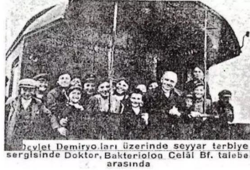
Resim 3. Sağlık Vagonundan Vitamin Tablosu ve Vagondan Fotoğraf

Sergi treni, bulunduğu yerlerde sanayideki ilerlemeyi de gözlemliyordu. Buğday üreten köylere demiryolu yetişiyordu. Bu yeni demiryollarıyla yeni pazarlar ve yeni depolar oluşuyordu. Küçük dükkân sahipleri ve el sanatları ustaları ürünlerini yine demiryolu sayesinde tanıtabiliyordu. Fabrikalar doğuyordu. Kayseri ve Sivas'ın bu fabrikalarla gelişeceğine inanılıyordu. Diğer gelişmelerle birlikte sanayileşme ve fabrikalaşmayı yine trendeki kafilé bölgeye aktarıyordu. Ancak bu gelişim yeni bir aydınlatılmayı gerektirdi: işçi hakları. Bu konuyla ilgili halkı bilinçlendiren ve bilgilendiren yine tren kafilés oldu (Vakit, 21 Mayıs 1933: 6).