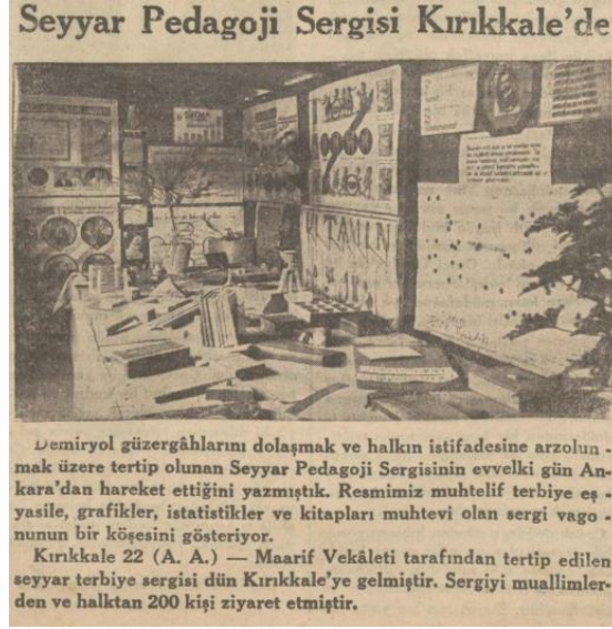
Resim 2: Kırıkkale İstasyonu (Cumhuriyet, 23 Nisan 1933: 2).

değildi. (Cumhuriyet, 23 Nisan 1933: 2). Bu demek oluyordu ki vagonlar ağırlıklı olarak çocukların eğitimi ve gelişimi için hazırlanmıştı.