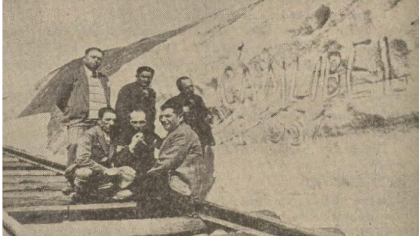
Resim 4: Tren Kfilesi: (Vakit, 23 Mayıs 1933: 6).

23 Mayıs tarihli gazetede terbiye trenindeki altı kişilik ekibinin fotoğrafı ilk kez yayımlandı. Fotoğraf, tren raylarının üstünde, Çamlıbel'de çekilmişti. O güne kadar denizden 1553 metre yükseğe çıkılmıştı; artık aşağı doğru iniliyordu. Çamlıbel steple Karadeniz Yalıboyu arasında bir sınır köyüydü. Halkla, oradaki Köroğlu efsanesiyle ilgili sohbetler yapıldı (Vakit, 23 Mayıs 1933: 6).