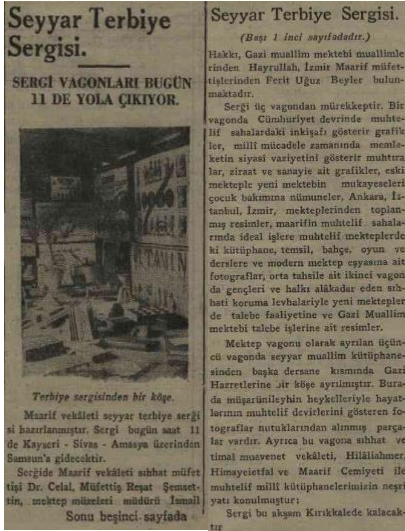
Resim 1. Sergiden Gazeteye Yansıyan İlk Fotoğraf (Hâkimiyet-i Milliye, 21 Nisan 1933: 1- 5)

Atatürk bölümü buradaydı. Aynı vagona, Sağlık Vekâleti, Maarif Cemiyeti (Eğitim Derneği), Hilal-i Ahmer (Kızılay) kütüphanelerindeki kitaplar da sergilenmeye hazır hale getirilmişti (Hakimiyet-i Milliye, 21 Nisan 1933: 1-5).