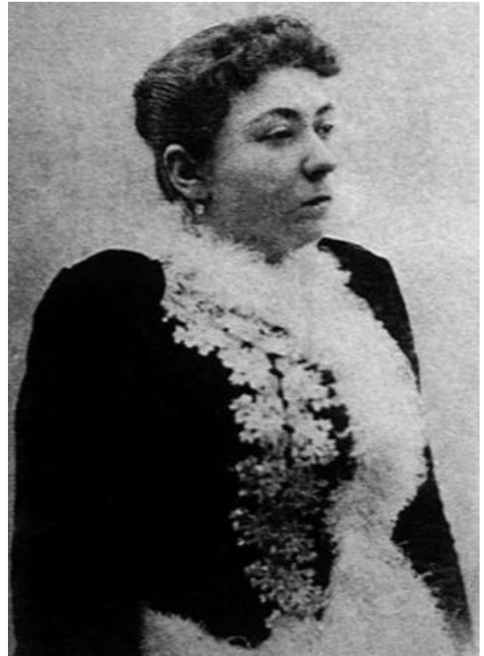
Fatma Aliye Hanım