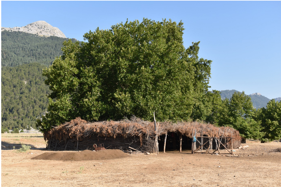
Şekil 9. Ovada çınar ağaçlarının gölgesi kullanılarak basit çevirmelerle yapılmış yataklardan bir görünüm.

Söz konusu yerleşmelerden Ormana özellikle turizm alanında sağladığı başarı ile bölgede adından söz ettiren, nüfus ve yerleşme niteliklerini geliştiren ve koruyan özelliklere sahiptir. Başlar ise hayvancılık ağırlıklı ekonomik yapısıyla dikkat çekmektedir. Çukurviran ve Sırt mahallelerinde de küçükbaş ağırlıklı olmakla birlikte hayvancılık temel ekonomik yapıyı oluşturmaktadır.