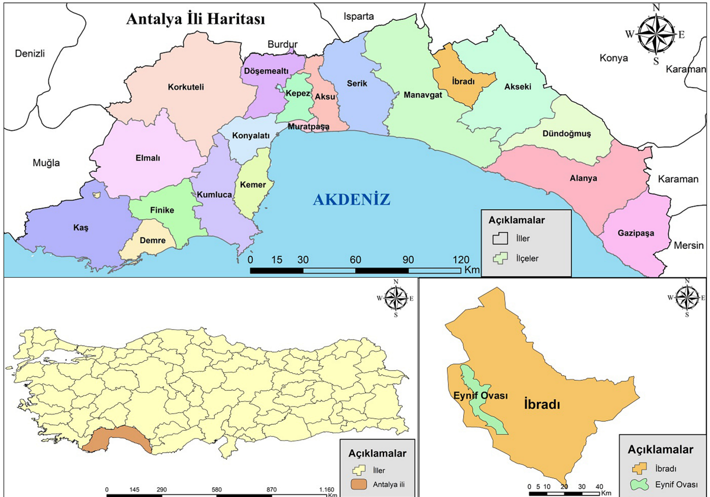
Şekil 1. Eynif Ovası'nın (İbradı) lokasyon haritası.

Halk kültüründe yılkı at, eşek sürüsü ve tek tırnaklı hayvan, doğaya başıboş bırakılmış at ya da eşek (Demir, 2001, s. 539) olarak tarif edilsede zaman zaman arazi çalışmalarımızda yapılan görüşmelerimizde sığır türlerinin hatta Aytmatov'un Elveda Gülsarı ve Gün Olur Asra Bedel romanlarında yılmıcılık ele alınmış olup, deve sürülerinin de başıboş olarak belirli zamanlarda dâhil olduğu öğrenilmiştir (Bulut, 2015, s. 348). Ancak daha çok doğada serbest halde, başıboş dolaşan atları temsil eden bir isimlendirme olan yılkinin Orhun Abideleri ve Dede Korkut hikâyelerinde günümüzdeki kullanımıyla birebir örtüşen at, at sürüsü anlamında olduğu bilinmektedir. Ülkemizde sığır sürülerinin de yılın büyük bir bölümünde belirli alanlarda yılmıya bırakıldığı bilinir. Gökçeada'da olduğu gibi koyunların da yıl boyunca başıboş salındığı özel korunaklı alanlar da vardır.