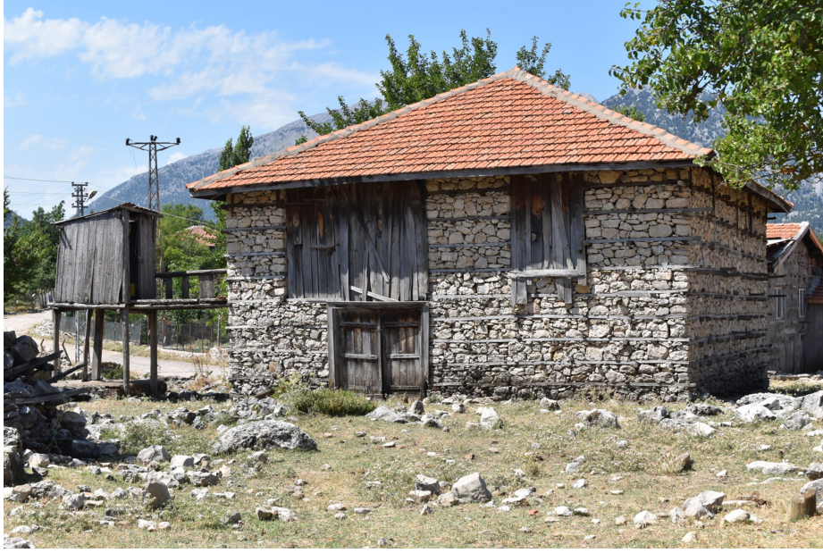
Şekil 8. Ova çevresindeki yerleşmelerde yörenin geleneksel düğmeli evleri varlığını sürdürmektedir.

alanlar dağlık ve engebeli bölgelerde son derece kısıtlıdır. Gembos Ovası ve Eynif Ovası'nda yer yer ilkbaharda oluşan muvakkat göl ve bataklık alanlarda bataklık çayırliklara rastlanır.