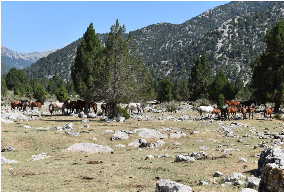
Şekil 5. Eynif Ovası'nda Yılkı aileleri genellikle günün ve yılın sıcak ve soğuk zamanlarda ovanın kenarlarındaki ağaçlık alanları tercih etmektedirler.

Eynif Ovası Yukarı ve Aşağı Eynif Ovası olarak ikiye ayrılır 1000 m. in üzerinde yükseltilere sahiptir (Şekil 3). Ovanın yükseltisi batıdan doğuya doğru yükselir. Karstik kökenli oluşumuyla polye özelliğindeki ova kenarlara doğru yükselir. Ovayı aşınım/erime artığı Bekçi Taşı denilen mevkideki basık bir kabanklık ikiye ayırır. Eynif Ovası Gemboş Ovası'ndan Boğazyurt denilen daha yüksek nispi yükseltisi 400–500 m kadar olan karstik bir topoğrafya ile ayrılır. Ovaların aksine Boğazyurt ladin, katran (sedir), çam, meşe, şimşir, karaağaç, dağ kavağı türlerinden oluşan geniş ormanlarla kaplıdır. Ova tabanında muvakkat derelerin vadi kenarlarında çınar ağaçları bulunur (Şekil 4 ve 5). Ormanlar ve su kaynakları ile ovanın otlak imkânları yıllık atlarının barınma ve beslenmesi açısından önem taşımaktadır.