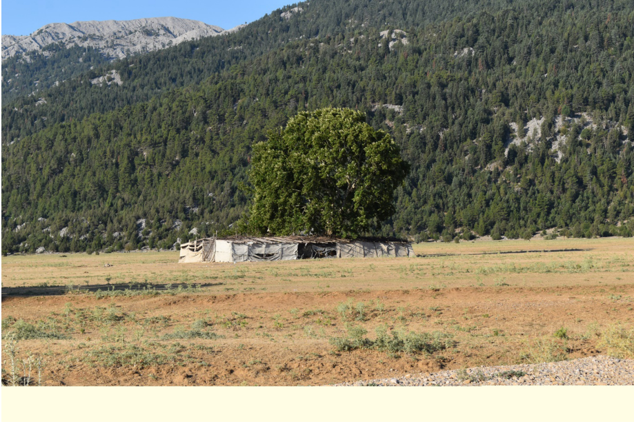
Şekil 4. Eynif Polye Ovası düzlükleri ve dağlık yamaçlardan bir görünüm.

en güçlü üyesinin liderlik ettiği bir hiyerarşik yapı söz konusudur. Bu durum da araştırmalarımız esnasında tarafımızdan da gözlemlenmiş olup, yörede yaşayanlar tarafından da atların gündelik hareketleri ve sosyolojisi ile ilgili tanım ve tarifler tüm ayrıntısıyla aktarılmaktadır.