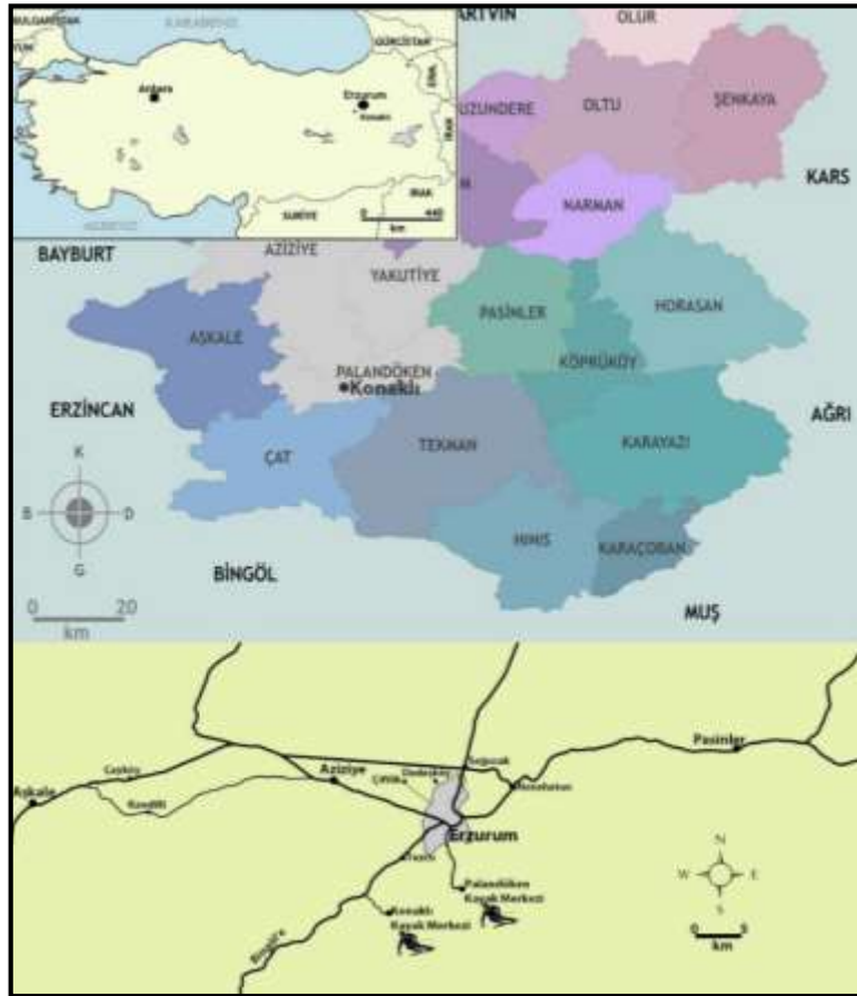
Şekil 1: Araştırma sahasının konumu