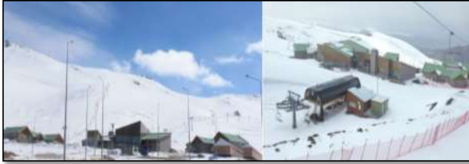
Fotoğraf 4: Kafe, yemekhane, kayak kiralama ve gişe işlemleri, gibi bazı ihtiyaçların karşılandığı hizmet binaları.

2.3.3.Hizmet Binaları: Kayak merkezinde, farklı amaçlarla inşa edilmiş hizmet binaları bulunmaktadır. Bu binalarda kafe, yemekhane, sporcuların dinlenme alanları, kayak kiralama ve gişe işlemleri, sivil savunma (arama-kurtarma), sağlık birimi, çocuk kreşi, kayak okulu yer almaktadır (Fotoğraf 4). Bu birimlerden bir kısmı aktifken bir kısmı sadece 25. Dünya Üniversite Kış Oyunlarında kullanılmış, sonrasında hizmete kapatılmıştır. Ayrıca karın ezilmesi ve pistlerin düzenlenmesini sağlayan snowtrack adı verilen araçlar ile bunların bakımının yapıldığı ve koruma altına alındığı bakım binası, jeneratörler ve trafoların bulunduğu binalarda bulunmaktadır. Bunun yanı sıra su, kanalizasyon, elektrik, telefon ve internet altyapısı mevcuttur. Ayrıca yaklaşık 300 araç ve 20 otobüsün park yapabileceği alanlar da oluşturulmuştur.