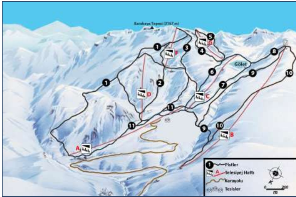
Şekil 3: Konaklı Kayak Merkezindeki pistler ve telesiyej hatları (Kayak Federasyonu verilerinden faydalanılarak çizilmiştir).

uluslararası standartlarda farklı zorluk derecelerine sahiptir. Pistlerin toplam uzunluğu 33100 m'dir (Tablo 3, Şekil 3). Pistlerin uzunluklarına bakıldığında, 4600 m uzunluğundaki 1 numaralı pist en uzununu iken; 1100 m uzunluğundaki 11 nolu (Acemi) pistin en kısası olduğu görülür. Dünya Üniversite Kış Oyunları Alp Disiplini Yarışları'nın büyük bir kısmı 1 ve 3 nolu pistte (Fotoğraf 2) yapılmıştır.