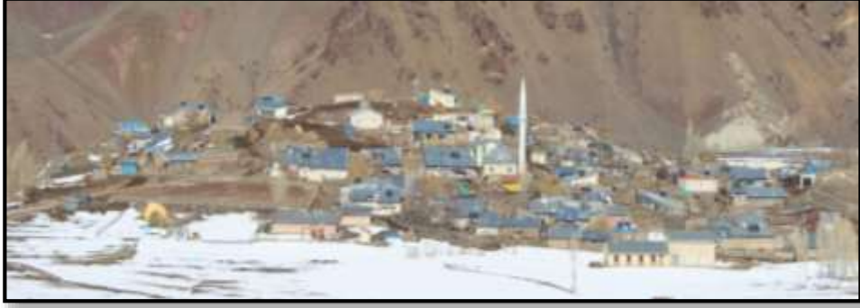
Fotoğraf 1: Kayak merkezine ismini veren ve buranın 3 km kuzeyinde yer alan Konaklı Köyü