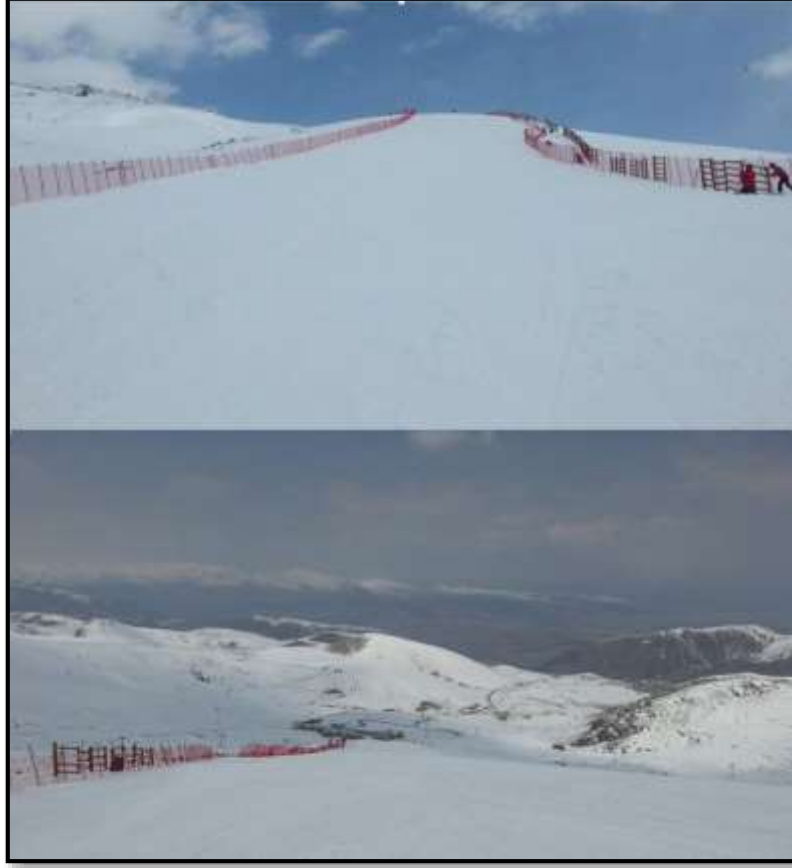
Fotoğraf 2: Konaklı kayak merkezinde uluslararası Alp Disiplini kayak yarışlarının yapıldığı 3 nolu pistten görünüm.

Mevcut 11 pist ihtiyacı karşılamakta olup, istenilmesi halinde pist sayıları artırılabilir. Karın olmadığı ya da yetersiz olduğu dönemlerde kullanılmak üzere suni kar yapma sistemi inşa edilmiş olup; bütün pistlerde bulunmakta ve toplam 62 hektarlık bir alanı karlayacak kapasitededir. Bunun için pistlerin uygun yerlerine direkler halinde bu sistem döşenmiş, suni karın yapılabilmesi için C liftinin batısında gölet inşa edilmiş ve etrafı tel örgülerle çevrilmiştir (Fotoğraf 3). Suni kar yapma sistemleri sayesinde, sezon süresince, kar eksikliği nedeniyle kayak yapamama problemi önemli ölçüde ortadan kalkmaktadır. Yani doğal takvim, beşeri müdahaleler ile uzatılmıştır.