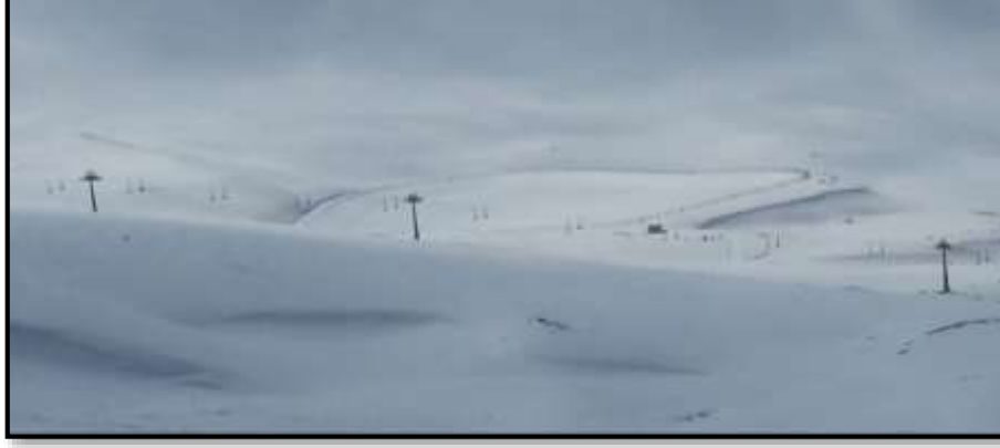
Fotoğraf 3: Suni kar yapmak için inşa edilen ve tel örgülerle çevrilen gölet

2.3.2. Telesiyejler (Liftler): Kayak merkezinde en önemli donanımlardan biri de telesiyejlerdir. Bu taşıma üniteleriyle pistlerin üst noktalarına çıkılarak buradan kayak yapılabilir. Konaklı'da tamamı dört sandalyeli altı telesiyej vardır. En uzun (D telesiyeji) 1761 m, en kısası ise (F telesiyeji) 771 m uzunluktadır (Şekil 2). Toplam uzunlukları 8210 m'dir (Tablo 4). Bu liftlerle saatte 9193 kişi taşınabilmekte olup, D lifti en yüksek taşıma kapasitesine sahiptir (saatte 2400 kişi) (Tablo 4). Kayak için en fazla tercih edilen 1-2-3 nolu pistlere D liftiyle çıkılması taşıma kapasitesinin diğer pistlere göre fazla olmasının sebeplerindedir. F ve G liftleri ikinci aşamada binilen liftler durumunda olup, sadece bu iki taşıma ünitesiyle 3000 m'nin üzerine çıkılmakta, zirveye en yakın yerlere kadar ulaşıp; daha eğimli ve uzun pistlerde kayılabilmektedir.