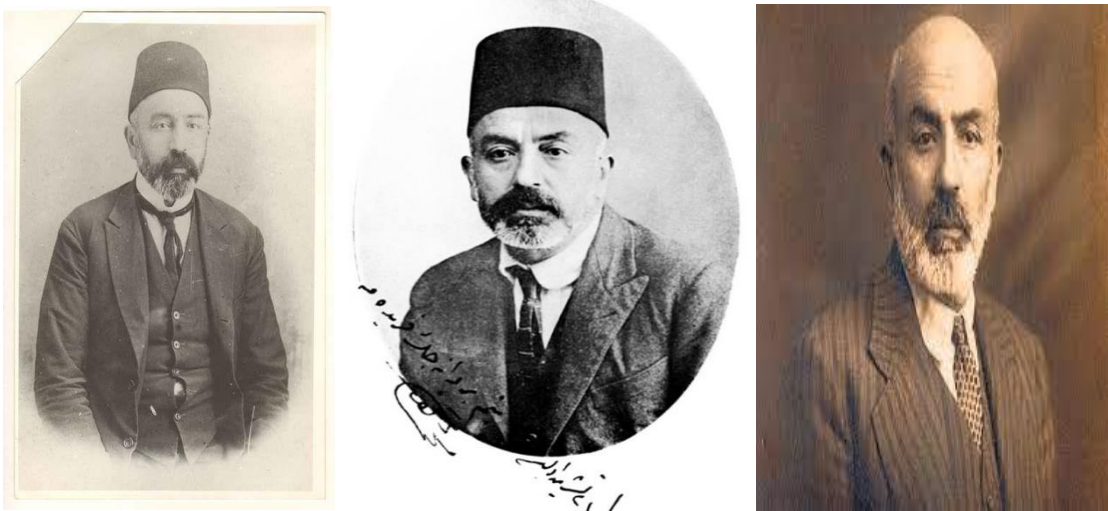
Fotoğraf 2. Mehmet Akif Ersoy'un Farklı Açılardan ve Farklı Zamanlarda Çekilmiş Fotoğrafları Kaynak: http://www.mehmetakifvakfi.org.tr/magazine?id=fotograf-albumu-1#page/10-24-27 (13.08.2021)

Bu şekilde son zamanlarda insan yüzü hakkında yapılan çeşitli araştırmalar, Akif'in yüz analizi ve benlik sunumu konusunun belirlenmesi üzerinde etkili olmuştur. Kişilik ve benlik sunumunda dışa yansıyan ve adeta bir ayna görevini yerine getiren yüz ifadesinin analiz gücünden faydalanmak için yukarıda yer verilen Mehmet Akif Ersoy'un farklı zamanlarda ve farklı şekillerde çekilmiş fotoğrafları kullanılmıştır.