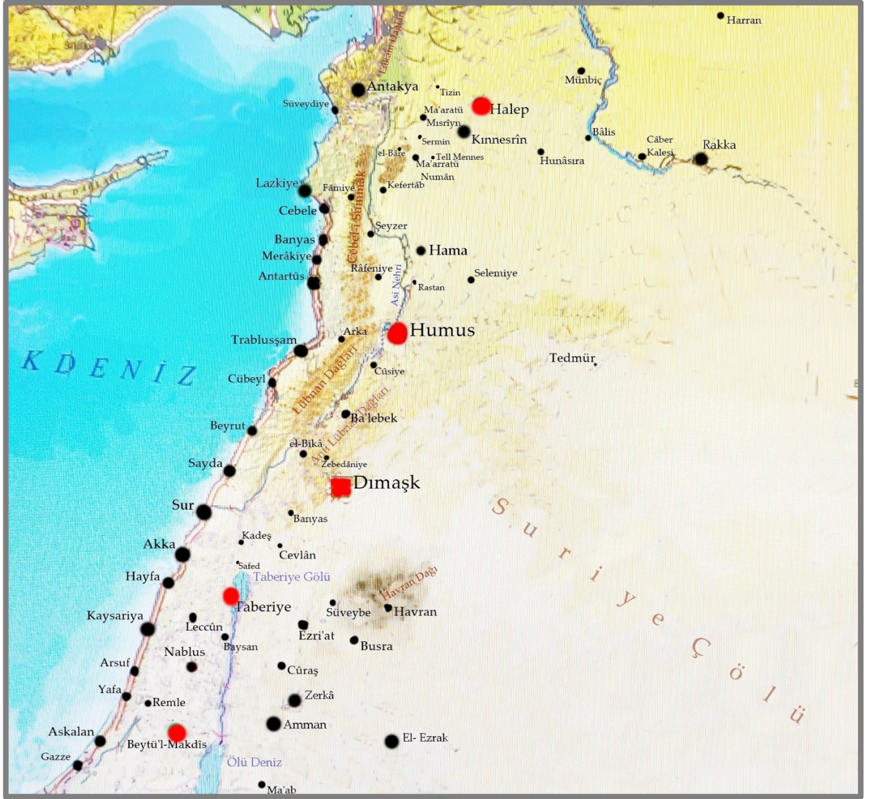
Fig. 1: Şam Bölgesi Fiziki Harita Kaynak Google Maps Düzenleyen Zafer ÖZDEMİR